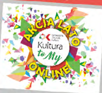
Akcja Lato Online 27-31.07.2020 r.