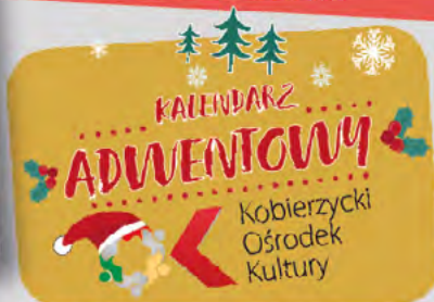
Kalendarz Adwentowy KOK 29.11-24.12.2020 r.