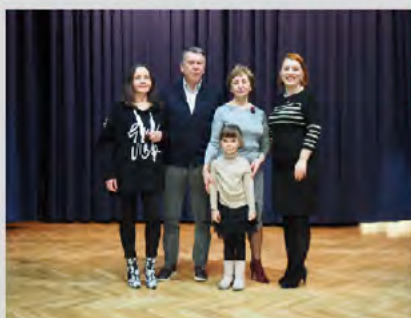
Rockandrollowy Dzień Babci i Dziadka z Wojciechem Gąssowskim 22.01.2020