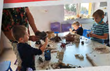
Dzień otwarty sekcji KOK 12.09.2020 r.