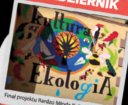
Finał projektu Bardzo Młoda Kultura 2019-2021