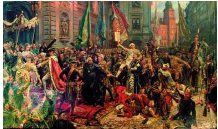
Jan Matejko, Konstytucja 3 Maja 1791 roku