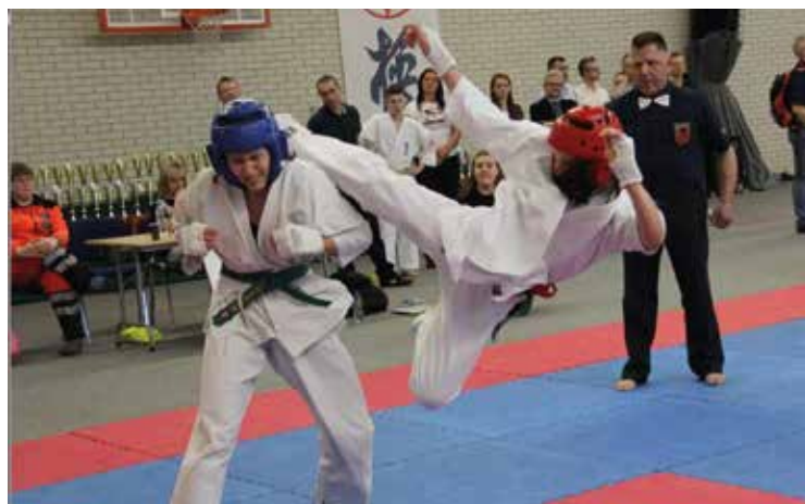
Wiele walk obfitowało w efektywne akcje