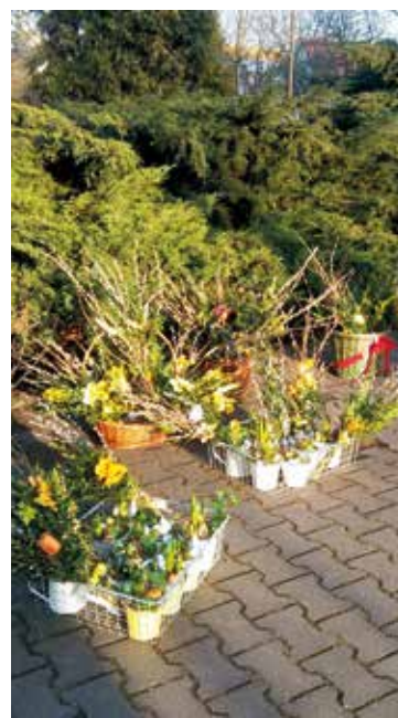
Palmy wielkanocne symbolizują odradzające się życie

Zarząd Stowarzyszenia „Bielany dla Ciebie”