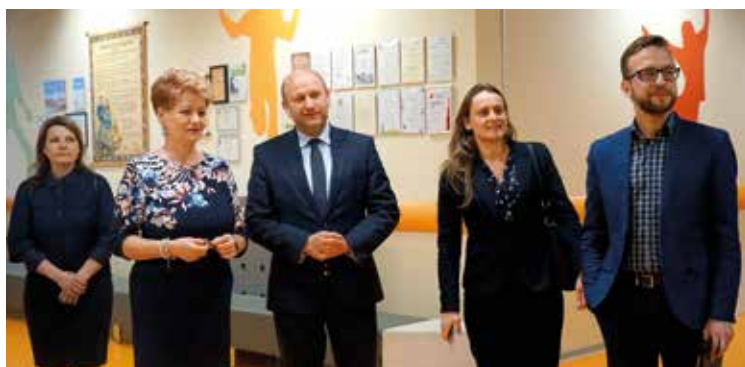
Wizyta delegacji łotewskiej

Przypomnijmy, że na terenie obiektu aż 4 projekty zostały zrealizowane przy udziale środków unijnych - budowa przedszkola z dofinansowaniem 1.996.948,79 zł, budowa szkoły podstawowej z dofinansowaniem 1.525.423,02 zł, budowa żłobka z dofinansowaniem 1.838.785,23 zł oraz projekt realizowany w przedszkolu w Wysokiej: „Edukacja i partnerstwo bez barier – upowszechnienie i zapewnienie wysokiej jakości edukacji przedszkolnej poprzez utworzenie nowych miejsc wychowania przedszkolnego, organizację dodatkowych zajęć edukacyjnych dla dzieci oraz podnoszenie kwalifikacji na-