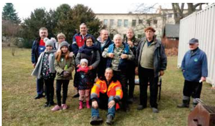
Sprzątający zebrali kilkadziesiąt worków odpadów