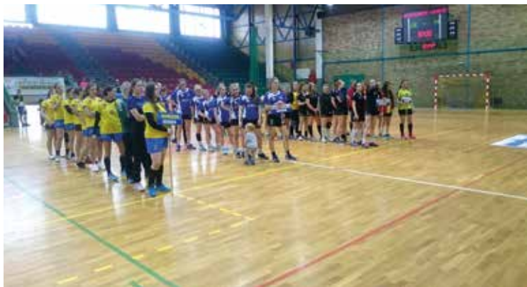
Drużyna SP Kobierzycy (żółto-niebieskie stroje) wywalczyła III miejsce

Nasza szkoła nie miała szczęścia w losowaniu par półfinałowych i trafiła na zdecydowanego faworyta, późniejszego zwycięzcę, Gimnazjum nr 2 w Legnicy. W drugiej parze los skojarzył Gimnazjum Mirsk oraz SP 3 Dzierżoniów. Niestety w półfinale