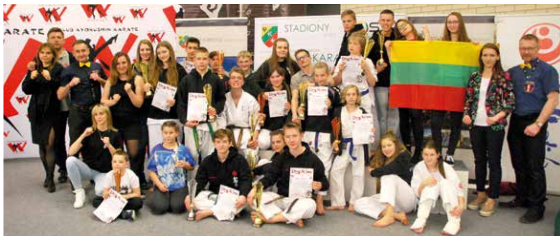
Karatecy z Kobierzycy wywalczyli ogółem 14 medali

jedynego w Polsce turnieju o tak dużej frekwencji dzieci oraz młodzieży. W turnieju wzięło udział blisko 500 zawodników.