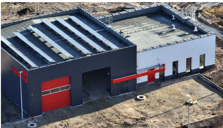
Remiza strażacka w Kobierzycach