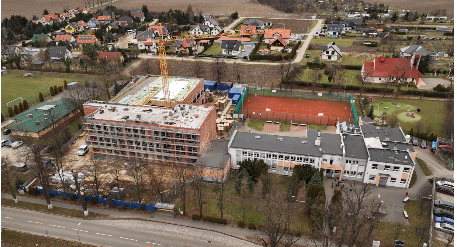
Szkoła w Pustkowie Żurawskim

Rok 2023 za nami. Jaki był, czy udało się zrealizować inwestycyjne zamierzenia i czego mogą oczekiwać mieszkańcy naszej gminy w 2024 roku – na te pytania i odpowiedzi udzielił: Ryszard Pacholik, Wójt Gminy Kobierzyce i Piotr Kopec, Zastępca Wójta Gminy Kobierzyce.