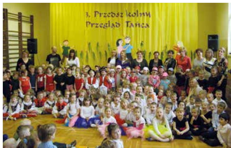
Jeszcze tylko pamiątkowe zdjęcie