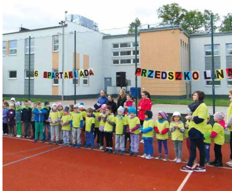
Mali sportowcy na start!