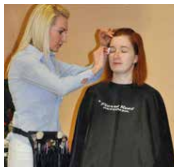
Jeszcze tylko mały retusz – i gotowe!

W ostatnim czasie mieszkanki sołectwa Pełczyce i nie tylko, spotkały się w świetlicy wiejskiej ze specjalistką od wizażu i makijażu. Panom był wstęp wzbroniony. Na spotkanie przybyła liczna rzesza Pań chcących skorzystać z profesjonalnych porad. Przy przygotowanym poczęstunku, zostały zaprezentowane najnowsze trendy w makijażu właściwym dla różnych typów urody oraz dostosowane do każdego wieku. Każda z Pań uczestniczyła w indywidualnej profesjonalnej konsultacji, a wizażystka wykonała naprawdę piękne makijaże. Podczas spotkania Panie uczestniczyły w licznych konkursach, którym towarzyszył śmiech i dobra zabawa. Na zakończenie spotkania wszystkie uczestniczki otrzymały katalogi z najnowocześniejszymi trendami w makijażu oraz bony zniżkowe na zakup kosmetyków,