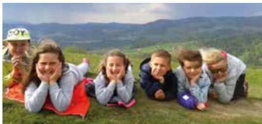
Z góry lepiej widać

Towarzystwo Przyjaciół Dzieci Koło Turystyczne Kobierzycze zakończyło realizację wiosennego projektu „Poznajemy dziedzictwo narodowe, kulturowe i turystyczne Polski” współfinansowanego przez Gminę Kobierzycze. Program objął dwie wycieczki: jedną po ziemi kłodzkiej, drugą po Beskidzie Śląskim. W wycieczkach wzięło udział 95 dzieci i kilkunastu wychowawców ze szkół Gminy Kobierzycze. W majowej wycieczce po ziemi kłodzkiej uczestniczyli drugoklasiści Szkoły Podstawowej z Kobierzyc. Ziemia kłodzka jest bardzo bogata historycznie oraz turystycznie. Dzieci zwiedziły kopalnię złota w Złotym Stoku, podziemia oraz Park Nauki przy kopalni, hutę szkła artystycznego w Polanicy Zdroju oraz Park Narodowy Gór Stołowych. Dzieci z Pustkowa Wilczkowskiego oraz z Pustkowa Żurawskiego spędziły trzy dni w Beskidzie Śląskim. – „Pierwszego dnia zwiedziliśmy Wisłę, zobaczyliśmy skocznię Adama Małysza oraz Muzeum z jego pamiątkami i trofeami. Udało nam się także odwiedzić prawdziwą chatę góralską, w której sympatyczny, wesoły góral w zabawny sposób opowiedział nam o dawnym i teraźniejszym życiu ludzi w tamtym regionie. Byliśmy również w Koniakowie na wystawie koronek oraz w miejscu, gdzie spotykają się granice trzech państw – Słowacji, Czech i Polski. Drugi dzień był dla nas wszystkich sprawdzianem wytrzymałości fizycznej.