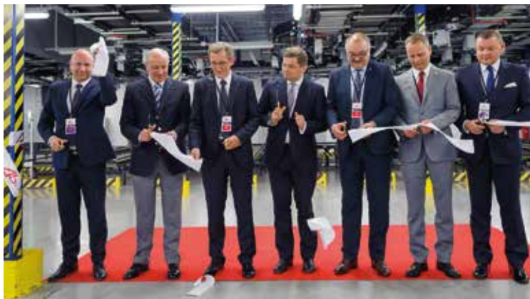
Moment przecięcia wstęgi