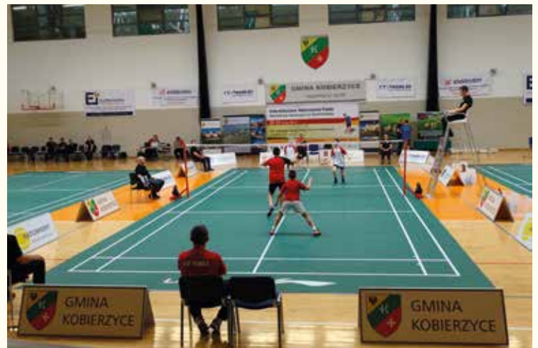
Rywalizacja w kobierzycyjskiej hali stała na wysokim poziomie