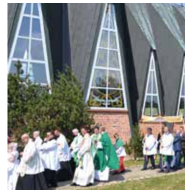
Procesja wokół kościoła w Domasławiu