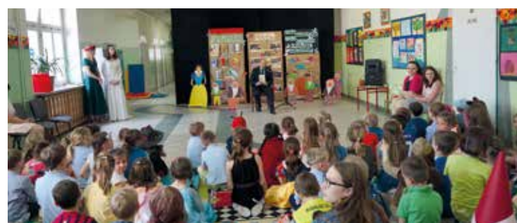
Gdy dorośli czytają, dzieci chętnie słuchają