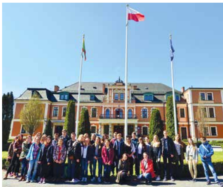
Młodzież z wymiany przed Urzędem Gminy