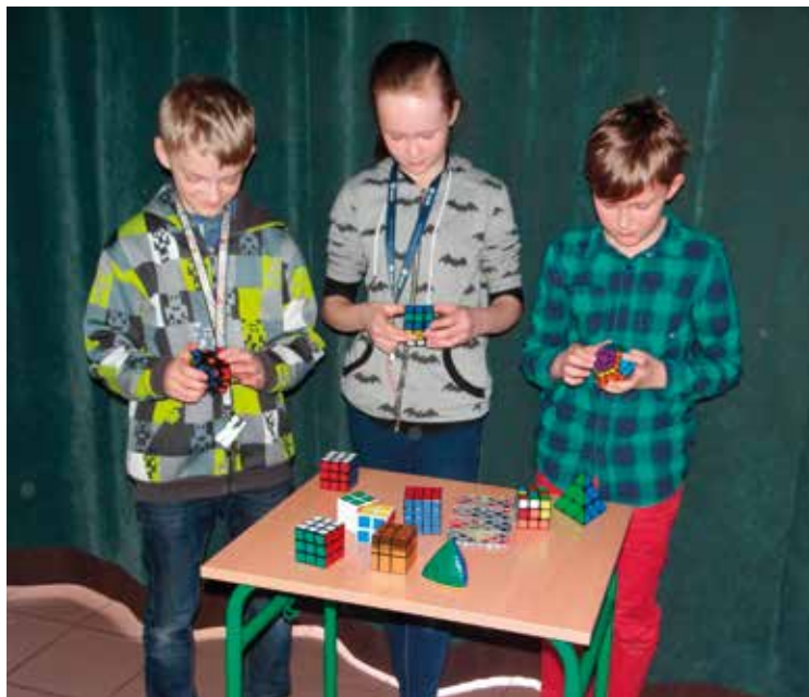
Mistrzowie w układaniu Kostki Rubika w akcji