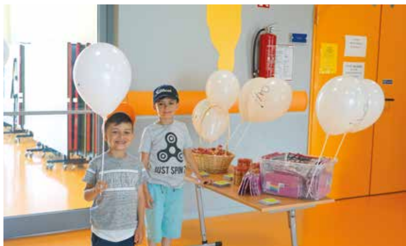
Uczniowie uśmiechem witali przybyłych gości