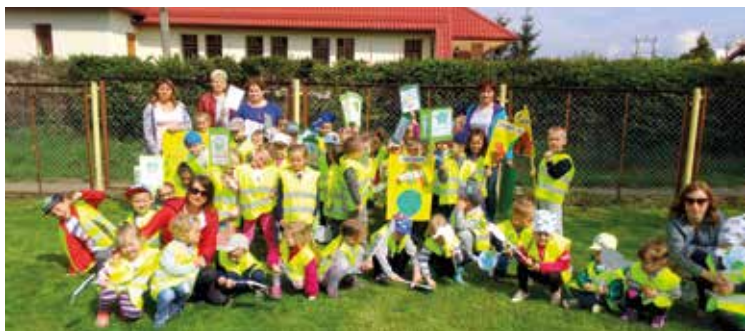
Mali ekolodzy z Pustkowa Żurawskiego