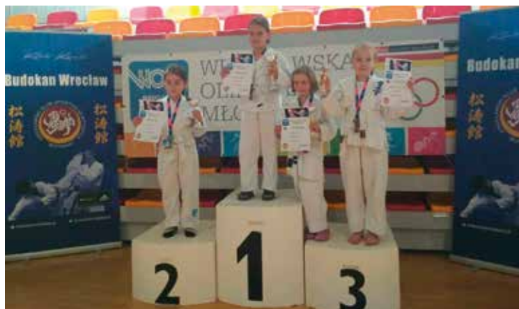
Karatecy z Wysokiej spisali się na medal!