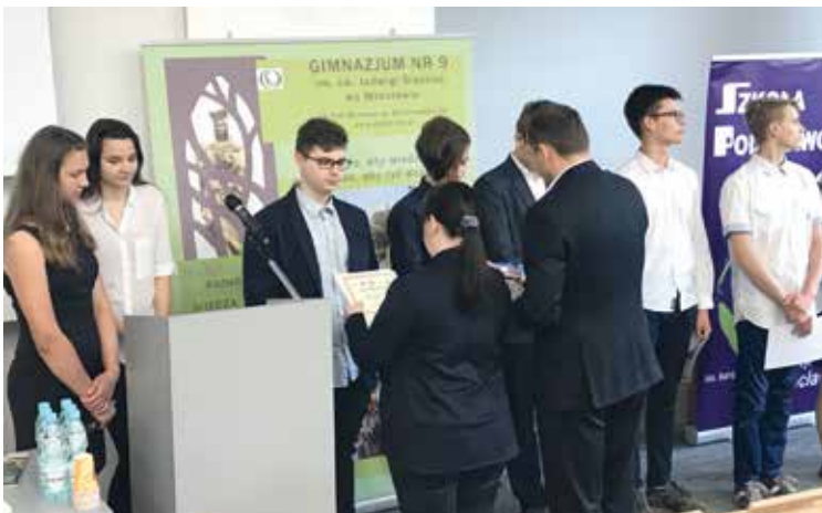
Laureaci XIII Wrocławskiego Konkursu Matematycznego