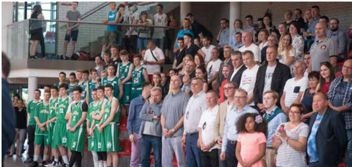
Na trybunach nie brakowało byłych reprezentantów Polski w koszykówce