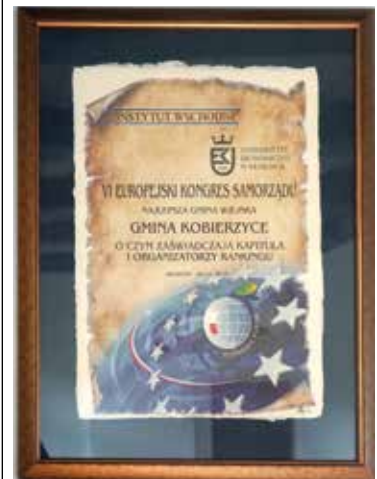
Pamiątkowy dyplom uznania dla Gminy Kobierzyce