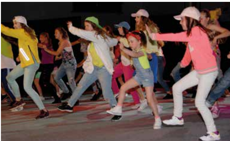
Występy grup tanecznych bardzo się podobały