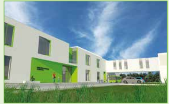
Projekt rozbudowy Zespołu Szkolno-Przedszkolnego w Tyńcu Małym

– Nasze bezpośrednie sąsiedztwo z Wrocławiem, dogodne