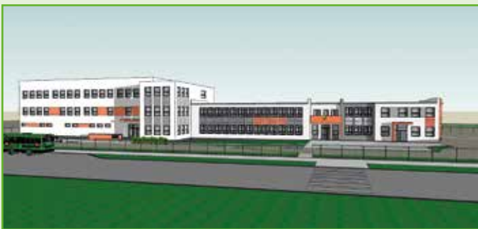
Projekt rozbudowy Zespołu Szkolno-Przedszkolnego w Pustkowie Żurawskim

Nie bez znaczenia są też zmiany w systemie szkolnictwa, które samorządom, jako tak zwanym „organom prowadzącym” i rodzicom fundują kolejne rządy. Zwykle jest tak, że czasem wręcz rewolucyjne pomysły warszawskich polityków, potem spadają pod postacią „konieczności dostosowania systemu” na barki wójtów, burmistrzów i prezydentów zmuszając ich do nieplanowanych działań także tam, gdzie wcześniej nie było już potrzeb. Na szczęście władze Gminy Kobierzyce radzą sobie z tego rodzaju problemami na bieżąco.