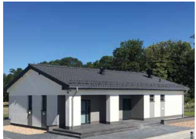
Na ten obiekt piłkarze z Solnej czekali z niecierpliwością