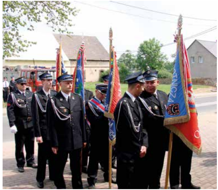
Poczty sztandarowe na czele przemarszu

kle widowiskowy przemarsz uczestników uroczystości przez centrum Pustkowa Wilczkowskiego w kierunku miejscowego boiska. Tam, odbyła się część oficjalna jubileuszowych obchodów. Po uroczystym apelu odbyły się mini zawody strażackie, pokaz sztucznych ogni, a zabawa tanecz-