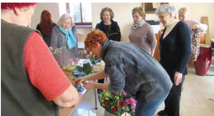
Uczestnicy warsztatów zapraszają nowe osoby z pomysłami