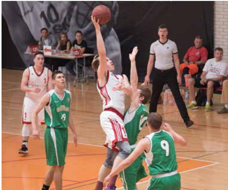
Spotkania młodych koszykarzy stały na wysokim poziomie