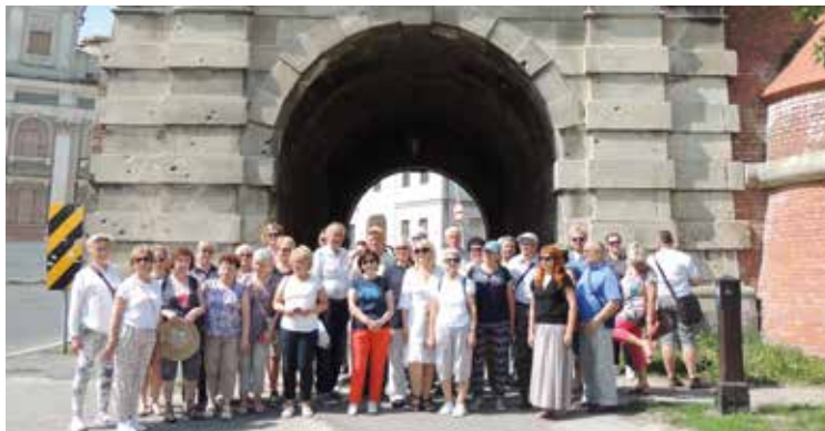
Uczestnikom wycieczki dopisała pogoda i humory

Zarząd Stowarzyszenia „Bielany dla Ciebie”