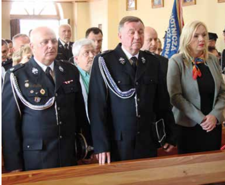
Uczestnicy uroczystości w czasie Mszy Św.

którzy gościli w tym dniu delegację zaprzyjaźnionych jednostek OSP oraz przedstawicieli władz samorządowych Gminy Kobierzycy, Związek OSP, służby PSP i wielu sympatyków ruchu strażackiego. Doskonałą oprawę uroczystości stanowiły poczty sztandarowe OSP i niezawodna orkiestra dęta z Kobierzycy. Z jej udziałem po odprawionej Mszy Św. odbył się niezwy-