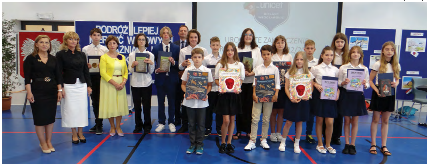
ZSP w Bielanych Wrocławskich