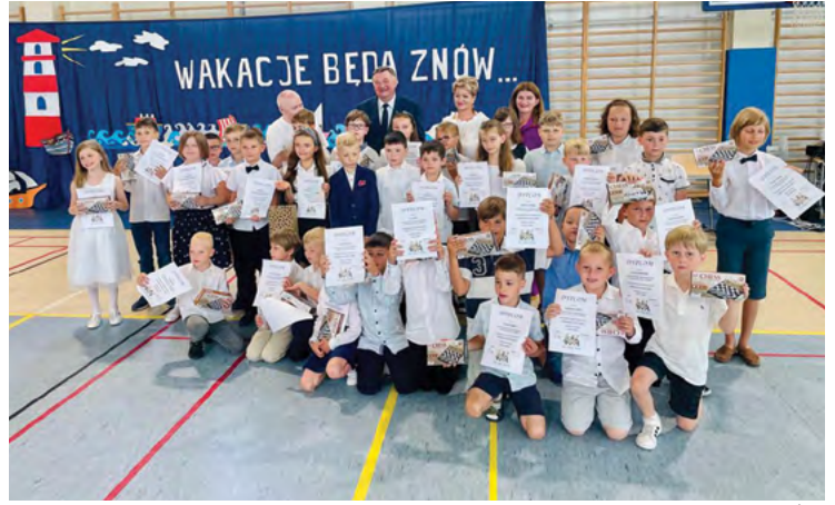
ZSP w Wysokiej