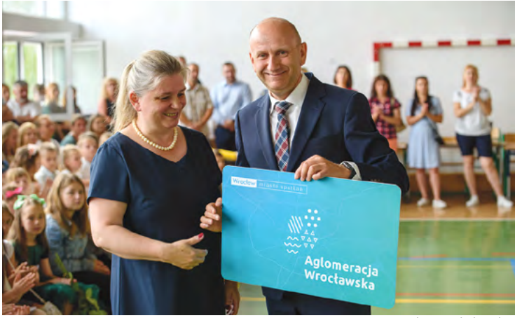
SP w Pustkowie Wilczkowskim