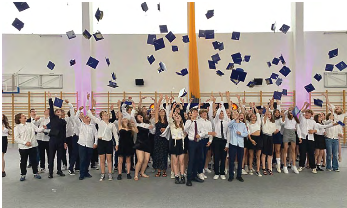
ZSP w Tyńcu Małym