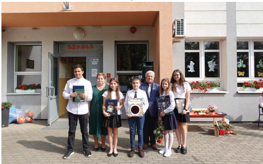
ZSP w Pustkowie Żurawskim