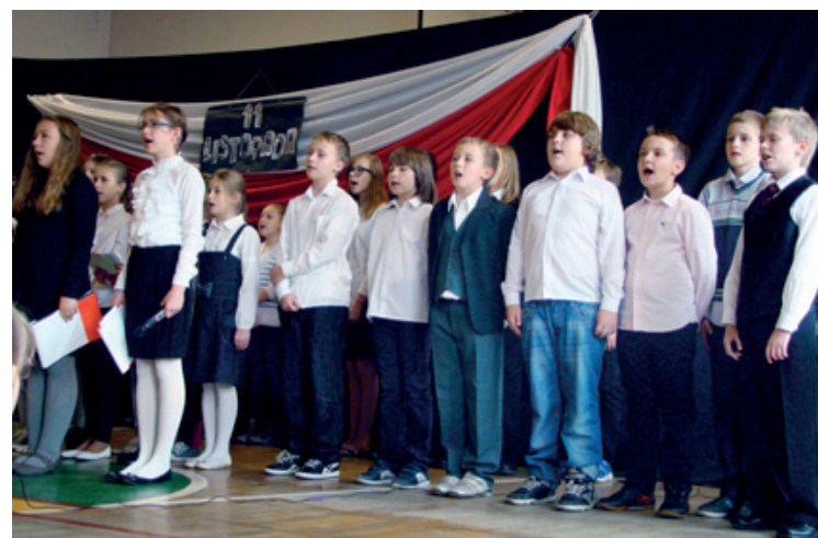
Fragment uroczystości w SP w Tyńcu Małym

Uczniowie szkół z terenu Gminy Kobierzycy również uroczysto uczcili 95. Rocznicę Odzyskania Niepodległości przez Polskę. Przygotowali programy artystyczne wypełnione patriotycznymi pieśniami oraz wierszami. Oto krótka foto relacja.