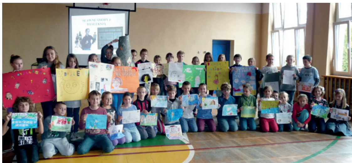
Uczestnicy zajęć ze swoimi pracami

W Szkole Podstawowej w Tyńcu Małym pod koniec października został zorganizowany „Tydzień Świadomości Dysleksji” w ramach obchodów Europejskiego Tygodnia Świadomości Dysleksji. Celem akcji było uświadomienie rodzicom, nauczycielom i uczniom problemu dysleksji oraz pokazanie metod i form pomocy. Środowisko szkolne zapoznało się ze zjawiskiem dysleksji rozwojowej. Uczniowie poznali biografie sławnych ludzi z dysleksją. Mogli ocenić swoje wiadomości biorąc udział w konkursie wiedzy o dysleksji, wziąć udział w konkursie plastycznym, który dotyczył wykonania plakatu o dysleksji lub ilustracji do baśni J. Ch. Andersena oraz w konkursie literackim na zredagowanie najśmieszniejszego dyktanda ortograficznego. Cała społeczność szkolna uczestniczyła w spotkaniu, na którym przedstawiono zagadnienia związane z dysleksją. Uczniowie uzyskali wiele informacji o tym, jak podejmować wysiłek zmagania się ze swoimi trudnościami w nauce czytania