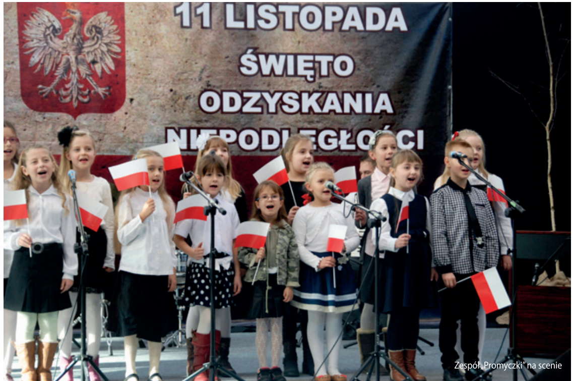
Zespół „Promyczki” na scenie

W podniosły nastrój znakomicie wkomponowało się widowisko słowno-muzyczne w wykonaniu dzieci i młodzieży z Gmin-