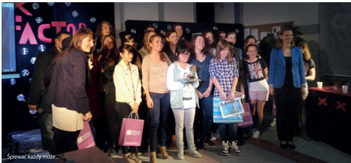
Śpiewać każdy może...