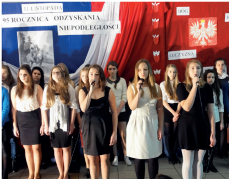
Uroczystości w Gimnazjum w Kobierzycach