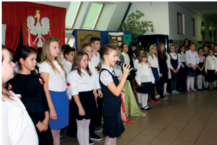
Akademia w SP Kobierzycy

11 Listopada jest dla Polaków jednym z najważniejszych świąt i to nie tylko dlatego, że Polacy po latach zaborów, zmaganiach na różnych frontach i powstaniach narodowych odzyskali wolność i ojczyznę ale także dlatego, że potrafili się zjednoczyć.