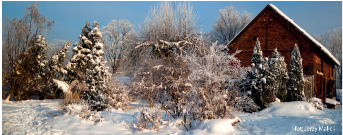
fol. Jerzy Malicki

Przykładowo z odpadów w postaci jednego miliona telefonów komórkowych odzyskano w USA około: 34 kg złota, 350 kg srebra, 15 kg palladu, 15,87 ton miedzi. Metale te można wykorzystać do wytwarzania czajników, plomb dentystycznych, czy instrumentów muzycznych.