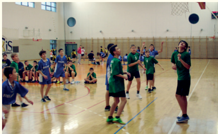
Zawody w Kobierzycach