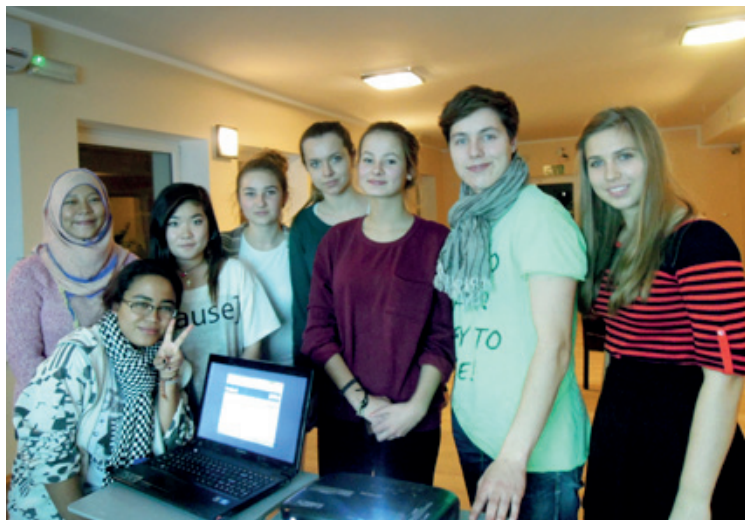
Warsztaty w Długopolu

W listopadzie, już po raz kolejny w tym roku, Gimnazjum im. UNICEF w Bielanych Wrocławskich wzięło udział w warsztatach językowych w Długopolu Zdroju zorganizowanych przez Europejskie Forum Młodzieży.