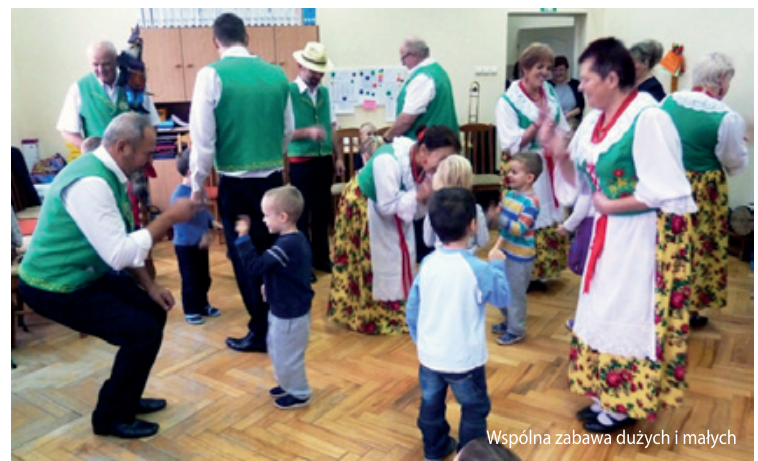
Wspólna zabawa dużych i małych