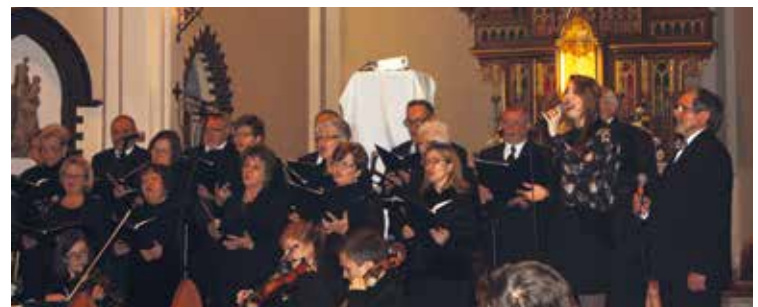
Fragment koncertu w kobeřickim kościele