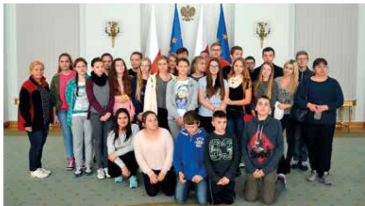
Gimnazjaliści z Kobierzyc zwiedzili Warszawę

Ważnym punktem programu wycieczki była wizyta w Sejmie i w Senacie. Dowiedzieliśmy się jak powoływane są obie izby parlamentu i jakie pełnią zadania. Zobaczyliśmy sale obrad, które znamy z telewizji, zasiedliśmy w ławach, poczuliliśmy się przez chwilę jak posłowie i senatorowie. Usłyszeliśmy jakie zadanie pełni marszałek,