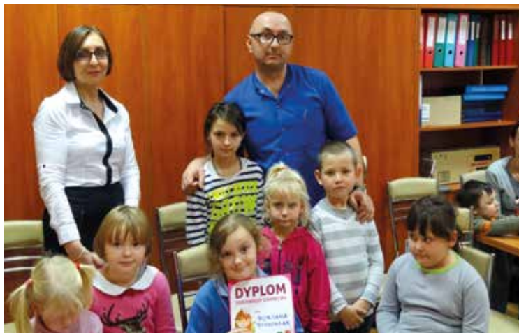
Obiecujemy, że zawsze będziemy myć zęby!