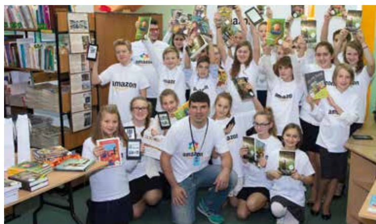
My lubimy czytać książki!