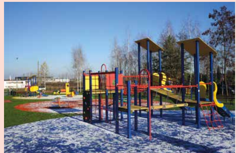
Plac zabaw w Bielanych Wrocławskich