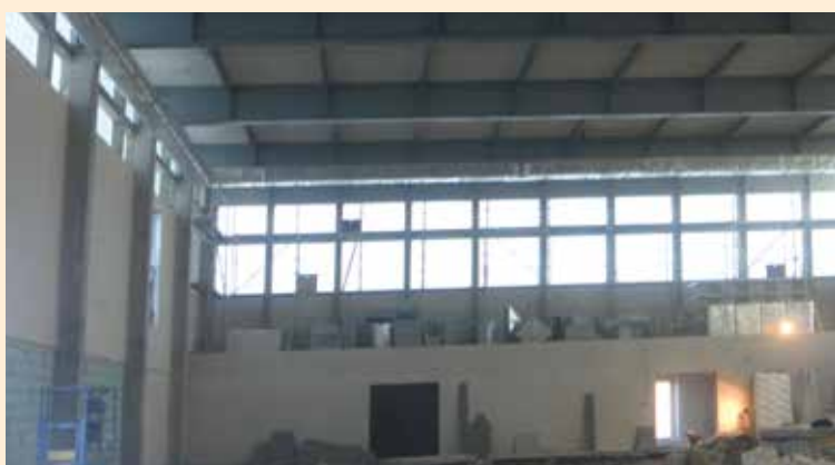
Trwają prace wykończeniowe wewnątrz budynku