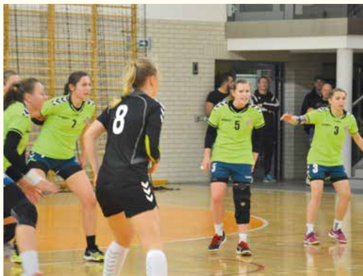
Obrona, obrona miłe Pani!