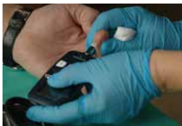
„Cukier pod kontrolą”

Sobota 28 listopada była dobrym momentem, by sprawdzić swój organizm i zadbać o zdrowie. Większość zainteresowanych rejestrowała się jeszcze przed akcją, ale nie brakowało także i osób, które zgłosiły się do przychodni w Kobierzycach i Ślęży spontanicznie. Każda z nich otrzymywała indywidualną kartę badań, którą w pierwszym gabinecie wypełniała pielęgniarka – wpisywała tu wyniki przeprowadzonych na miejscu badań poziomu cukru we krwi, ciśnienia tętniczego, obwodu brzucha i BMI oraz ewentualne wcześniejsze przebyte choroby. Następnie pacjent przechodził z kartą do drugiego gabinetu, aby zasięgnąć konsultacji lekarza podstawowej opieki zdrowotnej. Mógł również porozmawiać o profilaktyce antycukrzycowej, właściwej diecie i trybie życia czy postępowaniu już w przypadku wykrycia choroby. Jeśli wyniki sugerowały konieczność dalszego, bardziej specjalistycznego leczenia, pacjenci mieli możliwość od razu umówić się na wizytę lekarską do diabetologa czy dietetyka.