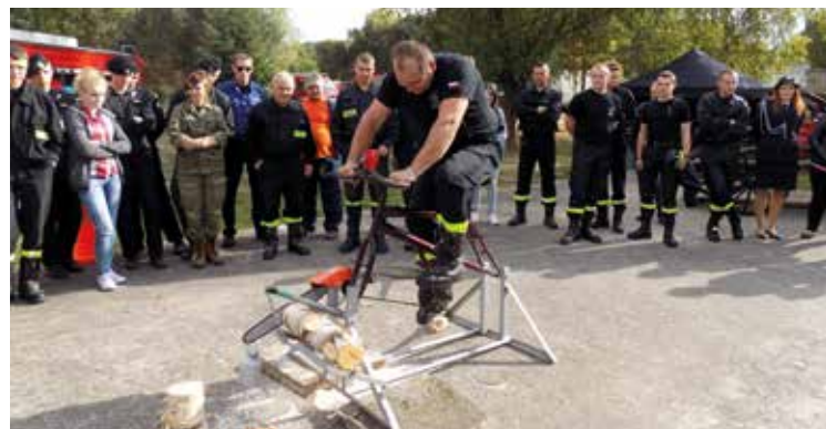
Ile jeszcze do mety?!