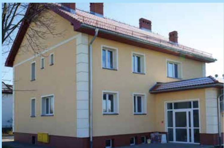
Ośrodek zdrowia w Tyńcu Małym

W Tyńcu Małym dobiegają prace budowlane związane z przebudową i rozbudową budynku przy ul. Zdrowej, w którym mieści się wiejski ośrodek zdrowia. Obiekt prezentuje się efektywnie, zyskał bardzo na funkcjonalności, powstały nowe powierzchnie użytkowe, które z pewnością podniosą standard opieki nad pacjentami, w tym osobami niepełnosprawnymi. Otoczenie obok budynku zostanie zagospodarowane, powiększy się powierzchnia parkingowa. W Kobierzycach rozpoczęły się prace budowlane związane z rozbudową istniejącego ośrodka zdrowia.