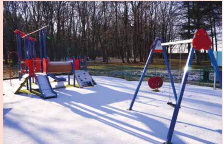
Plac zabaw w Pełczycach