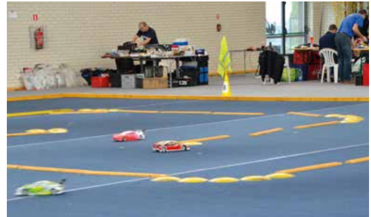
Prędkości niczym w Formule 1

skowej w Kobierzycach odbyły się Eliminacje Halowych Mistrzostw Polski PMMS RC (modeli samochodów). Wśród zawod-