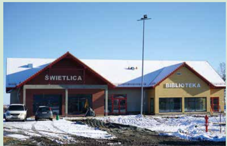
Świetlica wraz z biblioteką w Tyńcu nad Ślężą