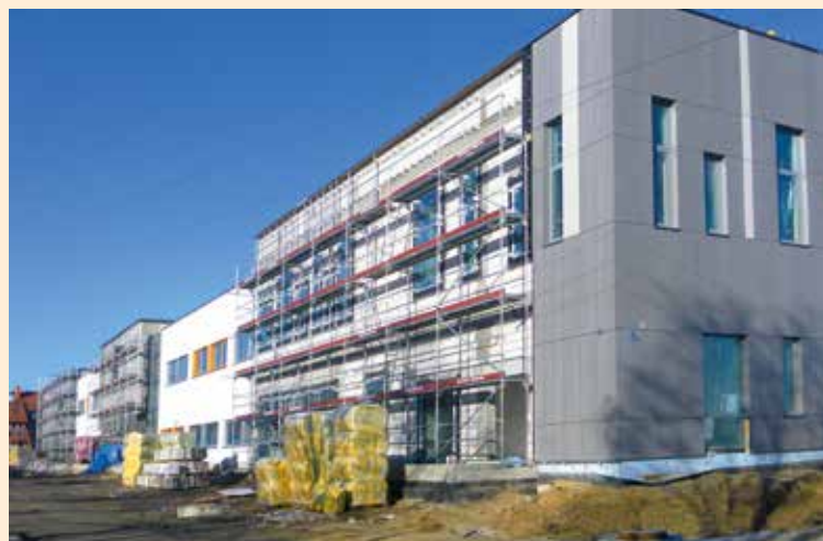
Trwa docieplenie ścian