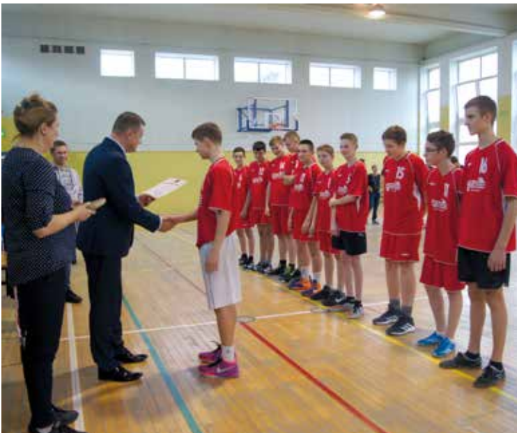
Nagrody wręczał Roman Potocki – Starosta Powiatu Wrocławskiego