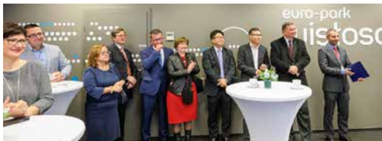
Goście w nowym biurze