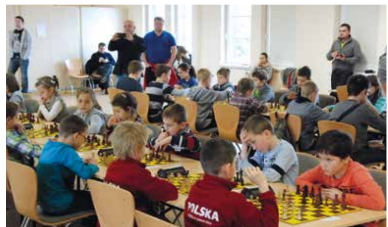
Szach ...i mat!