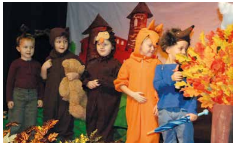
Mali artyści na scenie