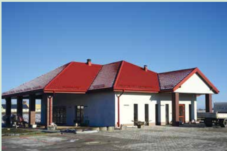
Świetlica z biblioteką w Jaszowicach