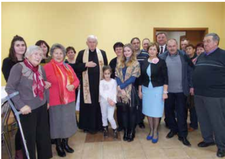
Pierwsze zdjęcie w nowej świetlicy