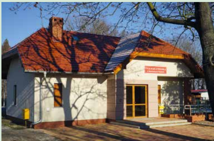
Świetlica w Raclawicach Wielkich