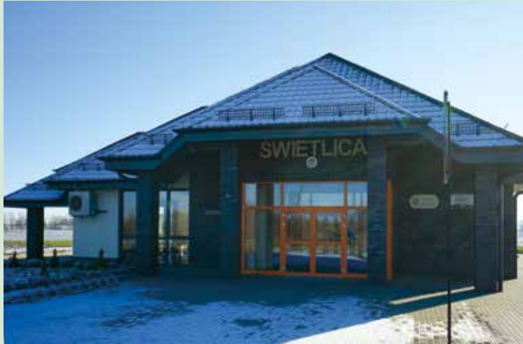
Świetlica w Cieszycach

W Gminie Kobierzyce od lat konsekwentnie realizowany jest program budowy świetlic wiejskich w poszczególnych miejscowościach. W tym roku oddano do użytku dwa obiekty: w Cieszycach i Raclawicach Wielkich (patrz str. 3). Na ukończeniu jest budowa świetlicy wraz z biblioteką w Jaszowicach. W połowie przyszłego roku powinna rozpocząć działalność świetlica wraz z biblioteką i zapleczem sportowym w miejscowości Tyniec nad Ślężą. W przyszłym roku planowane jest rozpoczęcie prac związanych z budową świetlic w Księginicach, Kuklicach i w Ślężu. W istniejących obiektach na bieżąco wykonywane są niezbędne prace remontowe.