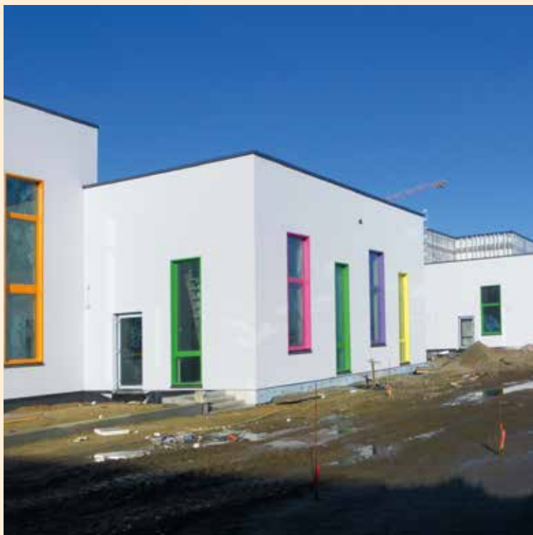
Fragment elewacji już gotowy

chennym i innymi pomieszczeniami. Kubatura budynku – to około 62 tys. m 3 , będą to 2 kondygnacje o łącznej powierzchni około 10 tys. m 2 , a koszt całego przedsięwzięcia sięgnie ok. 40 milionów złotych i jest w całości finansowany z budżetu Gminy Kobierzyce. Wykonawcą inwestycji jest firma Dorbud S.A. z Kielc. Wykonawca od początku zgodnie z przyjętym harmonogramem realizuje kolejne etapy budowy, obecnie prace zaawansowane są w około 60%, a szkoła rozpocznie działalność w dniu 1 września 2016 roku.