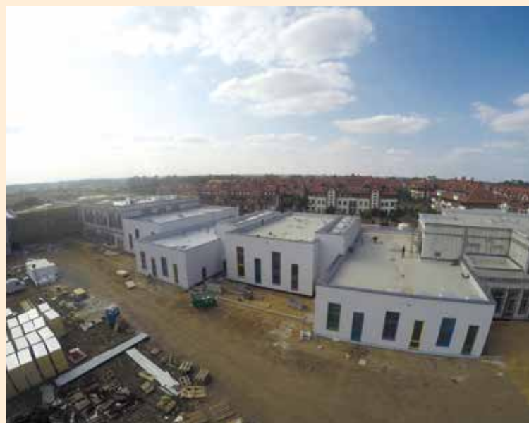
Szkoła w Wysokiej