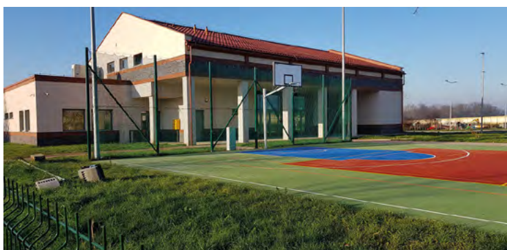
Świetlica w Ślęzie