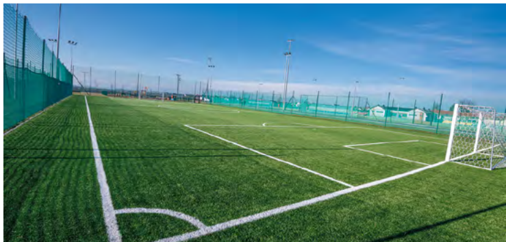
KOSiR - Orlik