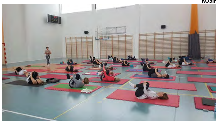
Dzień Kobiet z jogą