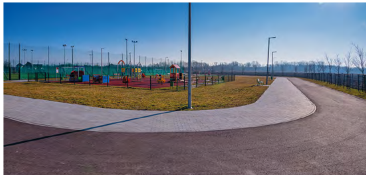
KOSiR - Rolkostrada