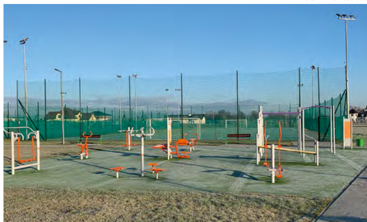
Ślezańsko-Biełański Obiekt Sportowo-Rekreacyjny

Działalność Kobierzyckiego Ośrodka Sportu i Rekreacji w 2020 roku rozpoczęła się bardzo intensywnie zgodnie z harmonogramem imprez i zajęć sportowych. Nowością był plebiscyt na: Najlepszego Sportowca, Młodzieżowego Sportowca, Trenera oraz Drużynę Roku w Gminie Kobierzyce. Mieszkańcy poprzez głosowanie wybrali osobistości sportowe mijającego roku. Laureatami okazali się: