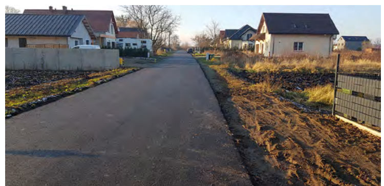
Nakładka asfaltowa w Kobierzycach