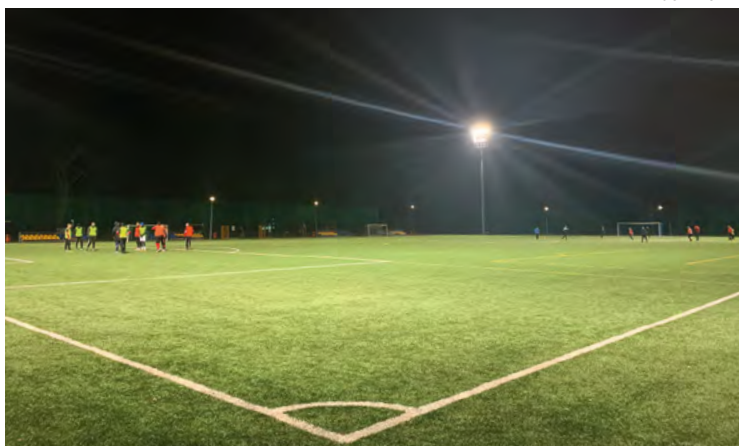
Boisko ze sztuczną murawą w Kobierzycach