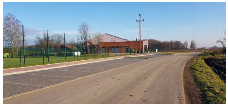
Świetlica w Żernikach Małych