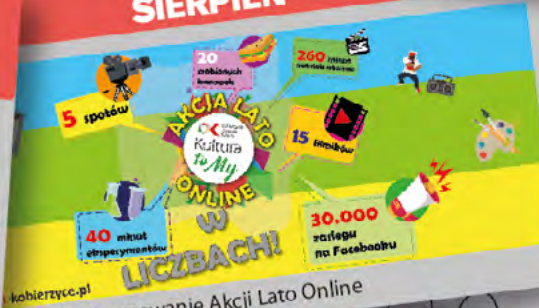
Podsumowanie Akcji Lato Online