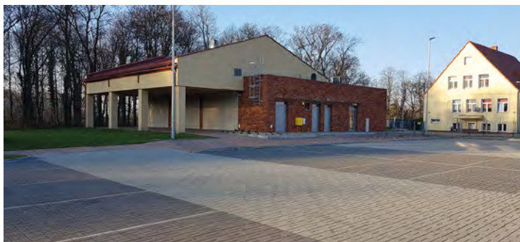
Świetlica w Krzyżowicach