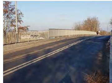
Przejazd nad autostradą

że w przyszłym roku również i te budynki będą służyć mieszkańcom zgodnie z przeznaczeniem. Ważną inwestycją jest budowa nowego budynku szkolnego w Bielanych Wrocławskich. Dotychczasowe tempo prac pozwala mieć nadzieję, że ta inwestycja zostanie oddana do użytku zgodnie z planem. Niedawno poprawiły się zapewne nastroje wśród kierowców, pieszych i rowerzystów, korzystających z przeprawy nad autostradą w miejscowości Śleza.