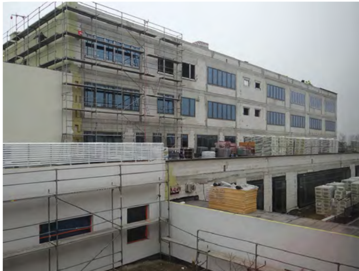
Szkola w Bielanych Wrocławskich

że w przyszłym roku również i te budynki będą służyć mieszkańcom zgodnie z przeznaczeniem. Ważną inwestycją jest budowa nowego budynku szkolnego w Bielanych Wrocławskich. Dotychczasowe tempo prac pozwala mieć nadzieję, że ta inwestycja zostanie oddana do użytku zgodnie z planem. Niedawno poprawiły się zapewne nastroje wśród kierowców, pieszych i rowerzystów, korzystających z przeprawy nad autostradą w miejscowości Śleza.