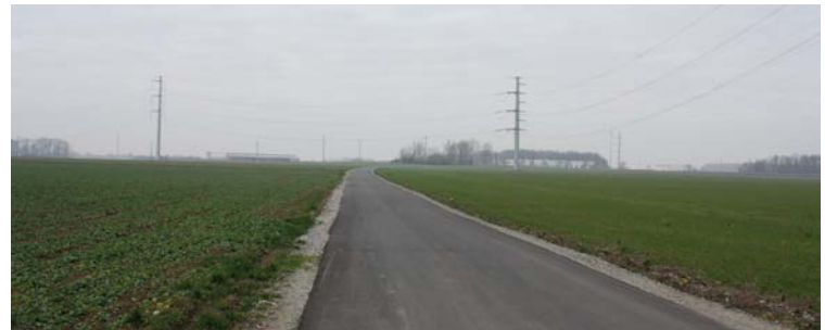
Droga transportu rolnego Żerniki Małe-obwodnica Tyńca Małego