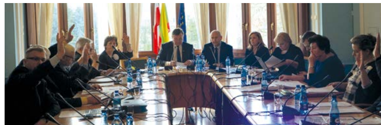
Głosowanie nad budżetem