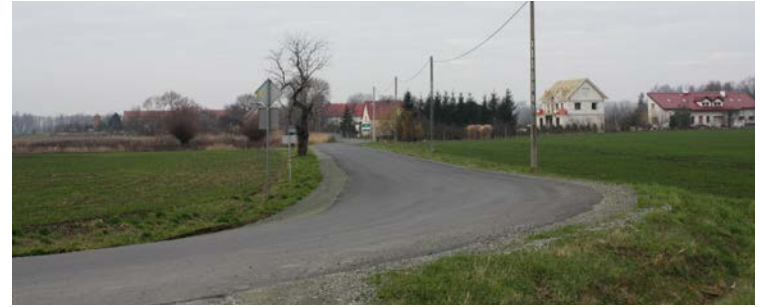
Droga do Nowin