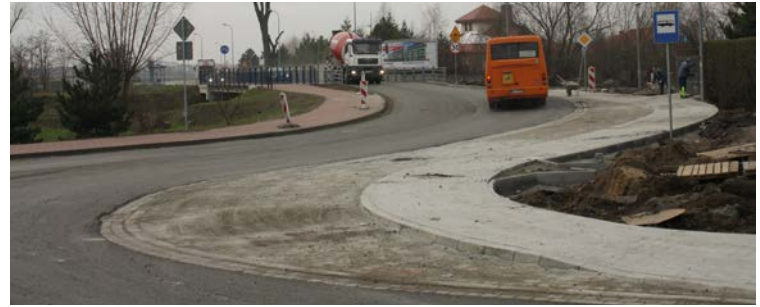
Droga powiatowa w Ślęzie