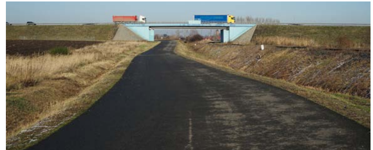
Droga transportu rolnego Chrzanów-Domasław