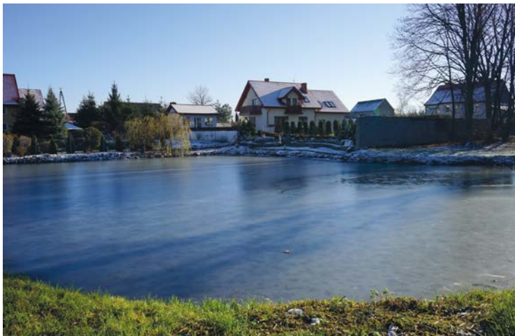
Staw w Pełczycach