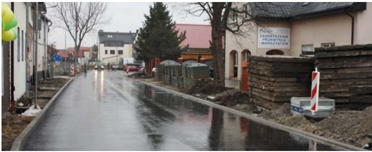
Ul. Borówkowa w Bielanach Wrocławskich