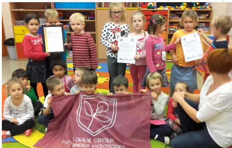
Oni mają dbać o naszą planetę

Ekologiczną nagrodą specjalną Dolnośląskiego Kuratora Oświaty. Nasza placówka za systematyczną pracę w kolejnych dwóch edycjach w ramach dolnośląskiej sieci szkół ZIEMIA DLA WSZYSTKICH otrzymała również Certyfikat Placówki Promującej Ekorozwój. 12 października w Krakowie odbył się trzynasty zjazd placówek oświatowych, które zostały wyróżnione prestiżowym,