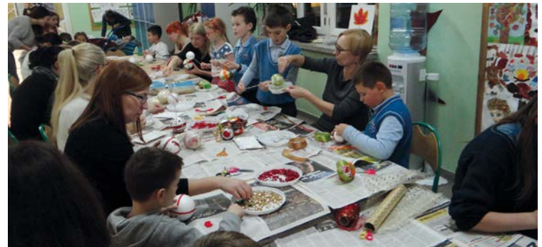
Mamy pomagały, ozdoby szybko powstawały!