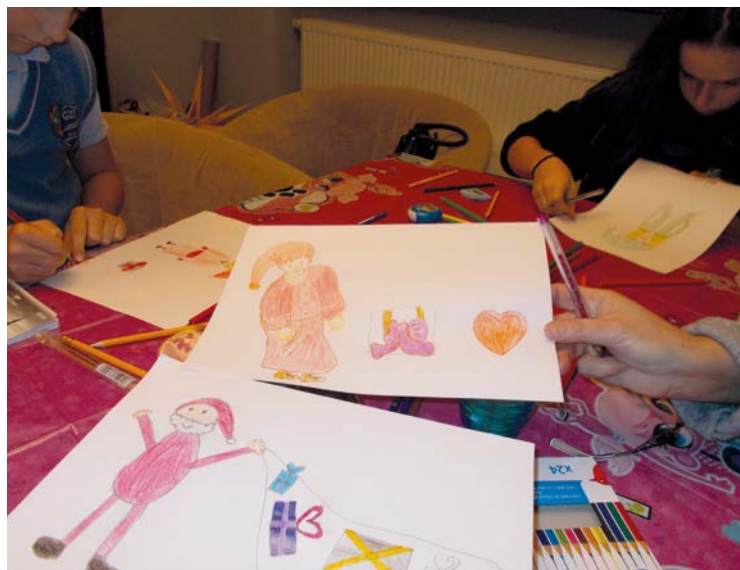
Zajęcia plastyczne w świetlicy profilaktycznej w Bielanych Wrocławskich

Prezes Stowarzyszenia „Bielany dla Ciebie”