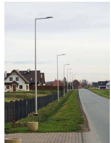
Oświetlenie Żerniki Małe