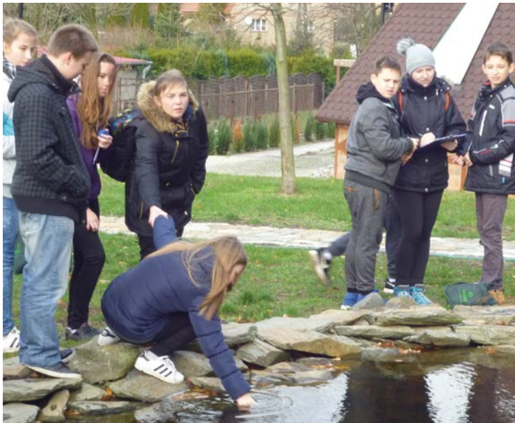
Czy ta woda nadaje się do picia?