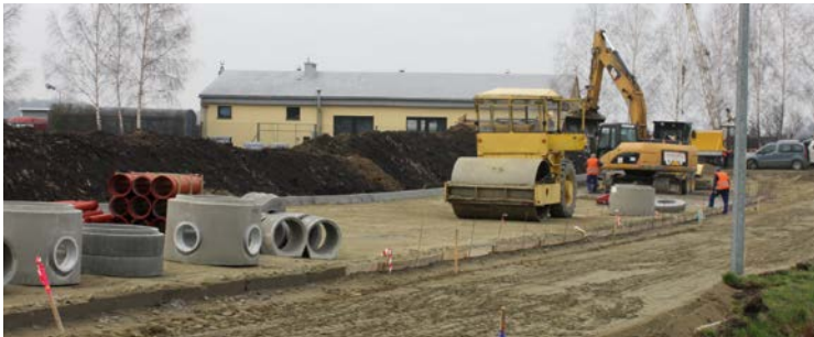
Ul. Spółdzielcza w Kobierzycach