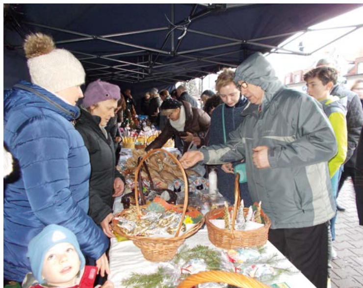
Chętnych do zakupu ozdób choinkowych nie brakowało