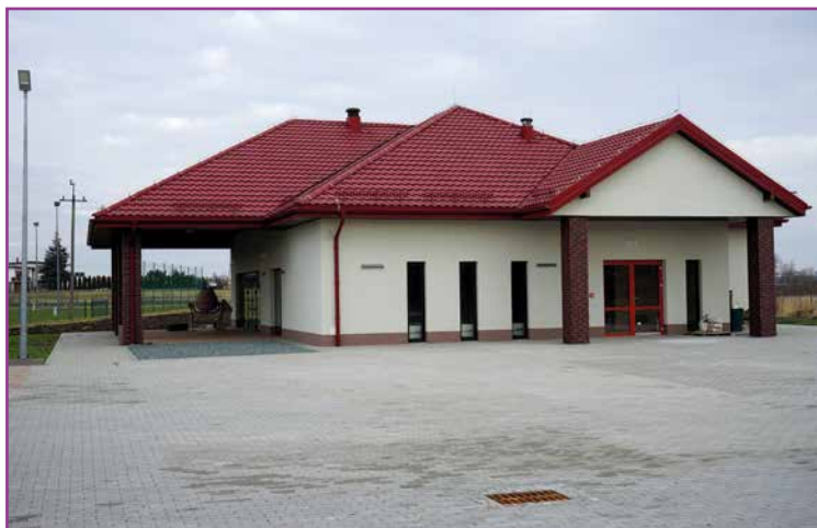
Świetlica w Jaszowicach