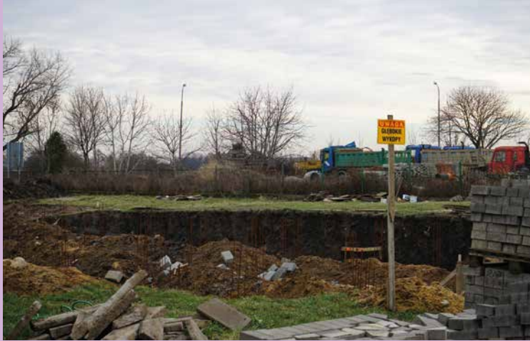
Rozbudowa Ośrodka Zdrowia w Kobierzycach