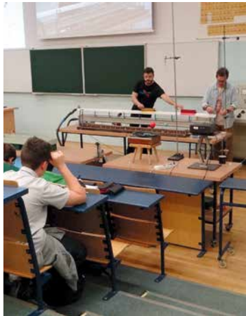
Zajęcia na Uniwersytecie są ciekawe

W I semestrze uczniowie Gimnazjum w Bielanych Wrocławskich uczestniczyli w cyklicznych wykładach na Wydziale Fizyki Doświadczalnej Uniwersytetu Wrocławskiego. Pierwsze zajęcia odbyły się już w listopadzie 2015 r., kiedy to klasy pierwsze wysłuchały wykładu na temat właściwości materii. Była tam możliwość obejrzenia wielu efektywnych i zaskakujących doświadczeń. Fizyka została przedstawiona jako interesująca i zabawna nauka o zjawiskach przyrodniczych. Dzięki temu uczniowie mogli poznać „świat nauk ścisłych” i przełamać stereotyp „trudnej fizyki”. Pokazy okazały się atrakcyjną lekcją, która poszerzyła ich wiadomości i wzbogaciła wiedzę uczniów o wykorzystaniu odkryć naukowych w życiu codziennym. Natomiast w grudniu 2015 r. klasy drugie uczestniczyły w wykładzie o zasadach dynamiki Newtona, oglądając wiele efektywnych i zaskakujących doświadczeń pod nazwą „Ruch pod wpływem siły”. Uczelnia dała możliwość udziału uczniom w jeszcze jednym wykładzie, w którym uczestniczyły klasy trzecie. Miał on miejsce 12 stycznia 2016 r. Tym razem były to doświadczenia ze świata elektryczności, aby poznać i docenić