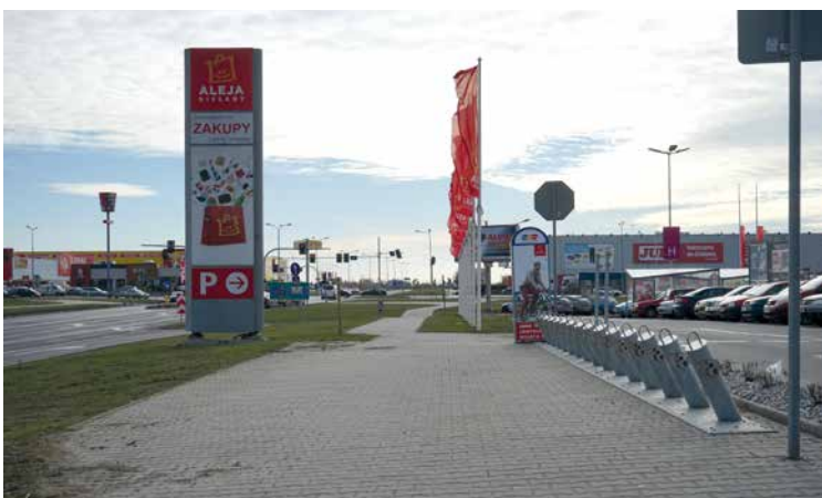
Stacja roweru miejskiego Wrocławia przy Alei Bielany