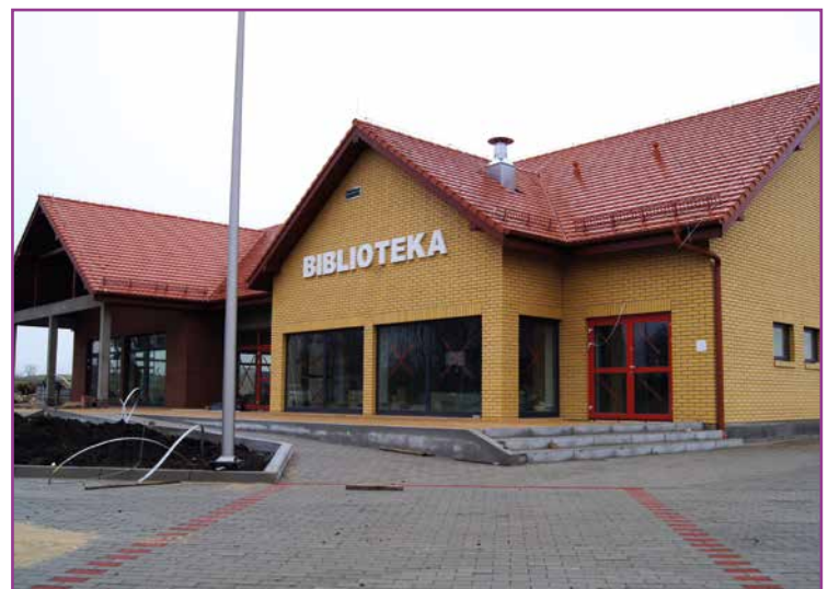
Świetlica wraz z biblioteką w Tyńcu nad Słężą