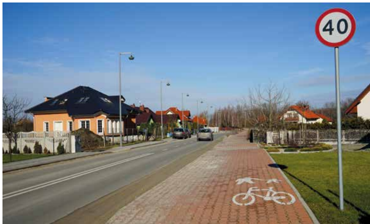
Ścieżka rowerowa na przy ul. Sportowej w Kobierzycach