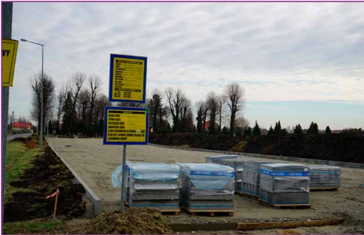
Parking przy cmentarzu w Kobierzycach w trakcie budowy