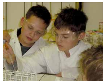
W trakcie ćwiczeń laboratoryjnych