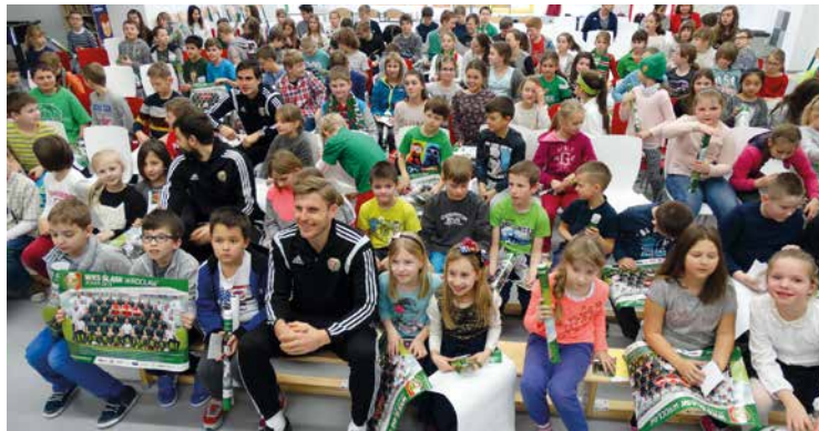
Piłkarze Śląska w towarzystwie fanów z Tyńca Małego