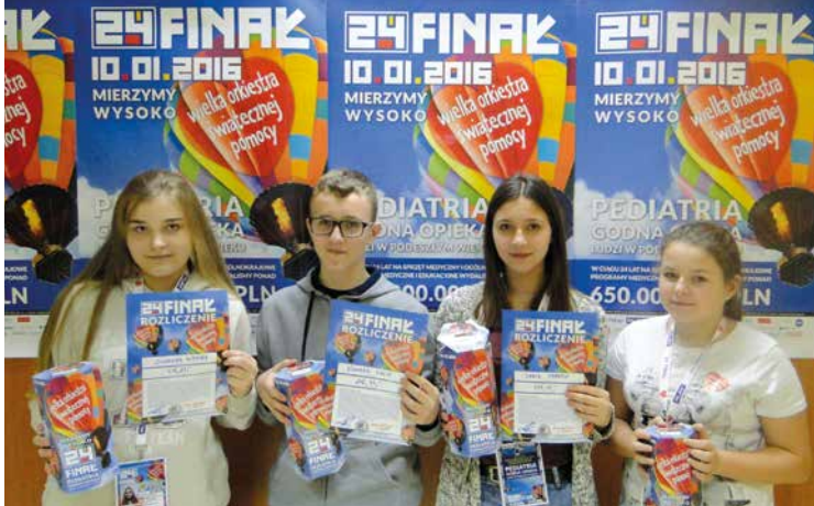
Wolontariusze WOŚP z Pustkowa Żurawskiego