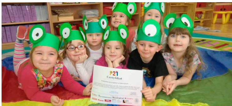
Dzieci chętnie uczestniczą w projektach edukacyjnych