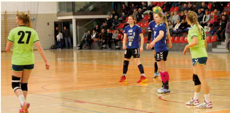
Fragment meczu ze Startem Elbląg