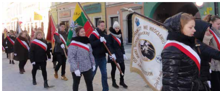
Młodzież z Kobierzyc uczestniczyła w uroczystym przemaszeru

22 stycznia 2016 r. Poczest Sztandarowy Gimnazjum im. Zesłańców Sybiru w Kobierzycach uczestniczył w uroczystościach z okazji 153. rocznicy wybuchu Powstania Styczniowego. W piątek o godz. 12:00 odbyła się Msza Św. w Kościele Garnizonowym we Wrocławiu, w asyście Kompanii Honorowej Wojska Polskiego i Orkiestry reprezentacyjnej Wojsk Łądownych. O godz. 13:00 przemaszerowano do gmachu Uniwersytetu Wrocławskiego