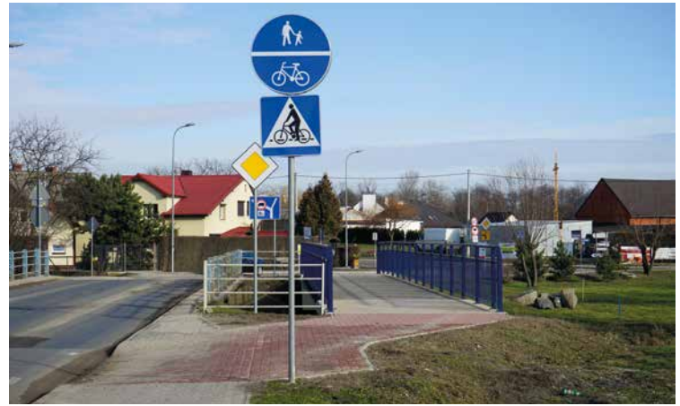
Kładka dla pieszych i rowerzystów w Ślęzie

w pierwszej kolejności mają połączyć tzw. Węzeł Bielański z Kobierzycami i będą przebiegały w miejscach, gdzie będzie możliwe i zasadne ich wytyczenie i poprowadzenie, po wydzielonych drogach rowerowych lub ciągach pieszo-rowerowych. W pozostałych przypadkach zostaną wyznaczone na lokalnych drogach o niewielkim natężeniu ruchu. W obu przypadkach będziemy chcieli zadbać o to, by rowerzyści poruszali się po nawierzchni bitumicznej, zwiększającej bezpieczeństwo i komfort jazdy. Z uwagi na duży zakres planowanej inwestycji, zadanie zostało podzielone na etapy. Spowodowane jest to między innymi koniecznością uzyskania licznych uzgodnień, wymaganych przy tego typu inwestycjach (własność gruntów, przebieg infrastruktury, ewentualne kolizje z sieciami energetycznymi, czy gazowymi itp.). Koncepcja budowy tras rowerowych zakłada zapewnienie dojazdu do centrów handlowych w Bielanych Wrocławskich (w których spora ilość mieszkańców z naszej gminy jest zatrudniona), ale także chcemy umożliwić przyszłym użytkownikom tras rowerowych poznanie i skorzystanie z atrakcji turystycznych tego obszaru. Aby to zrealizować, budowę trasy rozpoczniemy od miejsca, w którym istnieje już stacja wrocławskiego roweru miejskiego przy Alei Bielany. Umożliwi to mieszkańcom Wrocławia kontynuowanie jazdy dalej, aż do Kobierzyc. Liczymy na to, że skorzystają na tym również mieszkańcy