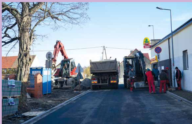
ul. Borówkowa w Bielana Wrocławskich