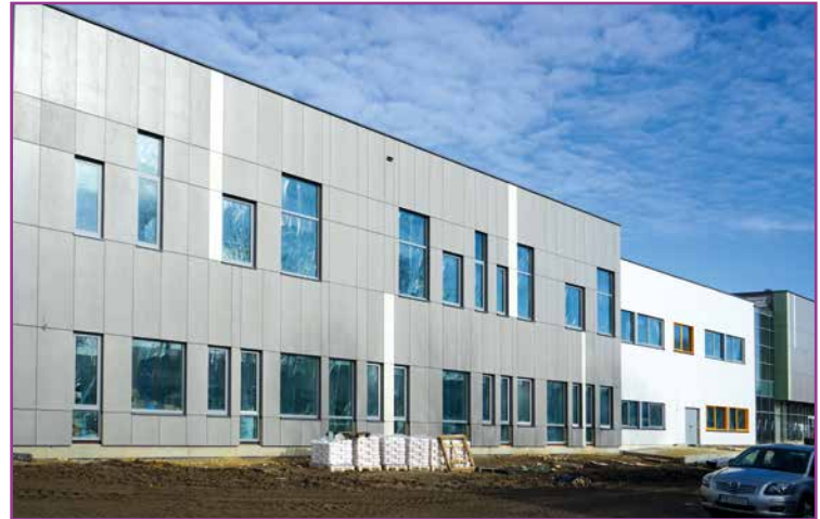
Budowa szkoły w Wysokiej