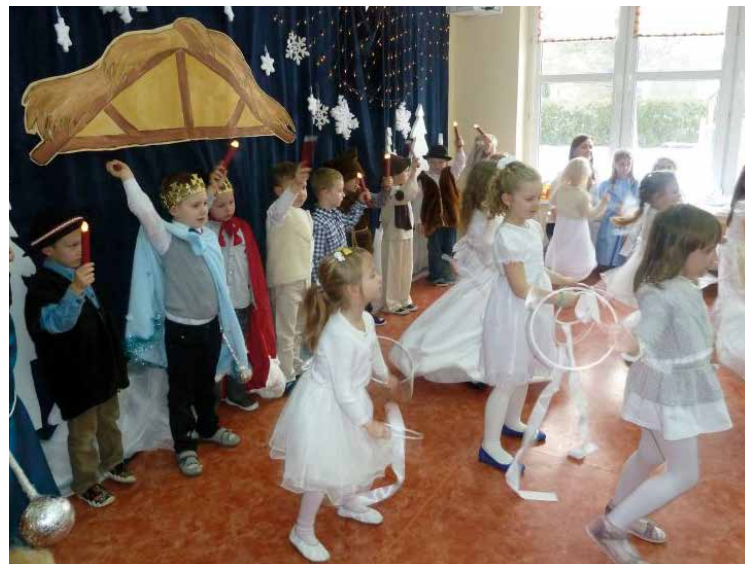
Mali artyści w trakcie występu