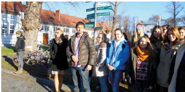
I turystycznie, i naukowo

Drezną i Lipską. Nasi uczniowie podziwiali zabytki i poznawali historię Saksonii; trafili przy okazji na tradycyjne Targi Bożonarodzeniowe. Zwiedzili też jedno z najważniejszych muzeów świata – Galerię Zwinger.