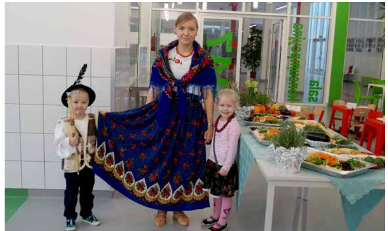
Góralskie jadlo smakuje wyborne, hej!