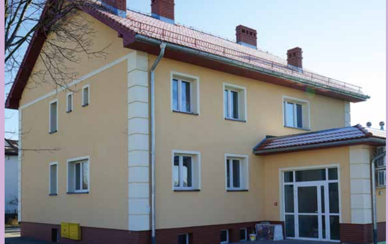
Ośrodek Zdrowia w Tyńcu Małym