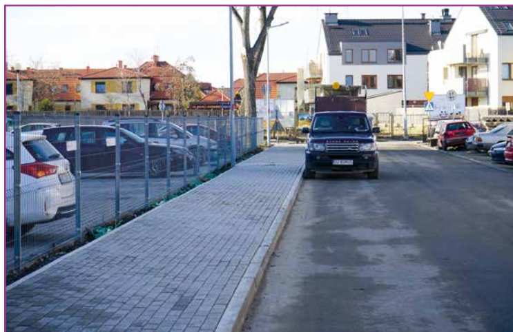
ul. Borówkowa w Bielana Wrocławskich