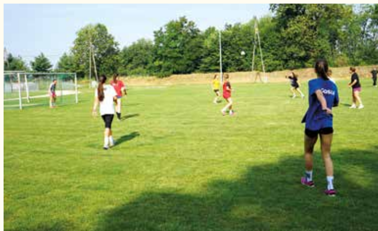
Na początek grano w piłkę... nożną!

2004–2005 kobierzycyckie młodziczki i wywalczył z nimi 4 miejsce w Mistrzostwach Polski. Na co dzień jest kierownikiem Katedry Zespołowych Gier Sportowych AWF-u Wrocław. W zespole są 2 nowe zawodniczki i jedna wróciła do macierzystego klubu po trzech latach pobytu w Szkole Mistrzostwa Sportowego Związku Piłki Ręcznej w Polsce w Gliwicach i Płocku. Są to: Elżbieta We-