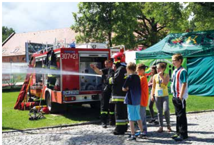
Ja też kiedyś będę strażakiem...