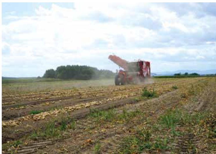
Zbiór cebuli pod Budziszowem