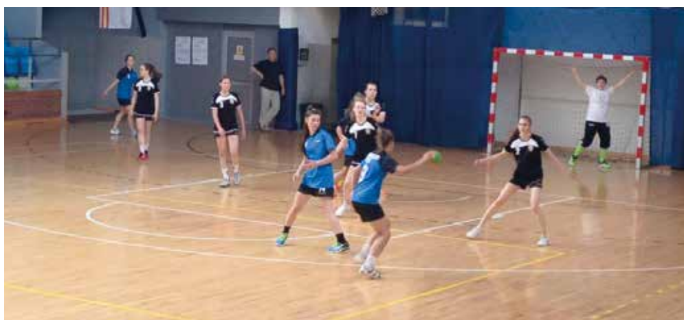
W Lublinie walczone o medale