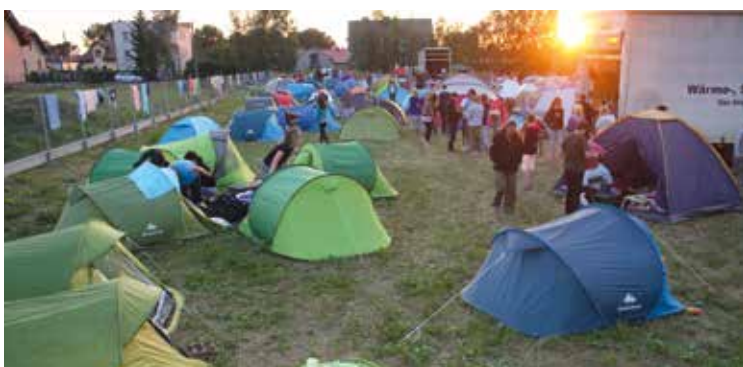
Tymczasowe pole namiotowe w Tyńcu Małym