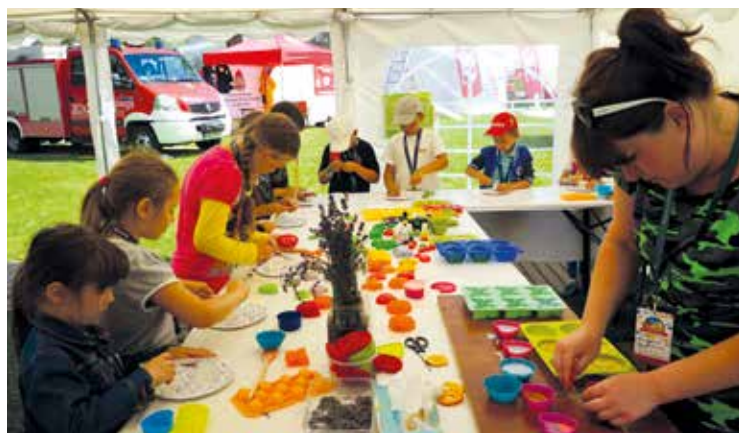
Zajęcia pobudzały wyobraźnię małych twórców