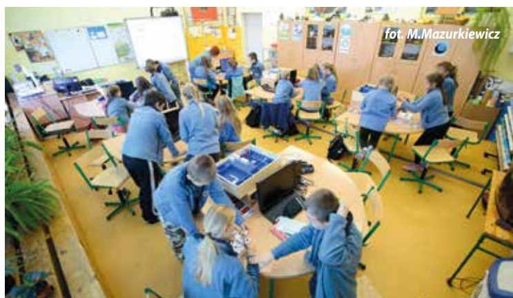
Gabinet przyrodniczy SP w Kobierzycach

Ze względu na zapewnienie przez ministra właściwego do spraw oświaty i wychowania bezpłatnych podręczników dla ucznia klasy I, II, IV szkoły podstawowej oraz klasy I gimnazjum, uczniowie klasy I, II, IV szkoły podstawowej oraz klasy I gimnazjum nie są odbiorcami pomocy przewidzianej w ramach rządowego programu pomocy uczniom w 2015 r. „Wyprawka szkolna”. Pomoc udzielana jest na wniosek rodziców ucznia (prawnych opiekunów, rodziców zastępczych, osób prowadzących rodzinny dom dziecka), pełnoletnie-