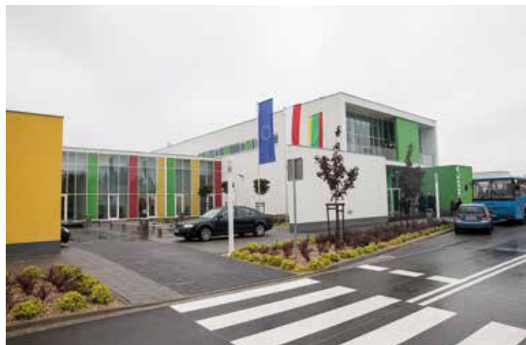
Zespół Szkolno-Przedszkolny w Tyńcu Małym czeka na uczniów