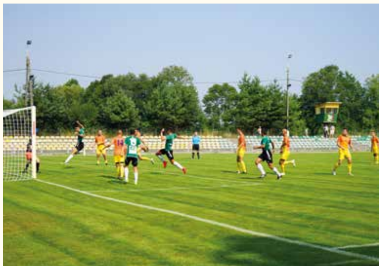
... w meczu...