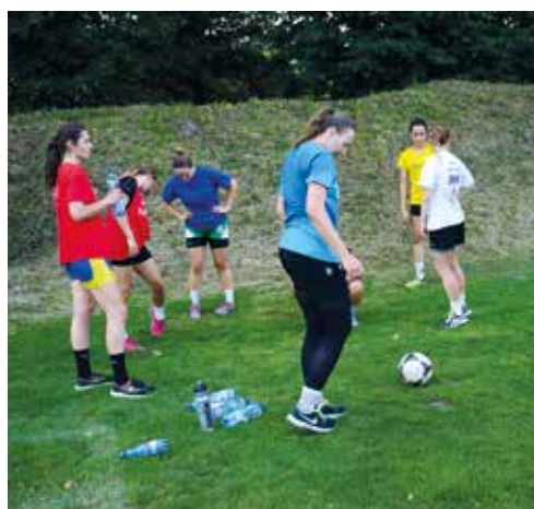
Najzdolniejsze gimnazjalistki trenują z seniorkami KPR