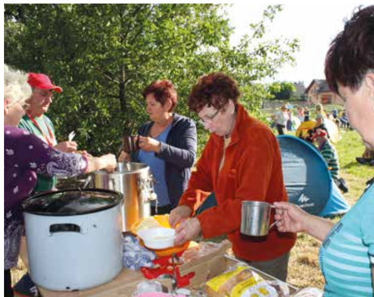
Gorący posiłek dla każdego