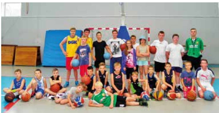
Młodzi koszykarze po treningu

uczestnicy korzystali z otwartego basenu w Lewinie Kłodzkim, a w razie niepogody z Aquaparku w Kudowie Zdrój. Nie zapomniano o innych atrakcjach jak strzelanie z łuku, poszukiwanie skarbów wykrywaczem metalu oraz o integracji uczestni-