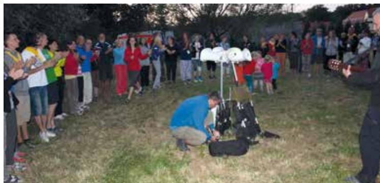
Spotkanie przy ognisku