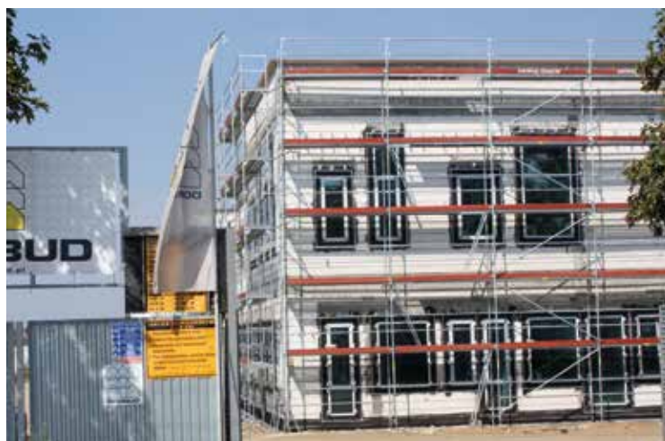
Budowa szkoły w Wysokiej

na drożdżach w miejscowości Wysoka rośnie nowoczesny obiekt oświatowy, który 1 września 2016 roku powinien otworzyć swoje podwoje. Patrząc na tempo prac budowlanych, jestem przekonany, że tak się stanie. W pozostałych placówkach,