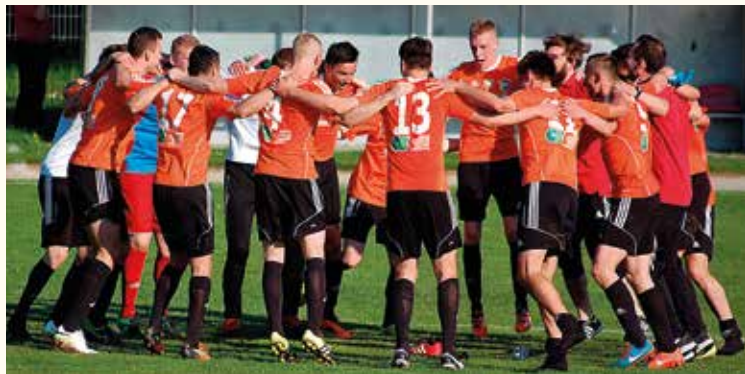
Zwartoligowcy z Kobierzyc często mieli powody do radości

Po 6 zwycięstwach i porażkach oraz 1 remis (19 pkt.) ma piątą w tabeli Galakticos Solna. Gorzej wiedzie się WKS-owi Wierzbice oraz Orłowi Pustków Wilczkowski, które w trzynastu kolejkach zgromadziły odpowiednio 14 i 9 punktów i wygląda na to, że będą walczyć o utrzymanie w klasie A.