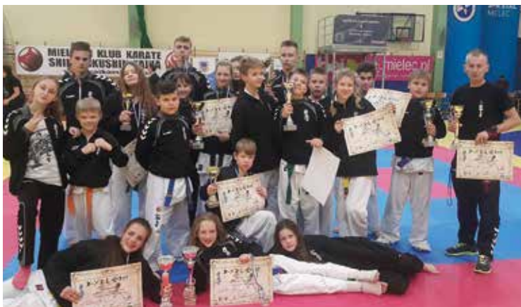
Karatecy z Kobierzyc zawojowali Mielec