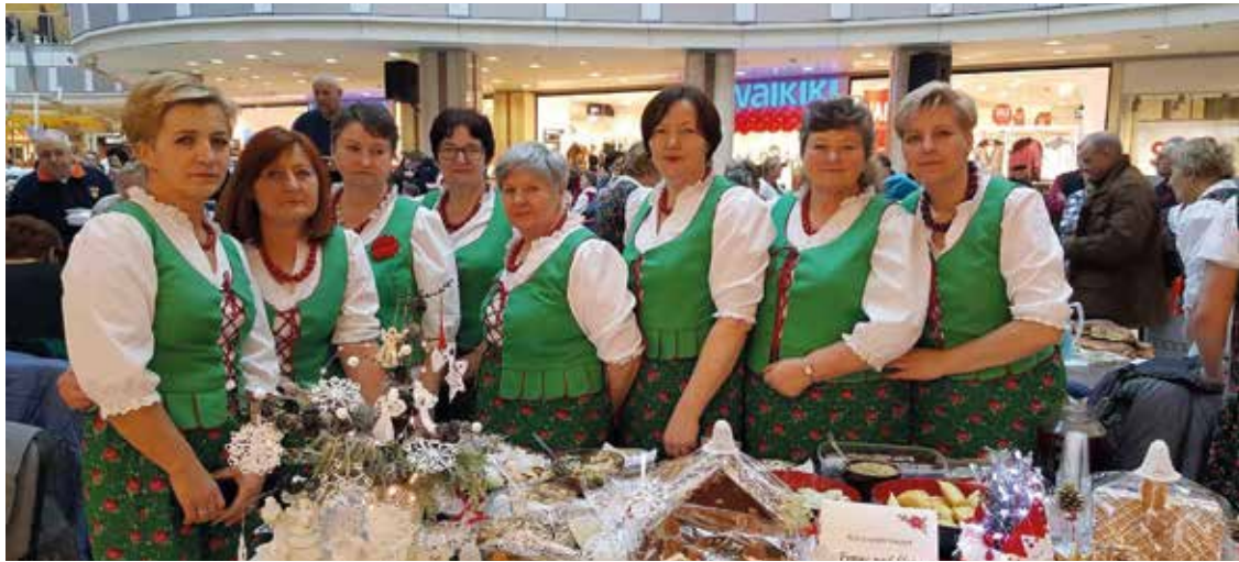
Panie z Koła Gospodyń Wiejskich w Tyńcu nad Słężą na wystawie stołów wigilijnych w Pasażu Grunwaldzkim

Przygotowanie: Ciasto rozwałkować włożyć do formy lub tortownicy ułożyć na niej/nim farsz. Piec ok. 1 godz. w temperaturze 160°C.