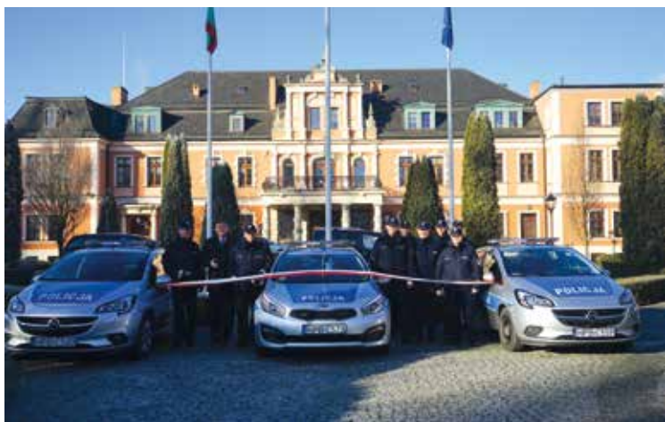
Nowe samochody gotowe do akcji