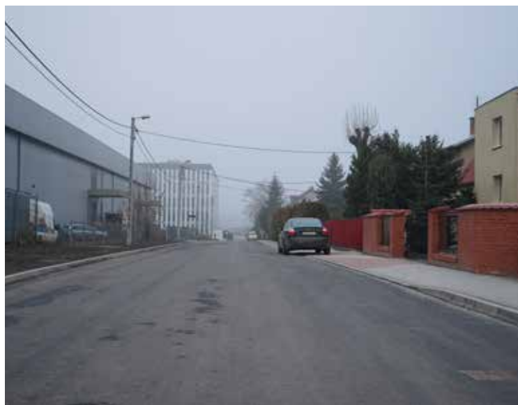
Ul. Polna w Bielanych Wrocławskich