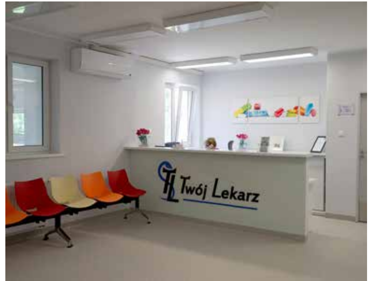
... i rejestracja