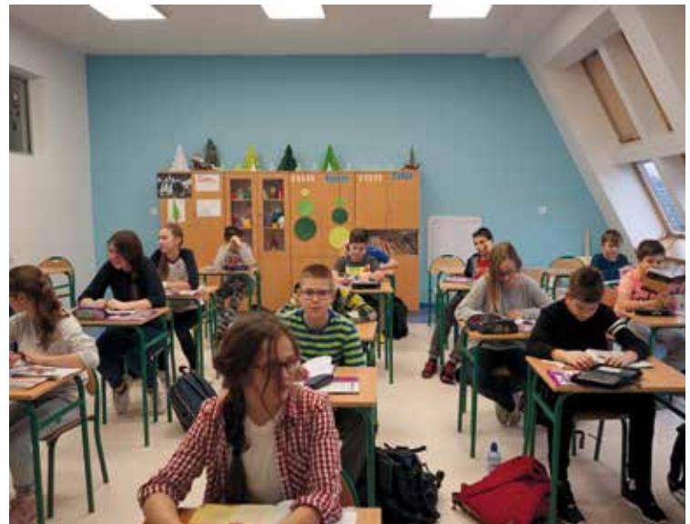
...i zajęcia w odremontowanej klasie