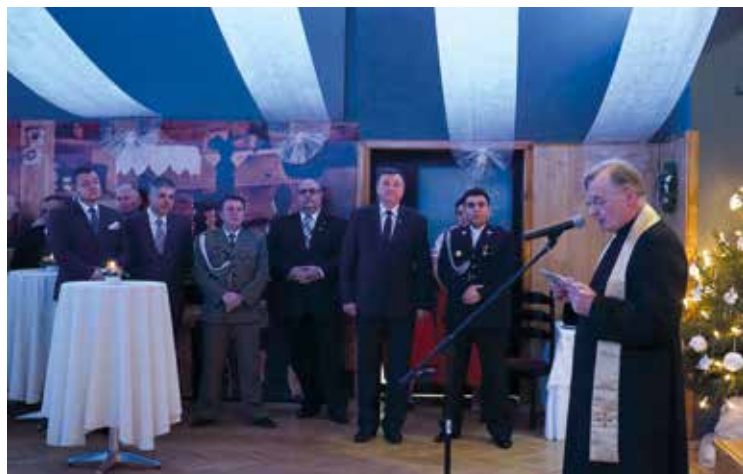
Spotkanie opłatkowe odbyło się w świątecznej atmosferze