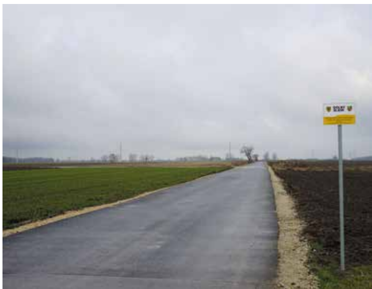
Droga transportu rolnego Chrzanów-Domasław