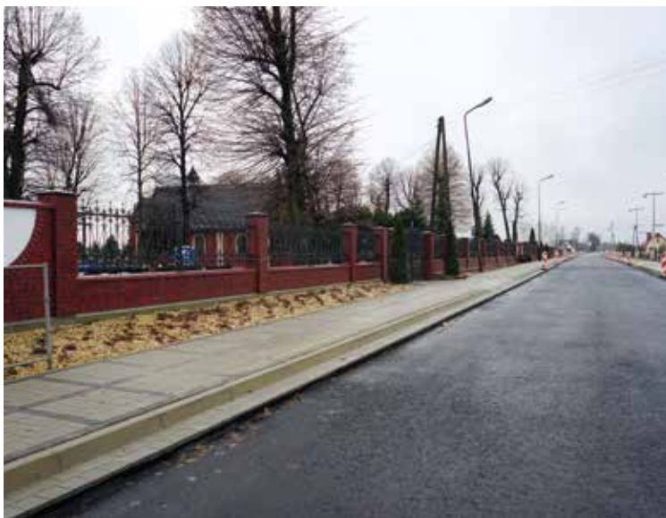
Droga przy cmentarzu komunalnym w Kobierzycach

Połączono miejscowości Chrzanów i Domasław. Uzyskano w ten sposób alternatywne połączenie dla drogi krajowej nr 8, (gdyby nastąpiły utrudnienia w ruchu po tej drodze). Jest to również ważny element w strategii budowy dróg rowerowych w Gminie Kobierzyce.