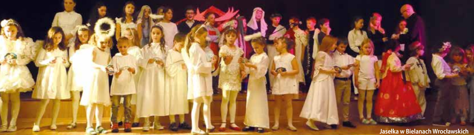
Jasełka w Bielanych Wrocławskich

Niech magiczna moc wigilijnego wieczoru przyniesie spokój i radość. Niech każda chwila Świąt Bożego Narodzenia żyje własnym pięknem. A Nowy Rok obdaruje pomysłowością i szczęściem. Najpiękniejszych Świąt Bożego Narodzenia spędzonych w rodzinnym gronie życzą