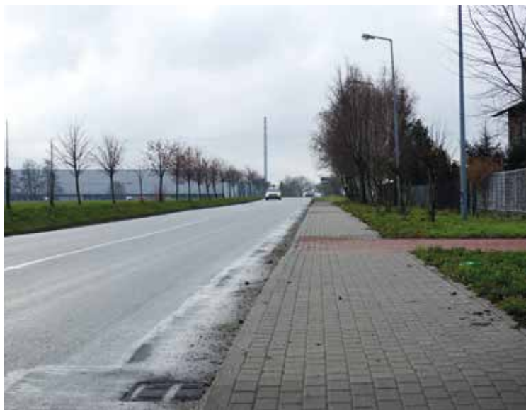
Ul. Żernicka w Tyńcu Małym