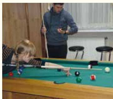
Bilardziści uderzali celnie!