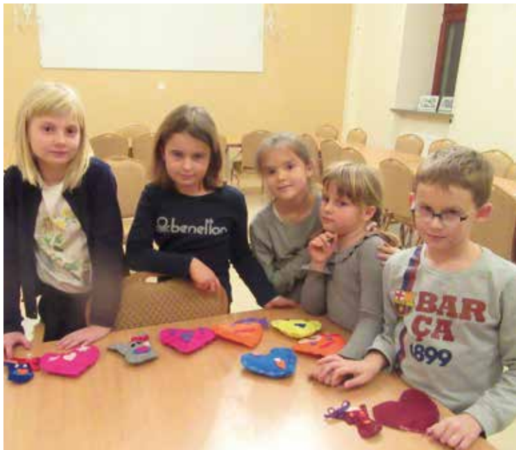
Zajęcia plastyczne w świetlicy Stowarzyszenia „Bielany Dla Ciebie”

W kręgu zainteresowań Stowarzyszenia byli również seniorzy. Zaczęło się od organizacji spotkań wspominkowych, był Dzień Kobiet, potem wspólny wypad rowerowy tych czujących się na siłach, warsztaty szydełkowania. Piknik rodzinny