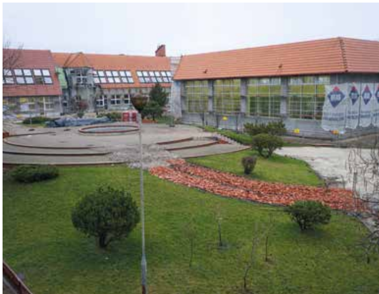
Szkoła w Kobierzycach – remont elewacji...