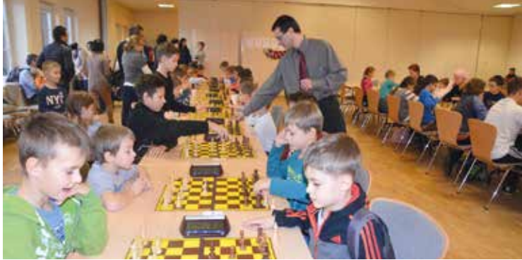
Mali szachiści w skupieniu rozgrywali swoje partie