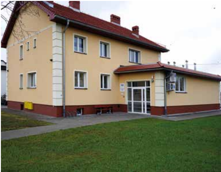
Ośrodek zdrowia w Tyńcu Małym – widok ogólny ...