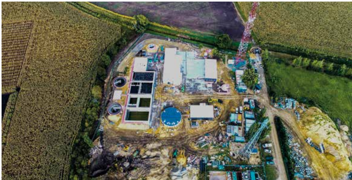
Budowa oczyszczalni ścieków w Kobierzycach

du – na łamach naszego biuletynu nie wystarczyłoby na to miejsca. Z tego też względu chciałbym poruszyć i wyróżnić tylko pewne grupy tematyczne, związane z różnymi aspektami życia. Mogłbym oczywiście przedstawić długą listę inwestycji, które w tym czasie zostały zrealizowane, bądź rozpoczęte, ale uważam, że byłoby to zbyt duże uproszczenie, dlatego też niech przemówią liczby. W latach 2014–2018 ja i moi współpracownicy kładliśmy duży nacisk na pozyskanie środków zewnętrznych przeznaczonych na działania inwestycyjne, które w znaczącym stopniu wspomogły środki własne, a dzięki takim działaniom udało się zrealizować o wiele więcej inwestycji i to w znacznie krótszym czasie, niż pierwotnie zakładano.