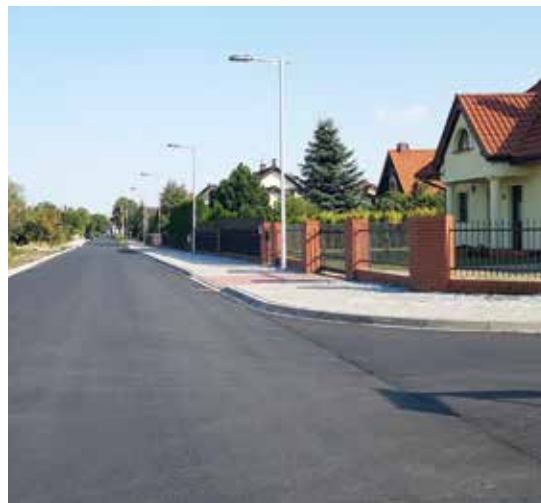
Bielany Wrocławskie, ul. Malinowa