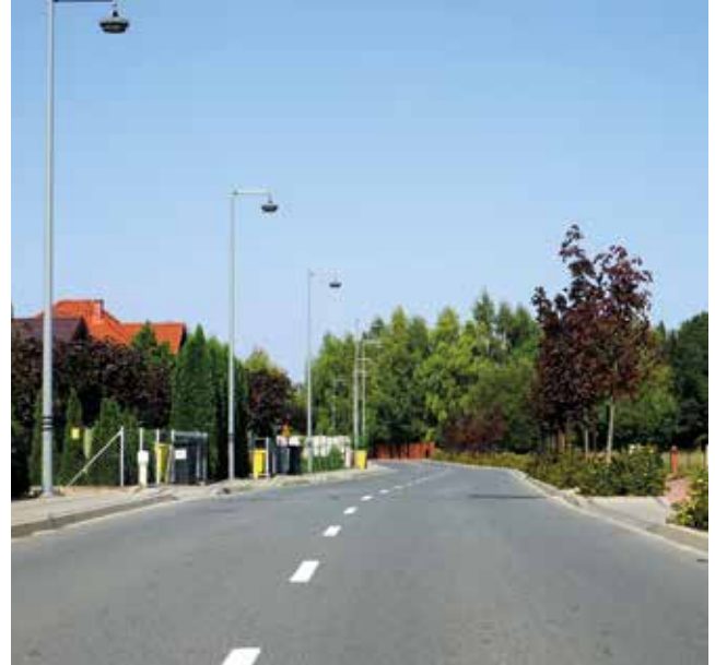
Kobierzyce, ul. Sportowa