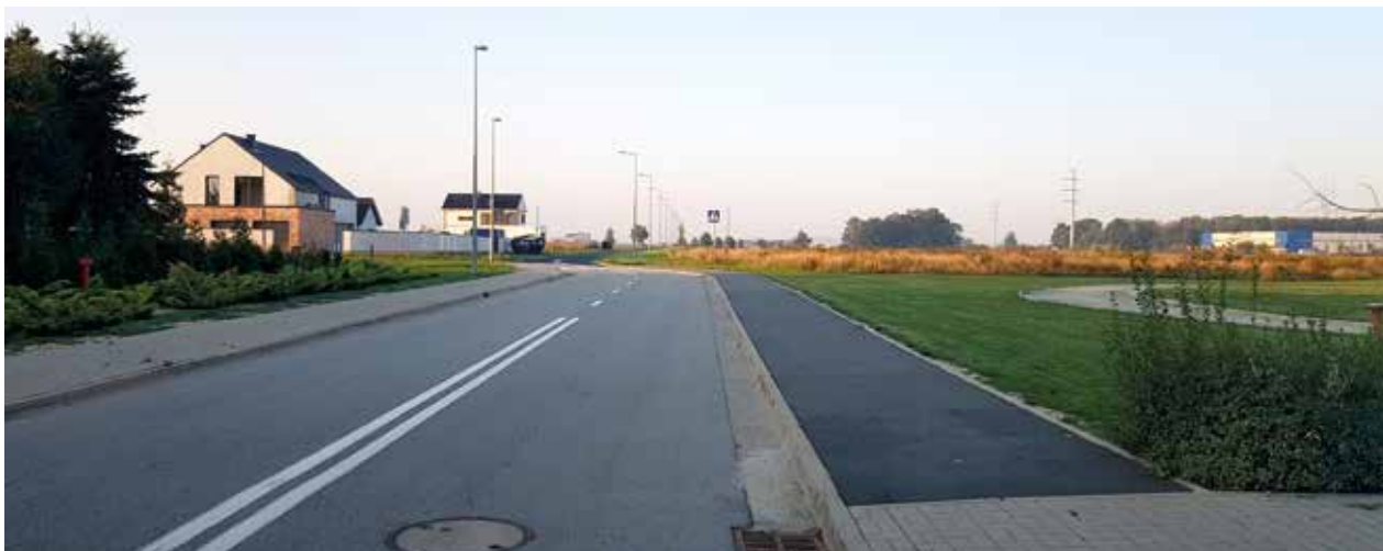
Tyniec Mały, ul. Szkolna

W tej miejscowości zostały przebudowane ulice: Szkolna, Żernicka, Akacja, Sosnowa.