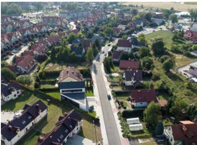
Bielany Wrocławskie, ul. Liliowa

Dokonano przebudowy ulic: Niebieska, Liliowa, Borówkowa, Tęczowa, Polna, Irysowa, Malinowa.