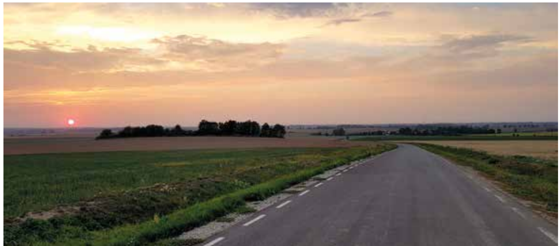
Droga Pustków Wilczkowski–Damianowice

Takie drogi wybudowano między innymi w miejscowościach: Magnice ul. Kwiatowa, Kobierzyce ul. Kolejowa, Księginice ul. Słoneczna, Chrzanów–Domasław, Wysoka ul. Bratnia, Kobierzyce ul. Tulipanowa, Dobkowice ul. Akacja, Szczepankowice ul. Spacerowa, Domasław ul. Akacja, Krzyżowice ul. Klonowa, Jaszowice ul. Kwiatowa, Pustków Wilczkowski ul. Ogrodowa, Domasław ul. Żernicka oraz w miejscowościach: Kuklice, Małuszów, Żerniki Małe, Księginice, Cieszyce, Szczepankowice, Budziszów, Krzyżowice, Nowiny, Magnice, Chrzanów, Rolantowice, Tyniec nad Ślężą, Księginice, Dobkowice, Cieszyce.