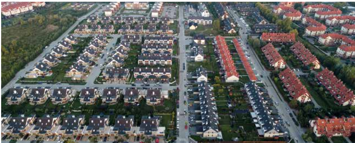
Wysoka, ul. Jasna

Przebudowano następujące ulice: Bratnia, Jasna, Łagodna.