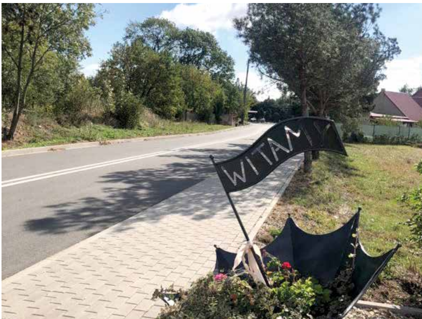
Droga wraz z chodnikiem z Budziszowa