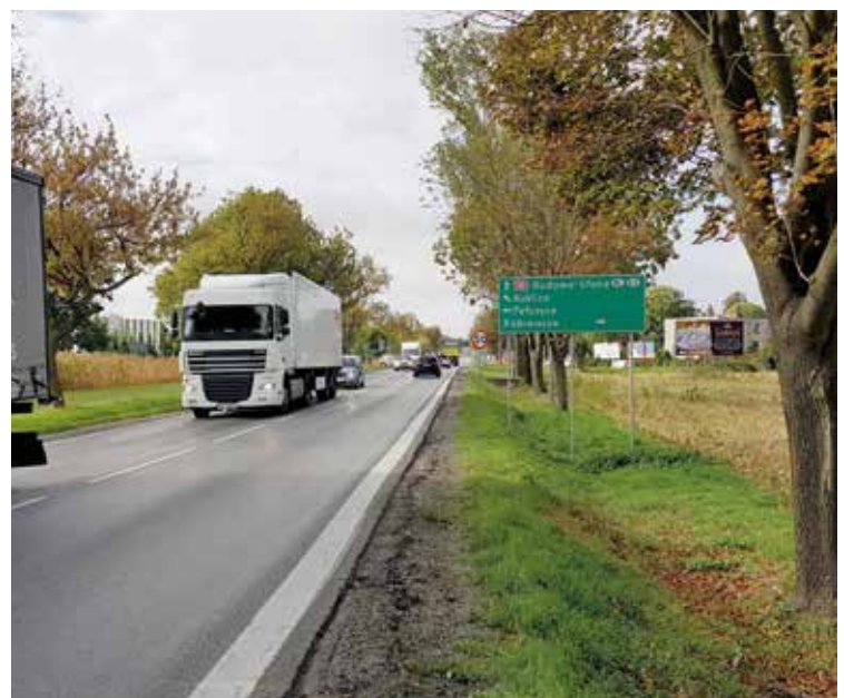
Droga krajowa nr 8

– Z pojęciem „infrastruktura” wiąże się w sposób jednoznaczny sprawa budowy i remontów dróg wraz z chodnikami i oświetleniem. Co wydarzyło się w tym