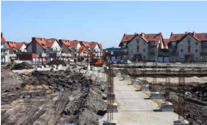
„Arkalandia” w Bielanych Wrocławskich

- Wjeżdżając do Kobierzyc nie sposób nie zauważyć okazałego budynku hali sportowo - widowiskowej, która pięknieje niemal