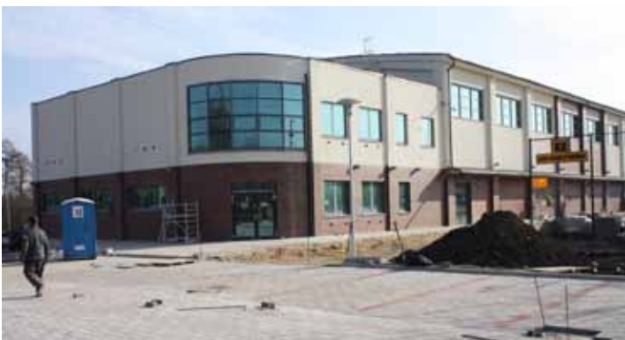
Hala widowiskowo - sportowa w Kobierzycach

- Znosi się na to, że już wkrótce w wielu miejscowościach naszej Gminy mieszkańcy będą mogli się spotykać w nowych świetlicach. Jak przebiega proces dokończenia tych inwestycji ?