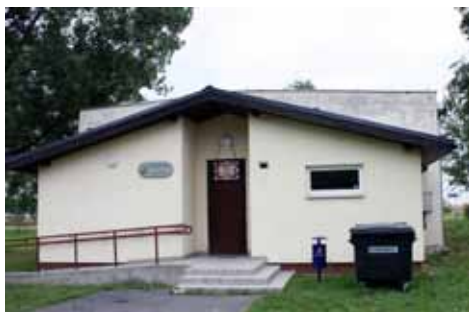
Świetlica w Dobkowicach

Operacja pn.: „Przebudowa świetlicy wiejskiej w Dobkowicach oraz wyposażenie świetlic w miejscowościach: Magnice i Szczepankowice” współfinansowana z Europejskiego Funduszu Rolnego na rzecz Rozwoju Obszarów Wiejskich w ramach Programu Rozwoju Obszarów Wiejskich na lata 2007-2013