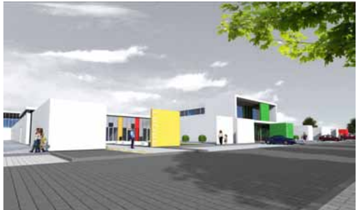
Wstępna koncepcja zespołu szkolno - przedszkolnego w Tyńcu Małym