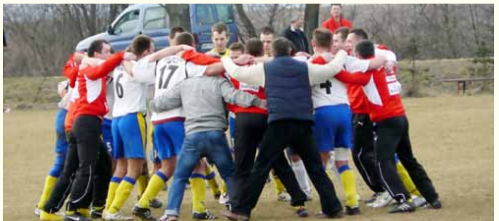
Radość piłkarzy i działaczy Galakticos po wygranym powtórzonym meczu z Odrą Lubiąż