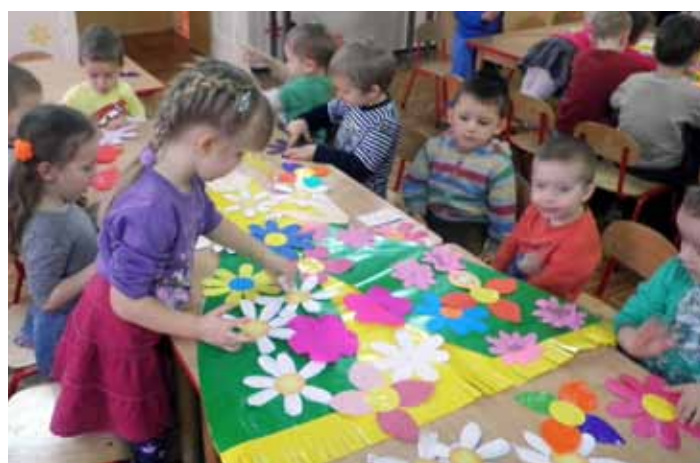
Przedszkole Samorządowe w Pustkowie Żurawskim