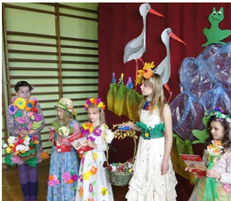
Szkoła Podstawowa w Pustkowie Żurawskim