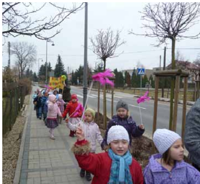
Przedszkole Samorządowe w Kobierzycach