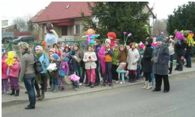
Szkoła Podstawowa w Pustkowie Wilczkowskim

Dzień 21 marca jest jednym z najbardziej oczekiwanych dni w roku, nie tylko przez dzieci i młodzież, która jak zwykle barwnie, z humorem i fantazją żegna zimę, witając jednocześnie nadejście wiosny. W tym roku przedszkolaki, dzieci i młodzież szkolna z Gminy Kobierzyce pod opieką nauczycieli, w różnorodny sposób świętowała ten wyjątkowy dzień. Były konkursy i zabawy, barwne korowody i występy artystyczne. Atrakcji nie brakowało, o czym świadczą poniższe zdjęcia.