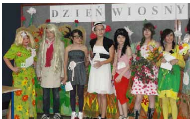
Gimnazjum w Kobierzycach