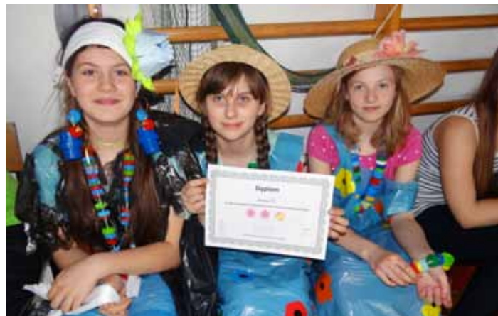
Szkoła Podstawowa w Kobierzycach