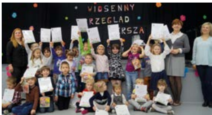
Uczestnicy przeglądu z nagrodami