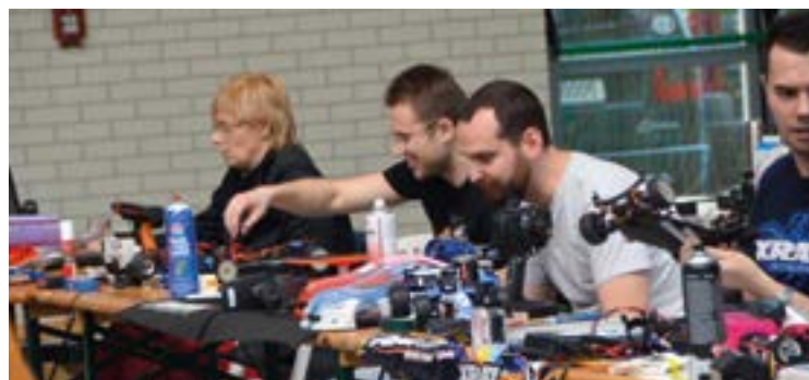
Serwis techniczny działa na medal!