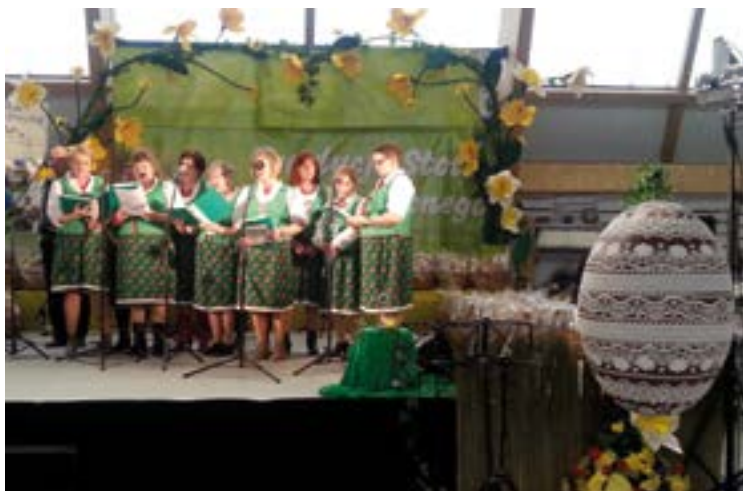
Zespół "Tyńczanki" w trakcie występu