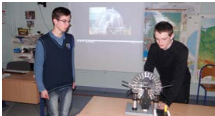
Gimnazjaliści w akcji

13 marca 2015 r. podczas dnia otwartego klas IV-VI. Miała ona charakter wspólnej zabawy uczniów i ich rodziców, którzy musieli wykazać się nie lada wiedzą. Dzięki wspólnemu dopingowi publiczności, udało się