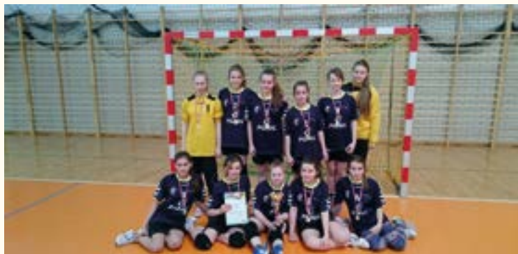
Mistrzyni strefy wrocławskiej