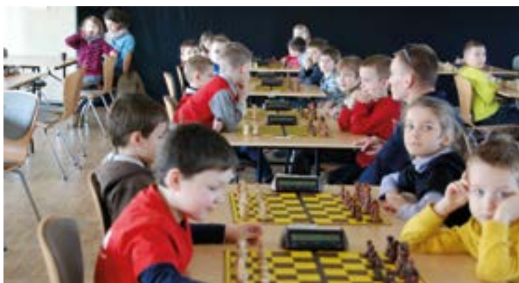
Młodzi szachiści rozgrywają partie

W sobotę 21 marca br. na rozpoczęcie kalendarzowej wiosny odbył się w obiekcie wielofunkcyjnym w Ślęzie Wiosenny Turniej Szachowy zorganizowany przez Gminne Centrum Kultury i Sportu w Kobierzycach. Rozegrano 7 rund w systemie szwajcarskim. Spośród 42 zawodników