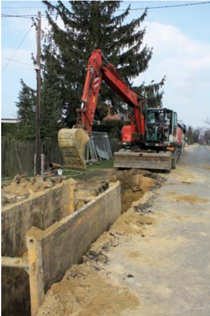
Budowa kanalizacji w Królikowicach