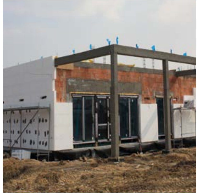
Ocieplanie budynku świetlicy w Jaszowicach