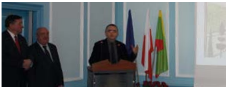
Wykład w Sali Błękitnej