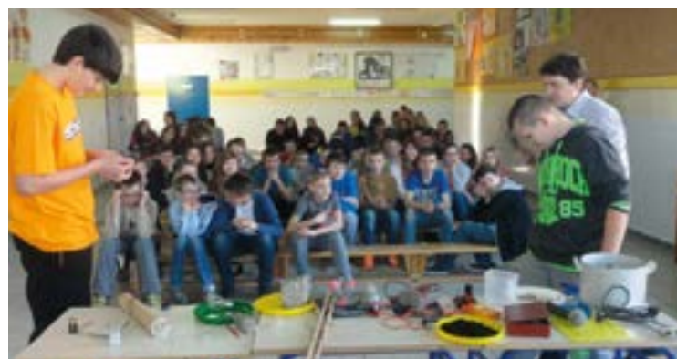
No i gdzie ten prąd?