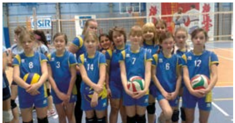
Siatkarskie nadzieje z UKS Bielik