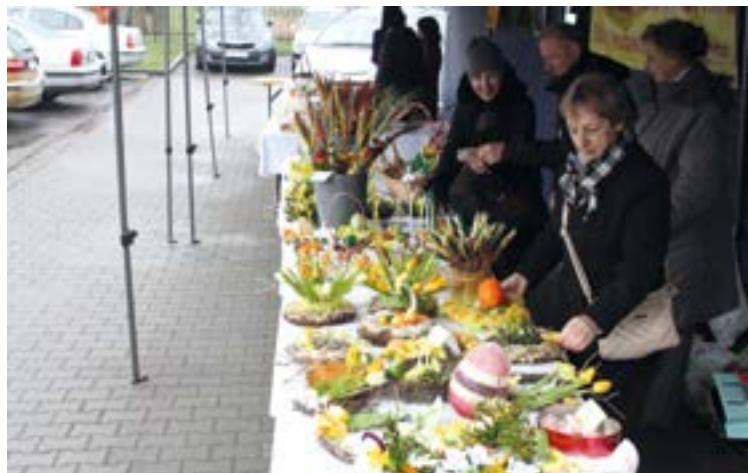
Ozdoby świąteczne w pełnej krasie

Zarząd Stowarzyszenia „Bielany dla Ciebie”