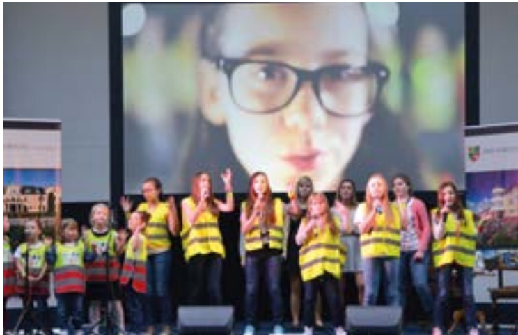
„Jagódki” i „Promyczki” na scenie

w kamizelki i opaski odblaskowe, zaśpiewały piosenkę przewodnią pod tytułem „Światelko odblaskowe”, a później wystąpił zespół „Believe”. Tadeusz Drozda najpierw z nutą satyry i komizmu złożył zebranych kobietom życzenia w dniu ich święta, a później bawił publiczność. Nie obyło się bez monologów i żartów, czyli ciętych komentarzy dotyczących paradoksów w dzisiejszej rzeczywistości naszego kraju, zarówno w sferze politycznej jak i społecznej. Zapytany skąd się biorą tematy odpowiada: - „Oprócz codziennej prasy i innych źródeł, także z rozmów z ludźmi o wszystkim - bo