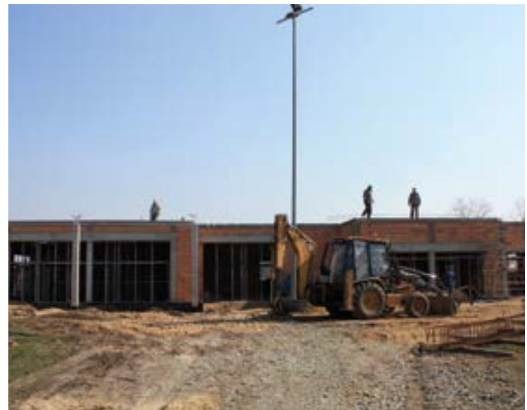
Budowa świetlicy w Tyńcu nad Słezą