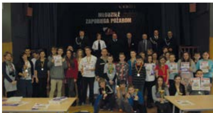
Oni znają przepisy przeciwpożarowe