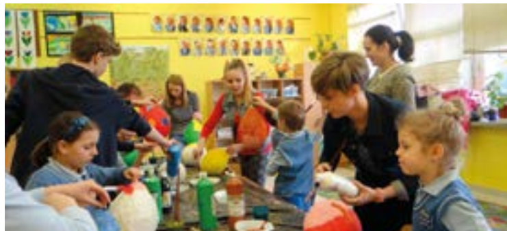
Pisanki - kraszanki

Uczestnicy wykonali również świąteczne kartki oraz inne wielkanocne ozdoby. Wszystkie wykonane prace były związane nie tylko z kultywowaniem tradycji wielkanocnych, ale i nowoczesnym spojrzeniem na rozwijanie twórczości artystycz-