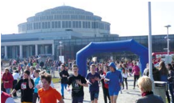
Biegali wokół Hali Stulecia

Kolejny już raz trzy klasy pierwsze oraz kl. II a Gimnazjum im. UNICEF w Bielanych Wrocławskich wzięły udział w II charytatywno-sportowym „Wrocławskim Biegu Sponsorowanym” na rzecz hospicjum dla dzieci. Przedsięwzięcie miało miejsce w pierwszy dzień wiosny 20 marca 2015 r., na Pergoli przy Hali Stulecia. Zawody polegały na współzawodnictwie dzieci i młodzieży oraz poszukiwaniu sponsorów. Szybkość nie miała znaczenia, można było biec lub iść, ważne było poświęcenie swojego czasu i wysiłku dla potrzebujących, w tym wypadku dla Fundacji Wrocławskie Hospi-