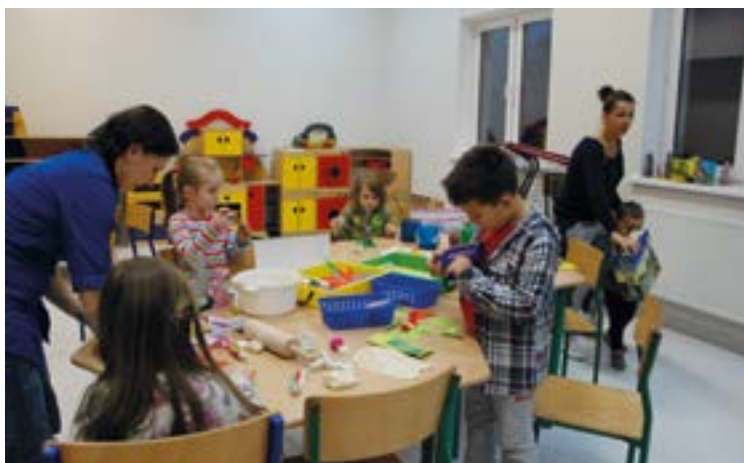
W świetlicy nie można się nudzić