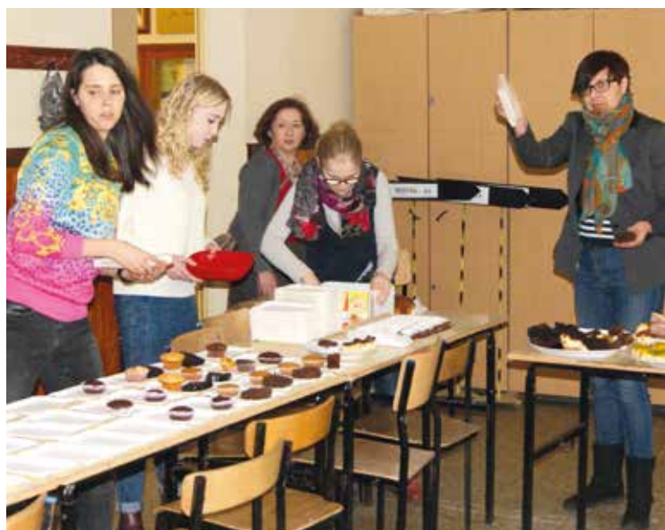
Wolontariuszki przygotowują słodki poczęstunek

Kolejny już raz wolontariusze z Gimnazjum w Bielanych Wrocławskich pomagali bezdomnym uczestnicząc w spotkaniu z cyklu „Miłosierdzie bez granic”. Diakonia Miłosierdzia wspólnoty „Hallelu Jah”, współpracując z kuchnią charytatywną przy franciszkańskiej parafii pw. św. Antoniego we Wrocławiu, zaprosiła ubogich na kolejne spotkanie 5 marca 2016 roku. Tym razem przybyło na nie około 120 osób wywodzących się przede wszystkim z grona ludzi korzystających z charytatywnej kuchni prowadzonej