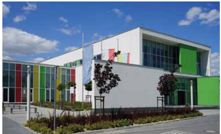
Zespół Szkolno-Przedszkolny w Tyńcu Małym