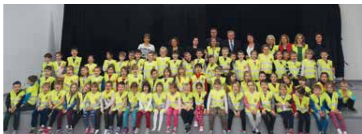
Dzieci w kamizelkach odblaskowych są bardziej widoczne