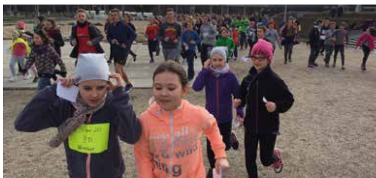
Uczestnicy na trasie biegu