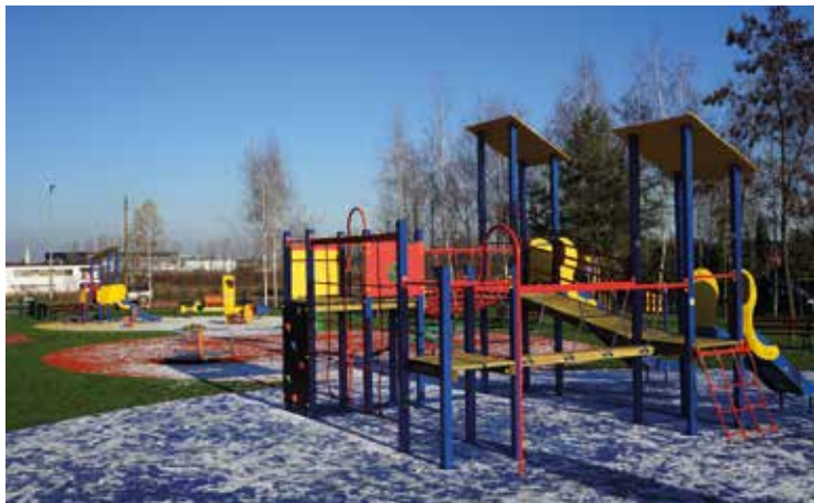
Plac zabaw w Bielanach Wrocławskich