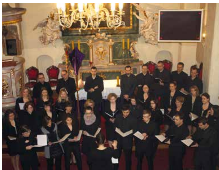
Połączone chóry śpiewały pieśni pasyjne