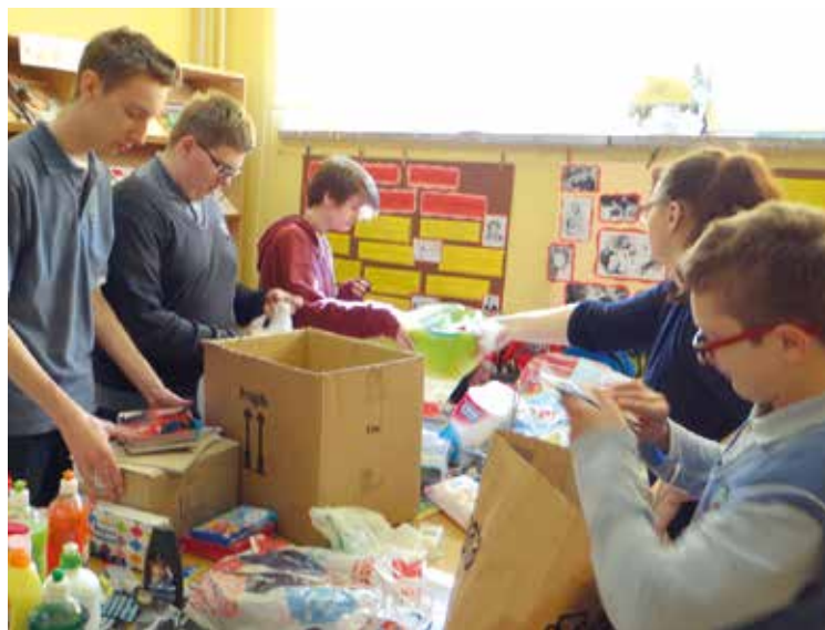
Zbiórka darów dla dzieci z Kamerunu