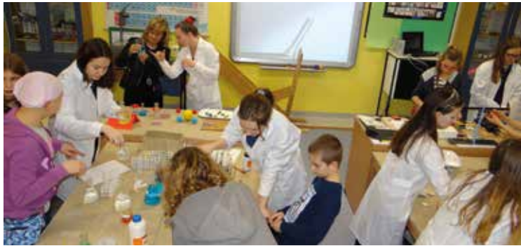
Doświadczenia w pracowni chemiczno-fizycznej