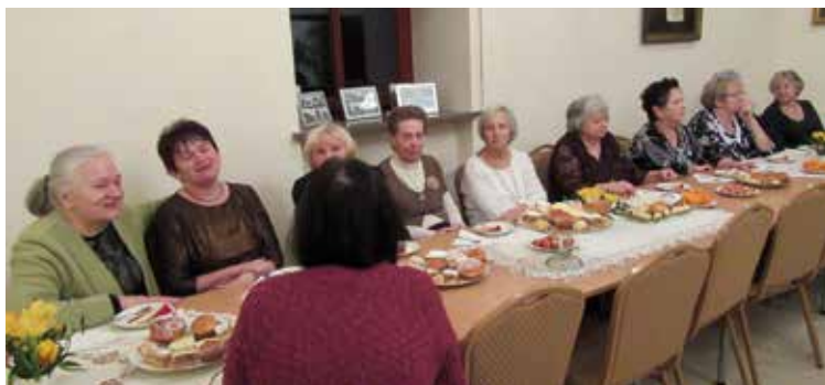
Spotkanie w domu parafialnym w Bielanych Wrocławskich

Zadanie współfinansowane ze środków otrzymanych z Gminy Kobierzyce.