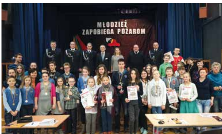
Laureaci konkursu z nagrodami