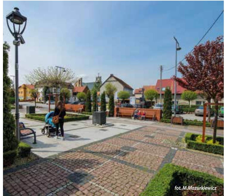
Oświetlenie i chodniki w Kobierzycach

Przypomnijmy, że na przestrzeni ostatnich lat szereg ważnych zadań inwestycyjnych w Gminie Kobierzycze zostało zrealizowanych z sukcesem. Jedne z ważniejszych to: budowa Zespołu Szkolno-Przedszkolnego w Tyńcu Małym, który został otwarty w 2014 r.; budowa Hali Sportowo-Widowiskowej w Kobierzycach, zakończona w 2011 r.; realizacja programu budowy świetlic – prawie każda miejscowość posiada własną świetlicę; zakończenie budowy kanalizacji sanitarnej w 11 miejscowościach położonych w południowej części gminy; budowa placów zabaw dla dzieci m.in. w Pelczycach, Bielanach Wrocławskich, Kobierzycach, Tyńcu Małym; wybudowanie terenu sportowo-rekreacyjnego w Bielanach Wrocławskich „Arkalandia” z amfiteatrem, siłownią zewnętrzną, wielofunkcyjnym boiskiem, skate parkiem; budowa dróg, chodników, oświetlenia; budowa Zespołu Szkolno-Przedszkolnego wraz ze żłobkiem w Wysokiej, który zostanie otwarty we wrześniu 2016 r. To tylko przykłady zrealizowanych inwestycji – jest ich znacznie więcej. Dzięki