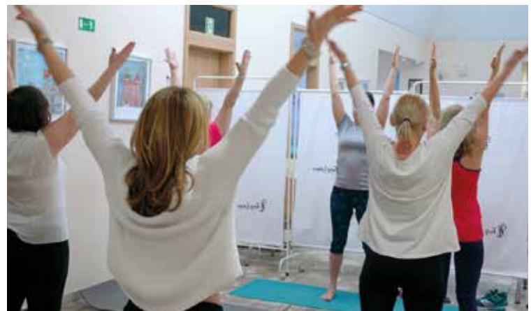
Najlepszy prezent – zdrowie!