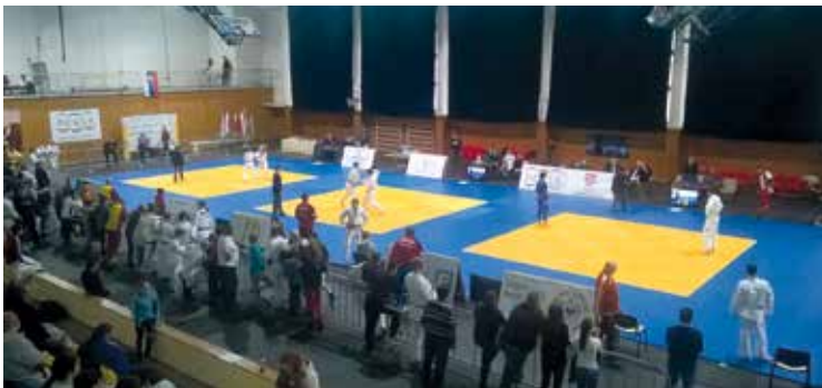
Tak walczone w Bańskiej Bystrzycy