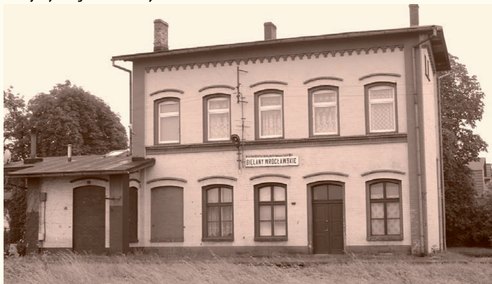
Budynek dworca kolejowego w Bielanych Wrocławskich