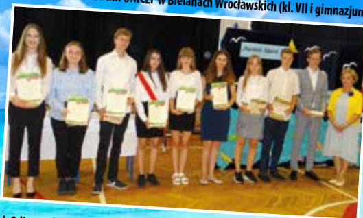
Szkoła Podstawowa im. Janusza Korczaka w Wysokiej