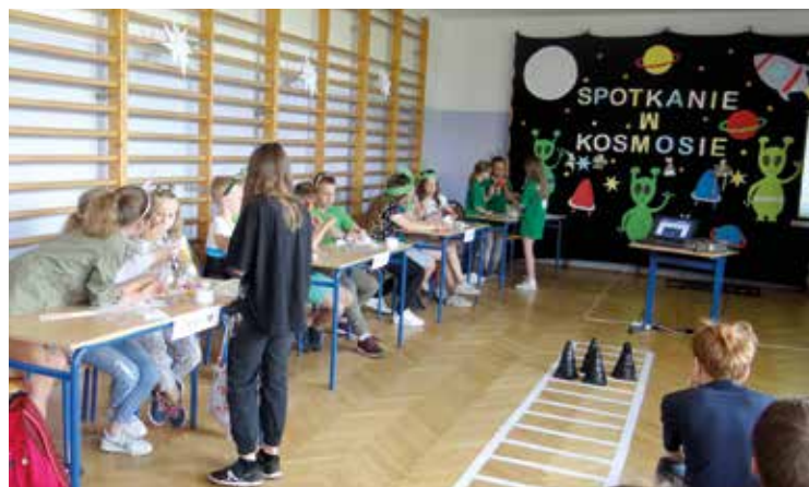
Uczestnicy konkursu odkrywali tajemnice Wszechświata

W pierwszej połowie czerwca w Szkole Podstawowej w Bielanych Wrocławskich odbyła się międzyszkolna impreza „Spotkanie w Kosmosie” przygotowana przez nauczycieli przedmiotów matematyczno-przyrodniczych. To niecodzienne spotkanie zgromadziło uczniów klas piątych ze szkół podstawowych Gminy Kobierzyce, przebranych w kosmiczne stroje. Zespoły z poszczególnych szkół podejmowały różnorodne działania, które umożliwiły im poznanie wielu tajemnic otaczającego Wszechświata. Uczniowie po obejrzeniu interesującego filmu edukacyjnego wykonywali plakaty dotyczące planet Układu Słonecznego oraz tworzyli zabawne wierszyki, które miały pomóc zapamiętać kolejność planet w Układzie Słonecznym. Następnie wcielili się w rolę słynnych konstruktorów, którzy tworzyli sprzęt dla bezpiecznego lądowania sondy kosmicznej na planecie z dostępnych elementów (balony, wata, słomki do napojów, sznurek, kartki papieru, patyki do szaszłyków, woreczki