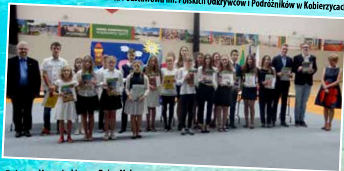
Szkoła Podstawowa w Pustkowie Wilczkowskim