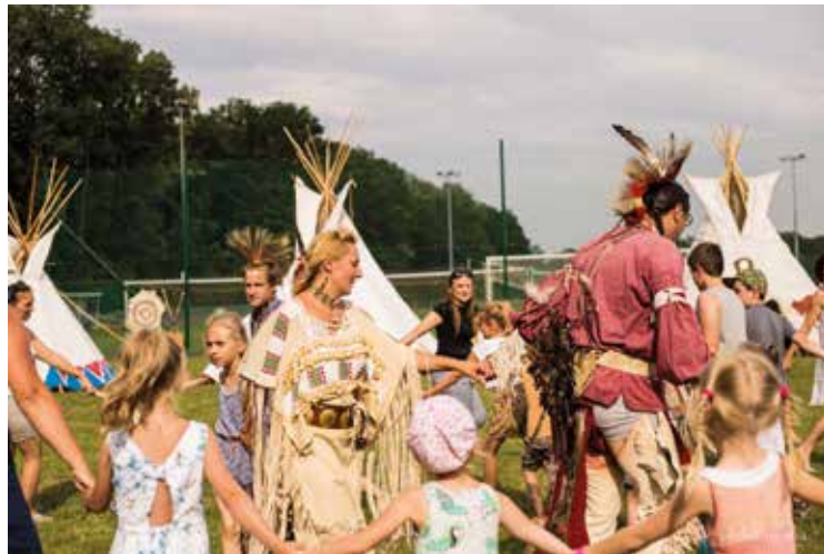
Wioska indiańska w Wierzbicach