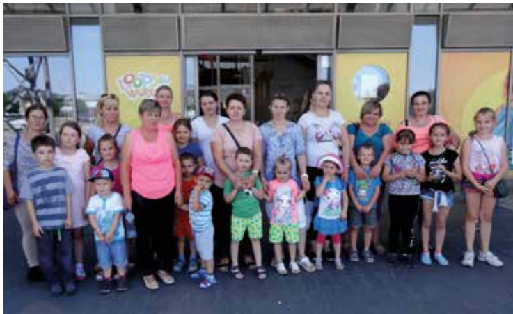
Kolejny projekt GOPS sprawił dzieciom wiele radości