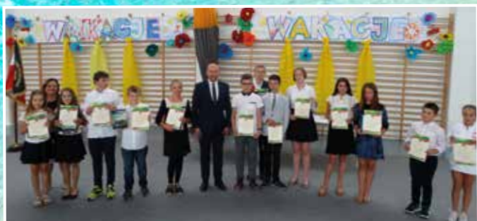
Szkoła Podstawowa im. Romualda Traugutta w Pustkowie Żurawskim