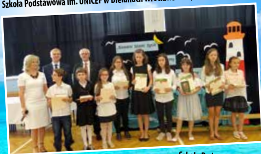
Szkoła Podstawowa im. UNICEF w Bielanych Wrocławskich (kl. VII i gimnazjum)