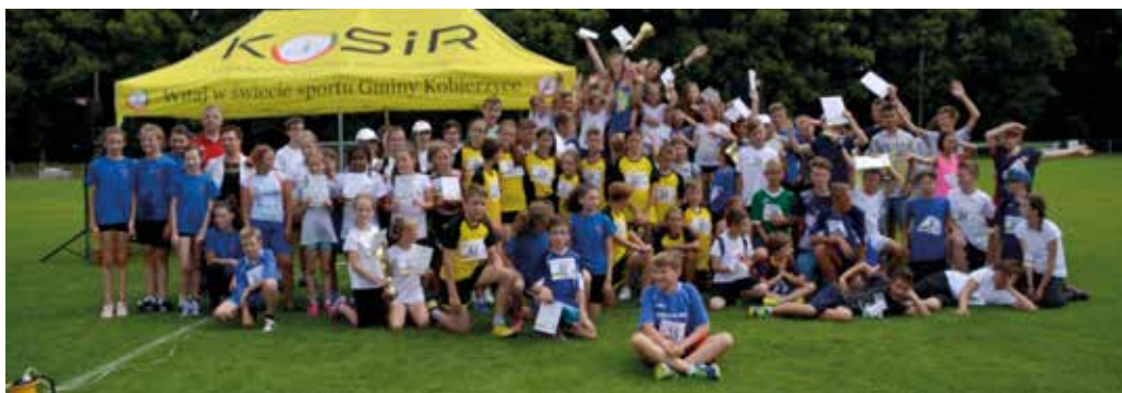
W zawodach wzięło udział ponad 100 uczniów z Gminy Kobierzyce