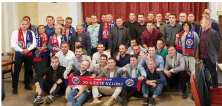
Pamiątkowe zdjęcie uczestników jubileuszowego spotkania