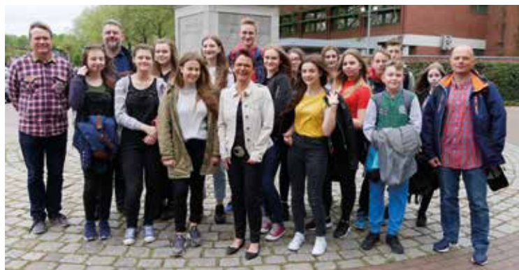
Wymiana młodzieży jest szansą na zawarcie nowych przyjaźni