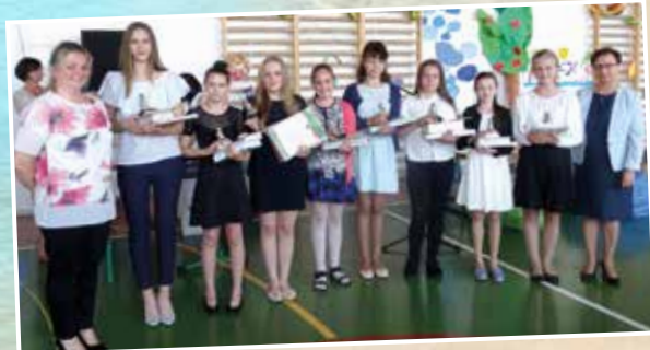
Szkoła Podstawowa im. Tadeusza Mazowieckiego w Tyńcu Małym