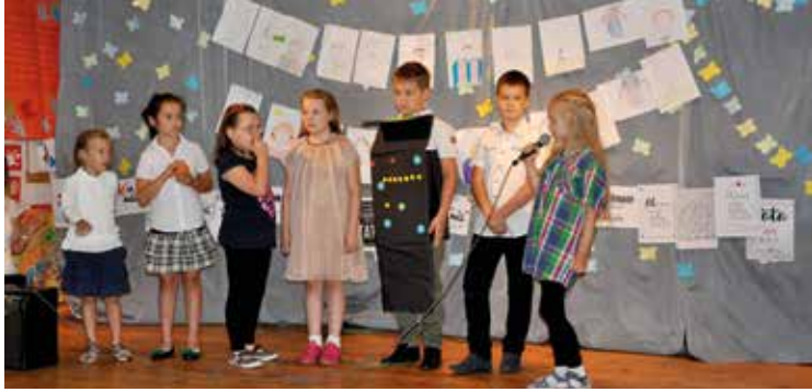
Mali artyści kabaretowi z Pełczyc rozbawili widzów