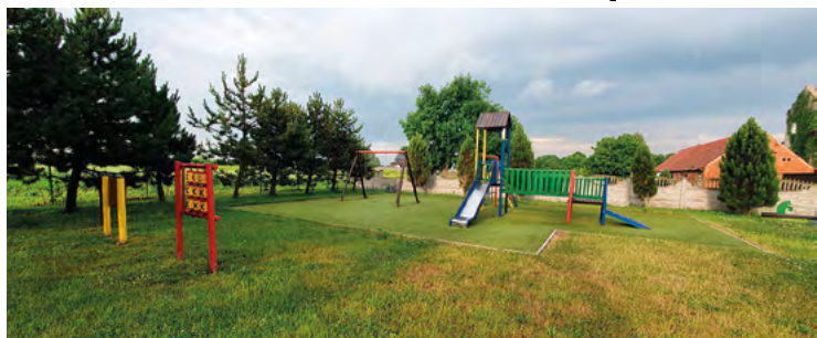
Kobierzycki Ośrodek Sportu i Rekreacji Szczepankowice