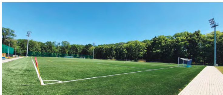
Kobierzyce, ul. Sportowa