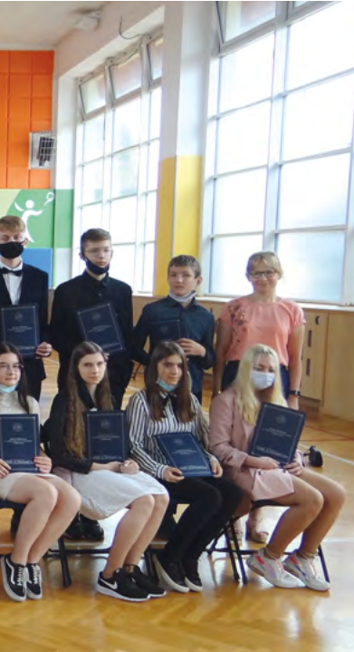
klasa VIII a