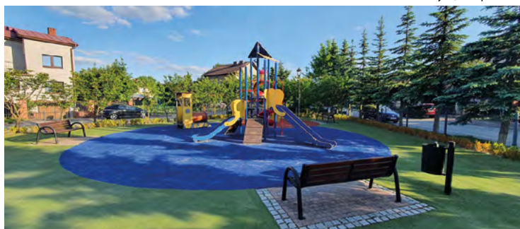
Kobierzyce, ul. Świętego Wojciecha