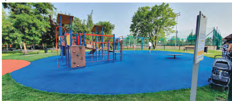
Bielany Wrocławskie, ul. Brzozowa