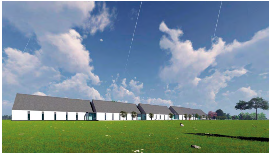
Wizualizacje przedszkola w Domasławiu

– Skoro o budynkach mowa, to przyjrzyjmy się temu, co widzimy w Bielanych Wrocławskich na dawnym boisku. Trzeba przyznać, że nowe budynki szkolne robią wrażenie. Kiedy możemy się spodziewać, że pojawią się w nich uczniowie?