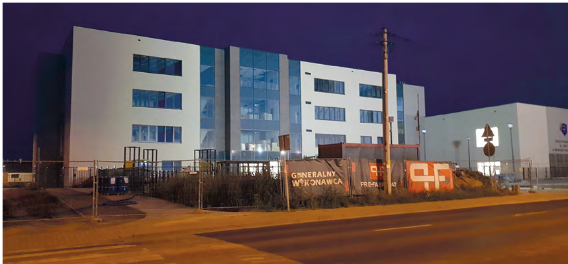
Budowa szkoły w Bielanych Wrocławskich