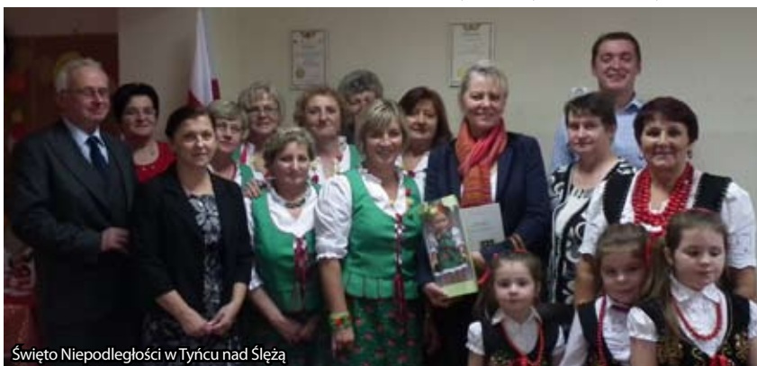
Święto Niepodległości w Tyńcu nad Ślężą