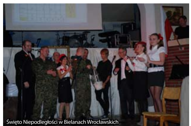
Święto Niepodległości w Bielanych Wrocławskich