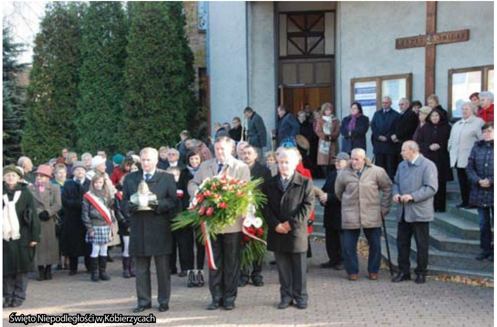
Święto Niepodległości w Kobierzycach