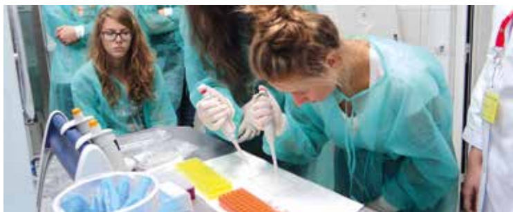
Ćwiczenia przebiegały w skupieniu

robotów. Poznali wiele wszechstronnych zastosowań sztucznej inteligencji, próbując zrozumieć sposób matematycznego myślenia komputerów, opartego na rachunku prawdopodobieństwa poznanego w szkole. Na wydziale Mechaniczno-Energetycznym Politechniki Wrocławskiej uczniowie poznali palność i wybuchowość produktów spożywczych cukru i mąki jako paliwa energetycznego. Odkrywali również innowacyjne technologie na interaktywnej wystawie stoisk „Labiryntów techniki”. Duże wrażenie