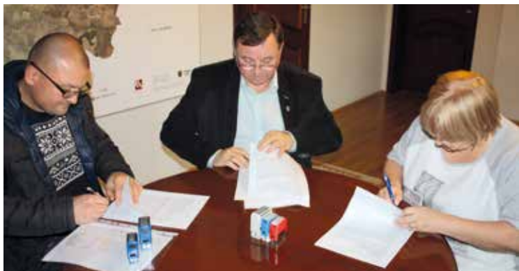
...i przebudowę ul. Spółdzielczej w Kobierzycach