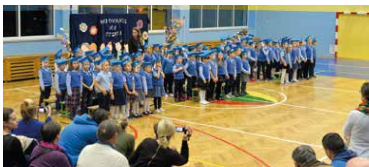
Nie ma to jak być pierwszakiem!