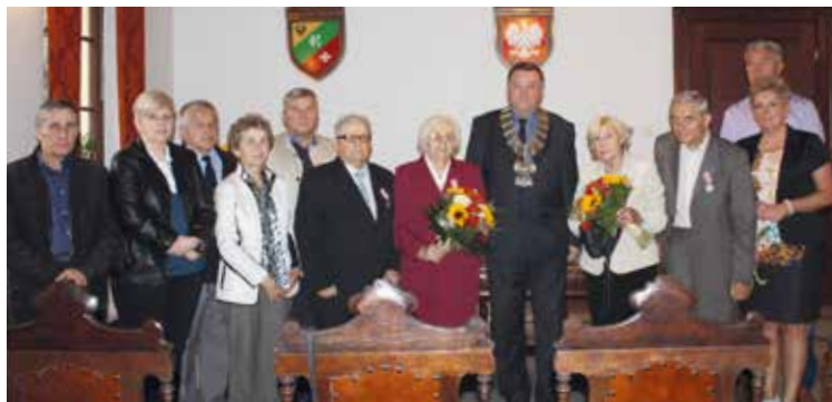
Po części oficjalnej był czas na pamiątkowe zdjęcie