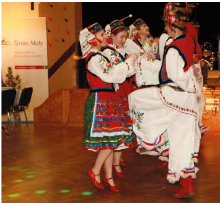
Tańczy zespół „Arkant” z Przemysła