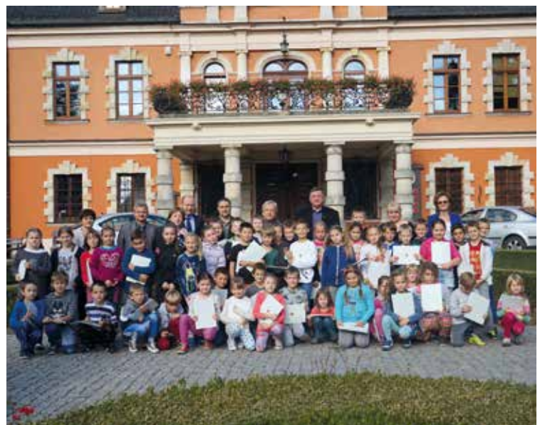
Pamiątkowe zdjęcie uczestników „Sesji z klasą”