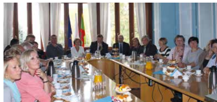
Spotkanie w Sali Błękitnej