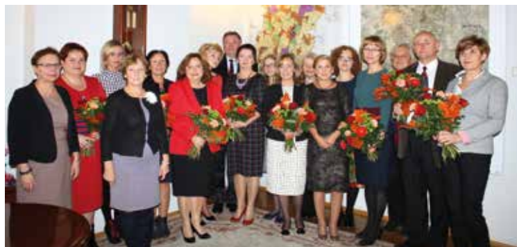
Uroczyste spotkanie z nauczycielami w Urzędzie Gminy