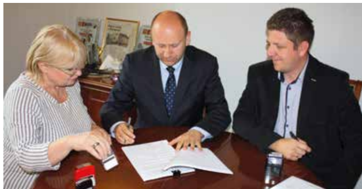
Podpisanie umowy na rozbudowę ośrodka zdrowia w Kobierzycach...