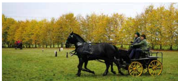
Pokaz powożenia zaprzęgiem dwukonnym