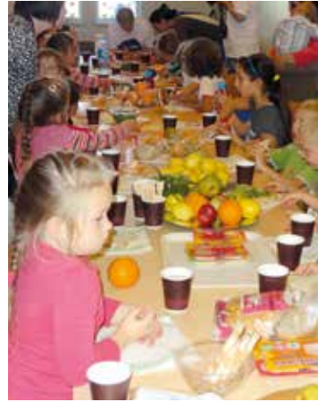
Zdrowa żywność smakowała dzieciom