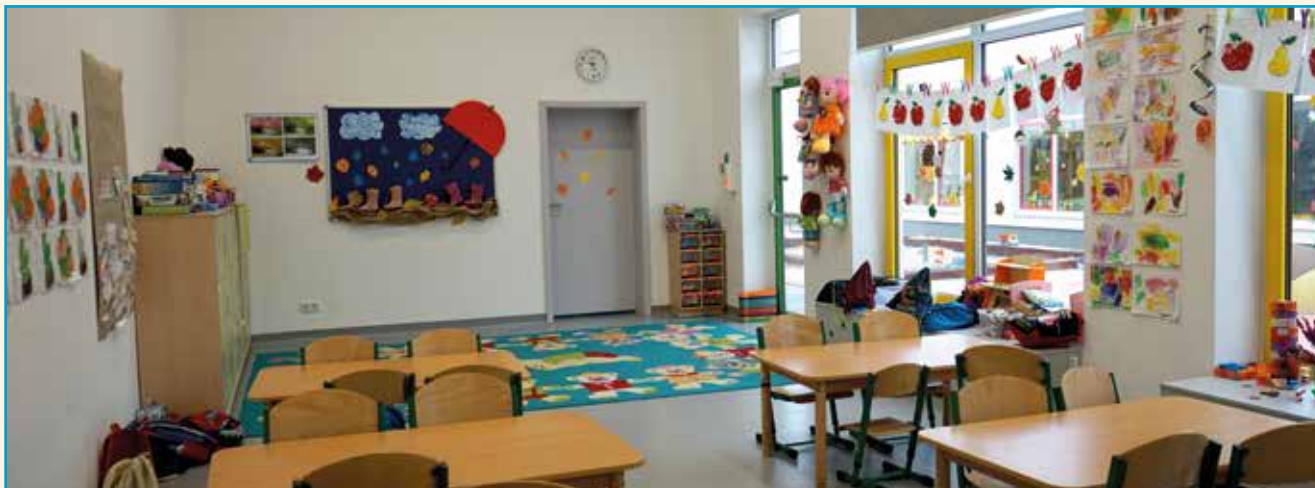
ZSP w Tyńcu Małym – nowa sala wydzielona z auli