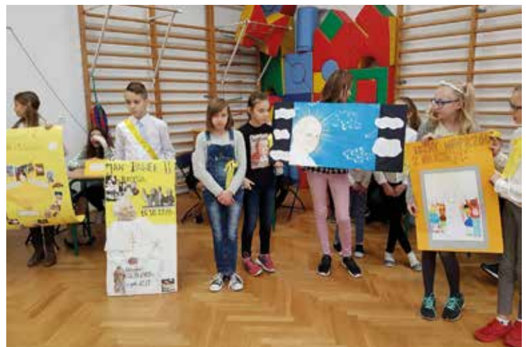
Uczestnicy konkursu byli znakomicie przygotowani