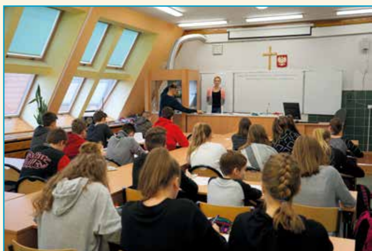
Gabinet chemiczny w Szkole Podstawowej w Kobierzycach