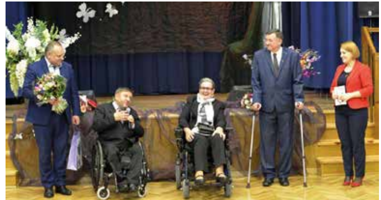
„Złote Serce” otrzymał Sławomir Piechota (drugi z lewej) – Poseł na Sejm RP