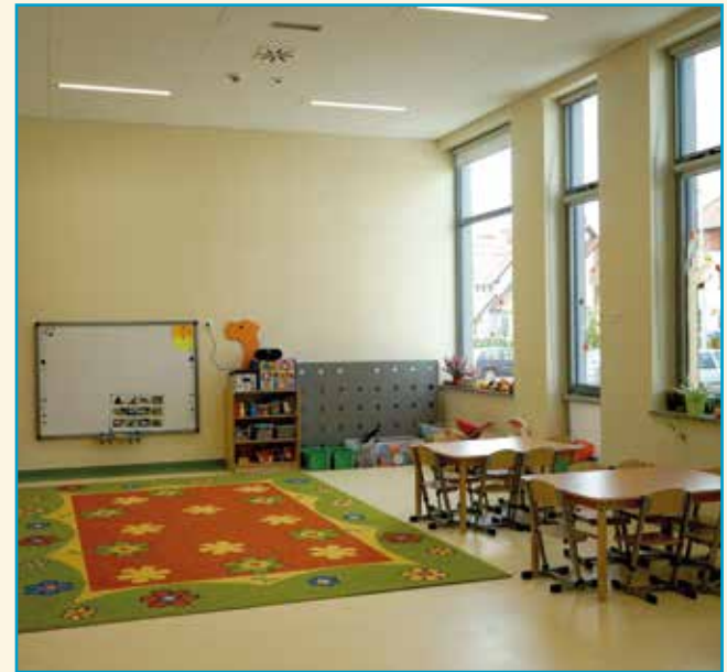
Nowa sala zabaw w ZSP w Wysokiej