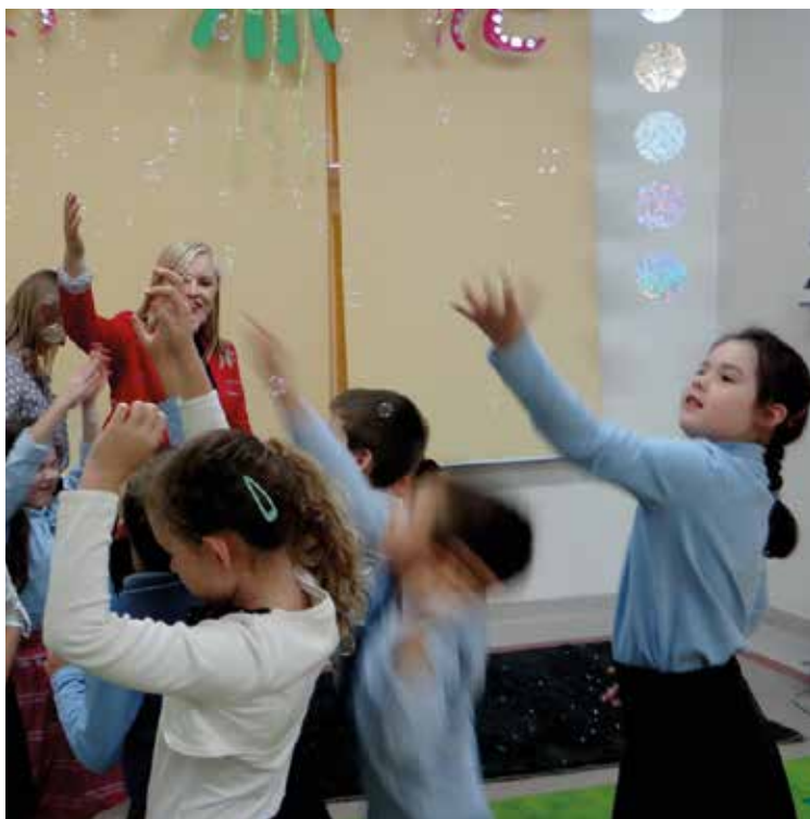
Kolorowe bąbelki dostarczają silnych wrażeń wzrokowych

Nowa, ciekawa i niekonwencjonalna Sala Doświadczenia Świata została uroczystie otwarta w Szkole Podstawowej im. UNICEF w Bielaniach Wrocławskich 14 października, przez Wójta Gminy Kobierzyce Ryszarda Pacholika. Z radością dołączyliśmy do placówek, które mają nowoczesne i przyjazne dla dzieci miejsce. W czasie zajęć przestrzegane są następujące zasady: nie stawiamy wymagań, nie wydajemy poleceń, zostawiamy dziecku możliwość wyboru. W sali tej znajdują się m. in.: tor świetlny-dźwiękowy nakłaniający do ruchu, ułatwiający zapamiętywanie kolorów oraz pozwalający na granie prostych melodii. Kolumny wodne – poruszające się i zmieniające kolor bąbelki dostarczają silnych wrażeń wzrokowych, słuchowych i dotykowych. Specyficzny dźwięk wody jest obiektem żywego zainteresowania – nie tylko wśród małych dzieci. Naszych uczniów bardzo zaciekał przysznik świetlny, czyli elastyczne, widoczne w ciemnościach i bezpieczne w użyciu światłowody. Wiele zachwyty wywołał