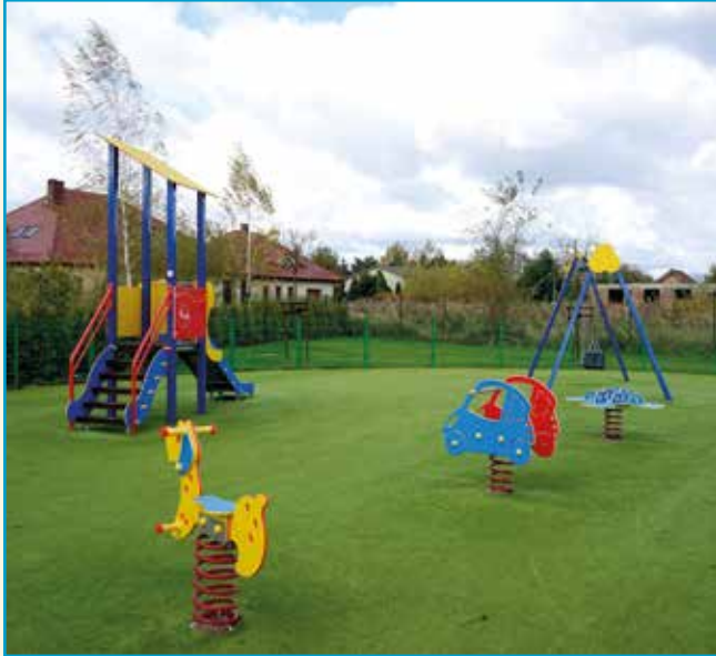
Bielany Wrocławskie – ul. Cisowa

W tym roku place zabaw powstały w takich miejscowościach jak: Wierzbice, Kobierzyce, Bielany Wrocławskie (ul. Cisowa i Arkalandia – wymiana nawierzchni na tzw. bezpieczną) oraz w Pustkowie Żurawskim. Docelowo nowocześnie wyposażone i bezpieczne obiekty tego typu mają powstać w każdej miejscowości naszej gminy.