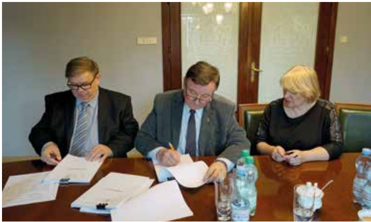
Moment podpisania umowy na budowę kanalizacji