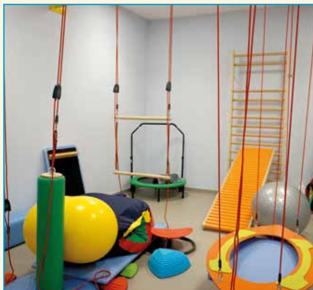
Sala zajęć integracji sensorycznej w ZSP w Wysokiej