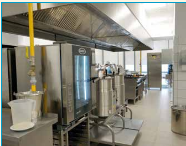
Zmodernizowana kuchnia w ZSP w Wysokiej

Tegoroczne inwestycje Gminy Kobierzyce związane z budową obiektów szkolnych, ich remontów bądź prac projektowych, w dużej mierze zależne były od wdrażanej przez rząd reformy systemu oświaty, zakładającej powrót do ośmioklasowych szkół podstawowych oraz stopniowe wygaszanie gimnazjów. W związku z tym w Tyńcu Małym w Zespole Szkolno-Przedszkolnym przeprowadzono prace modernizacyjne, w wyniku których powstały trzy nowe pomieszczenia przeznaczone na sale lekcyjne, a kilka już istniejących zostało zmodernizowanych i wyposażonych w nowoczesny i specjalistyczny sprzęt. W ten sposób powstał gabinet biologiczno-chemiczny oraz gabinet geograficzny. Dodatkowo uzyskano też pomieszczenie dla dzieci z „zerówki”. Kolejnym czynnikiem, który ukierunkował nasze działania, była potrzeba pilnego znalezienia około 100 nowych miejsc dla dzieci w wieku przedszkolnym. Związane jest to bezpośrednio ze stałym wzrostem liczby mieszkańców (głównie młodych małżeństw z dziećmi), którzy postanowili zamieszkać