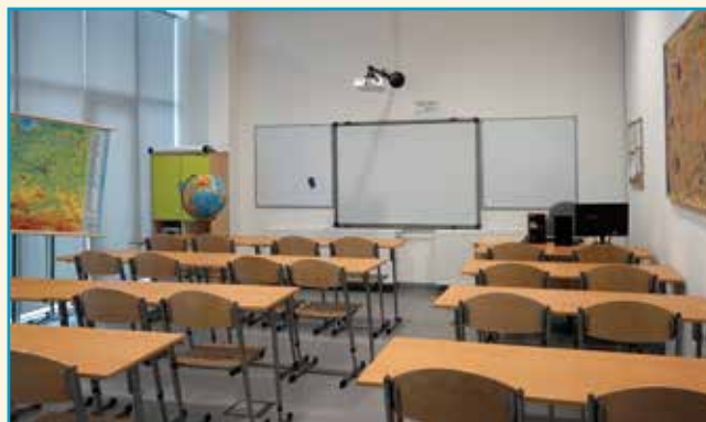
Gabinet geograficzny w ZSP w Tyńcu Małym

W tym roku zakończono remont budynku w Szkole Podstawowej w Kobierzycach wraz z salą gimnastyczną oraz wykonano niezbędne prace na dziedzińcu szkolnym. Zostały też doposażone gabinety – między innymi chemiczny i do nauki języka angielskiego. Ze względu na to, że w szkole normalnie prowadzone są zajęcia lekcyjne – prace remontowe zostaną wznowione w okresie wakacyjnym. Bez przeszkód przebiegają prace związane z budową nowego przedszkola w Kobierzycach. Tempo robót jest bardzo dobre i wygląda na to, że ten bardzo potrzebny obiekt zostanie oddany do użytku zgodnie z harmonogramem.