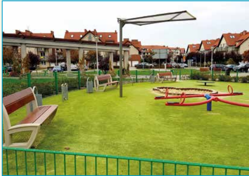
Bezpieczna nawierzchnia w Arkalandii