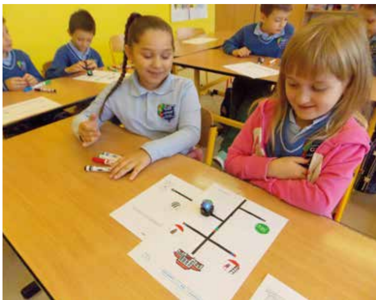
Dzieci wyznaczały trasę Ozobotów