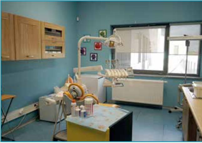
Gabinet stomatologiczny w ZSP w Wysokiej

w naszej dynamicznie rozwijającej się gminie. Rozpatrywaliśmy wiele możliwości rozwiązania tego problemu i zdecydowaliśmy się ostatecznie na zaadoptowanie pomieszczeń świetlicy wiejskiej w istniejącym Zespole Szkolno-Przedszkolnym ze Żłobkiem w miejscowości Wysoka. Takie rozwiązanie pozwoliło na uzyskanie blisko 70 nowych miejsc przedszkolnych. Dodatkowo 25 miejsc uzyskaliśmy w Gminnym Zespole Szkół w Bielanych Wrocławskich. Prace modernizacyjne, które zostały tam wykonane, to m.in. dostosowanie sanitariatów do potrzeb najmłodszych dzieci. W tej samej szkole został utworzony gabinet doświadczeń świata, przeznaczony dla uczniów ze specjalnymi potrzebami edukacyjnymi. Przyjęte rozwiązania spowodowały konieczność przeprowadzenia niezbędnych i szybkich prac adaptacyjnych w tych obiektach. Dotyczyło to przede wszystkim rozbudowy kuchni wraz z zapleczem, istniejącej w budynku szkolnym w Wysokiej, która była przecież pierwotnie zaprojektowana do obsługi znacznie mniejszej liczby osób.