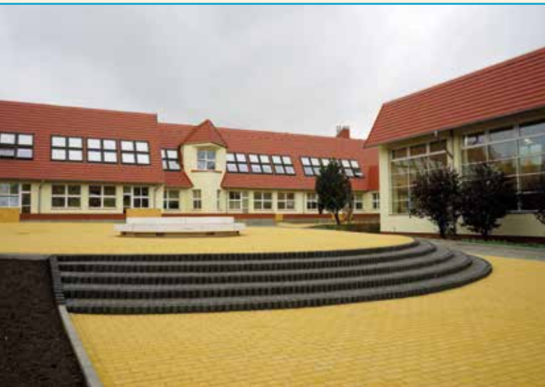
Dziedziniec szkolny w Szkole Podstawowej w Kobierzycach