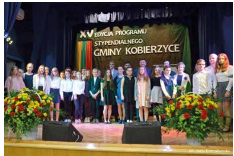
Stypendyści na scenie Kobierzyckiego Ośrodka Kultury