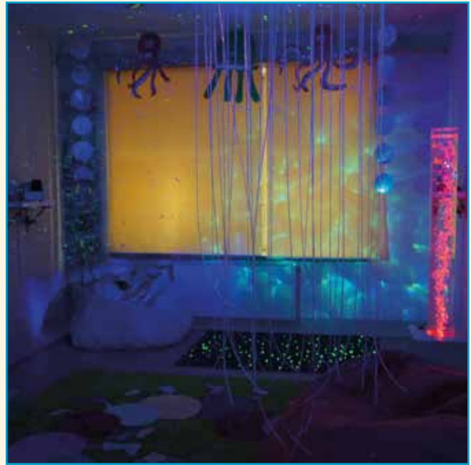
Sala Doświadczenia Świata w GZS w Bielanych Wrocławskich

w naszej dynamicznie rozwijającej się gminie. Rozpatrywaliśmy wiele możliwości rozwiązania tego problemu i zdecydowaliśmy się ostatecznie na zaadoptowanie pomieszczeń świetlicy wiejskiej w istniejącym Zespole Szkolno-Przedszkolnym ze Żłobkiem w miejscowości Wysoka. Takie rozwiązanie pozwoliło na uzyskanie blisko 70 nowych miejsc przedszkolnych. Dodatkowo 25 miejsc uzyskaliśmy w Gminnym Zespole Szkół w Bielanych Wrocławskich. Prace modernizacyjne, które zostały tam wykonane, to m.in. dostosowanie sanitariatów do potrzeb najmłodszych dzieci. W tej samej szkole został utworzony gabinet doświadczeń świata, przeznaczony dla uczniów ze specjalnymi potrzebami edukacyjnymi. Przyjęte rozwiązania spowodowały konieczność przeprowadzenia niezbędnych i szybkich prac adaptacyjnych w tych obiektach. Dotyczyło to przede wszystkim rozbudowy kuchni wraz z zapleczem, istniejącej w budynku szkolnym w Wysokiej, która była przecież pierwotnie zaprojektowana do obsługi znacznie mniejszej liczby osób.