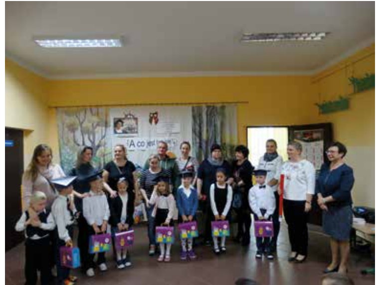
Dzieci otrzymały kufereki pełne prezentów