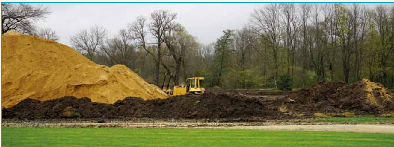
Prace przy modernizacji Stadionu w Kobierzycach