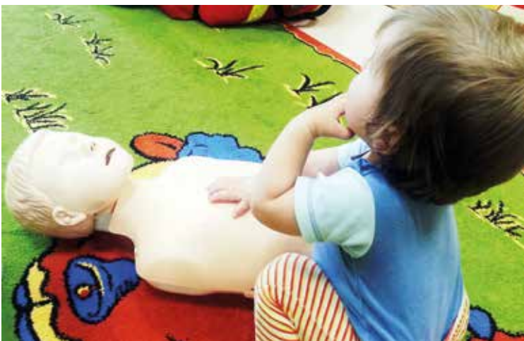
Dzieci chętnie wykonywały ćwiczenia

W środę 11 października w żłobku w szkole w Wysokiej odbyły się warsztaty, na których dzieci uczyły się udzielania pierwszej pomocy przedmedycznej. Podczas spotkania dzieci poczuły się jak mali ratownicy. Poznały procedury zachowania się w sytuacjach zagrożenia życia oraz obserwowały czynności ratownicze. Maluchy nie są w stanie ucisnąć fantoma czy zrobić właściwego wdechu (choć większość dzielnie próbowała), warto jednak oswajać najmłodszych z tematem pierwszej pomocy,