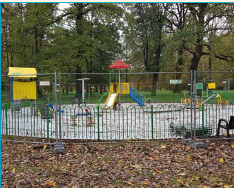
Plac zabaw w kobierzyckim parku