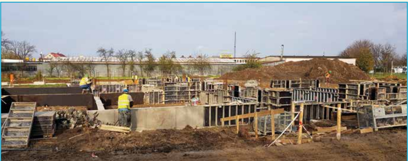
Budowa przedszkola w Kobierzycach