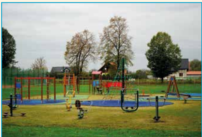
Plac zabaw w Pustkowie Żurawskim