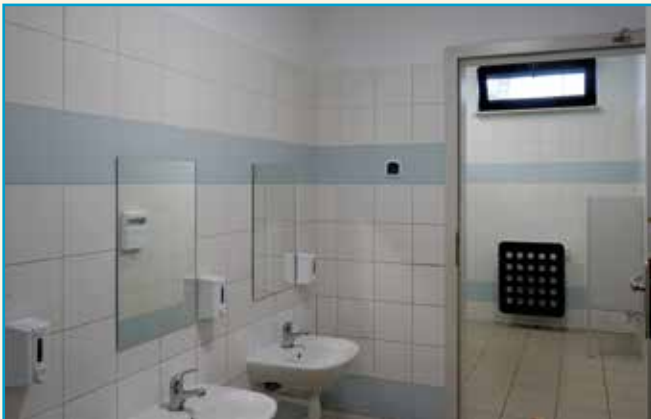
Nowe sanitariaty w GZS w Bielanych Wrocławskich