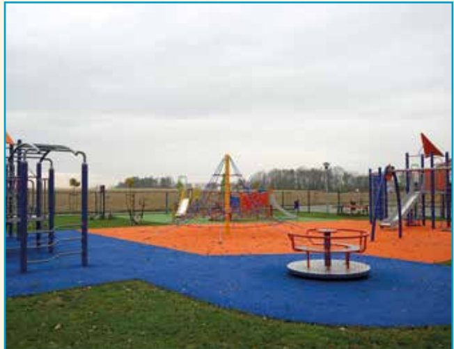
Plac zabaw w Wierzbicach