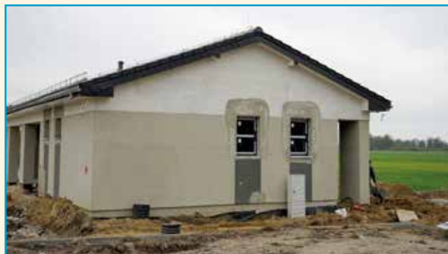
Budowa szatni przy boisku w Solnej

Budowa obiektu socjalnego w Solnej – dobiega końca budowa obiektu na potrzeby piłkarzy miejscowego klubu oraz budowa parkingu.