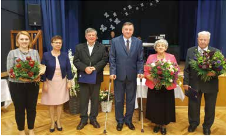
Obchody Dnia Seniora odbyły się w Kobierzyckim Ośrodku Kultury