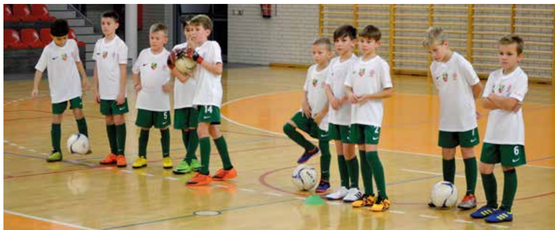
Za moment rozpocznie się trening

Wychodząc naprzeciw oczekiwaniom mieszkańców, w maju 2018 r przy współpracy władz gminy i Dolnośląskiego Związku Piłki Nożnej została utworzona Akademia Piłkarska Gminy Kobierzyce. Akademia Piłkarska skupia 32 wyselekcjonowanych zawodników w kategoriach wiekowych U9 i U11, którym jak w przypadku uczestników innych sekcji