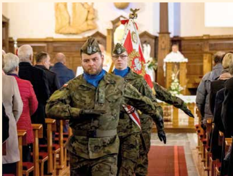
Wprowadzenie sztandarów po Mszy Św.