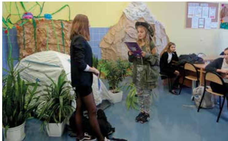
Uczniowie grali z wielkim zaangażowaniem