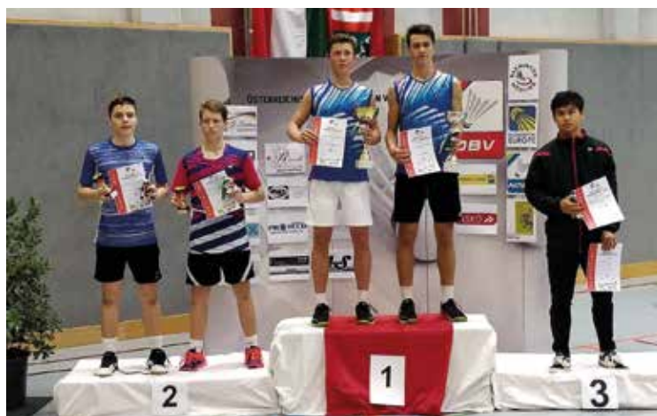
Mikołaje na najwyższym stopniu podium