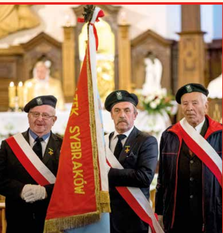
Sztandar Związku Sybiraków

w: Kobierzycach, Bielanych Wrocławskich, Pustkowie Żurawskim, Pustkowie Wilczkowskim, Wysokiej i Tyńcu Małym.