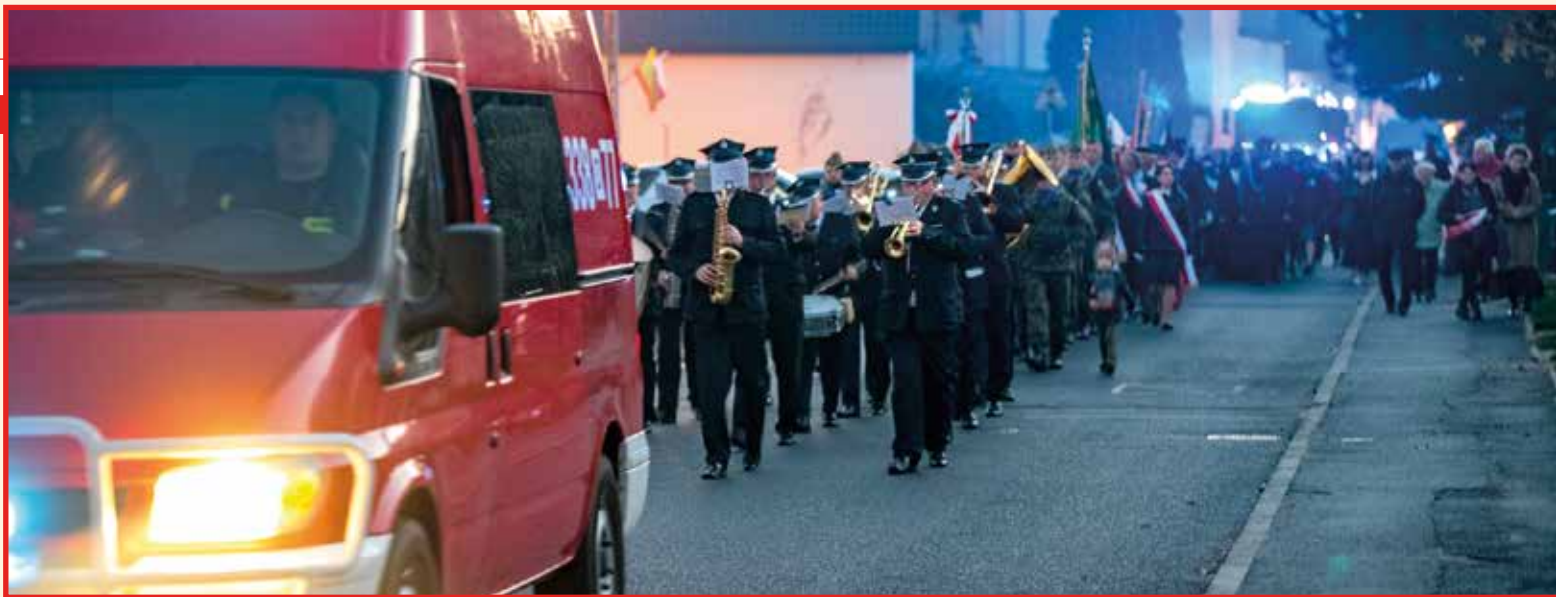
Uczestnicy przemaszerowali do Hali Sportowo-Widowiskowej im. Adama Wójcika w Kobierzycach