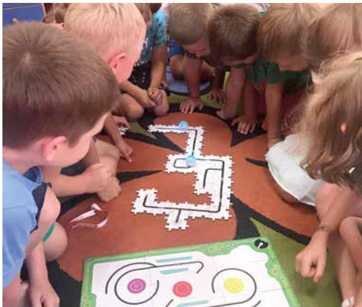
Programowania można się uczyć od najmłodszych lat