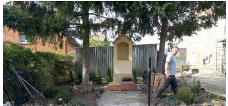
W Królikowicach trwa porządkowanie terenu przy kapliczce

W październiku, w czterech miejscowościach Gminy Kobierzycy tj. Chrzanowie, Bielanych Wrocławskich, Cieszycach i Królikowicach, grupy mieszkańców realizowały małe inicjatywy społeczne zmieniające przestrzeń publiczną. W Bielanych Wrocławskich zadbano o teren przyległy do sali przy kościele, w Cieszycach zostały zakupione donice poprawiające wizerunek przy świetlicy wiejskiej oraz został odnowiony skwer. W Królikowicach mieszkańcy za cel swój wzięli odnowienie terenu przy kapliczce, natomiast w Chrzanowie działania skupiły się na „Ogrodzie Zmysłów i Smaków” – miejscu edukacyjnym przy boisku wiejskim, gdzie zrobiono pierwszy etap ścieżki. We wszystkie te działania włączyło się minimum po 10 mieszkańców z każdej wsi. Materiały