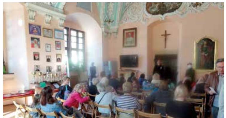
Wnętrze klasztoru prezentują się okazale

W dniu 13.10.2018 r. Stowarzyszenie „Bielany dla Ciebie” zorganizowało wycieczkę do Henrykowa pod hasłem „Rodzinne powitanie jesieni”. Każda wycieczka musi zawierać w sobie elementy edukacji i zabawy. Tak też było tym razem. Najpierw uczestnicy zwiedzili z przewodnikiem przepiękny klasztor cystersów i zobaczyli pierwsze słowa zapisane w języku polskim. Następnie dorośli uczestnicy mogli spróbować piwa henrykowskiego czy opatowskiego. Potem wszyscy udali się do parku, w którym Nadleśnictwo Henryków przygotowało dla nas ognisko. Tam dzieci