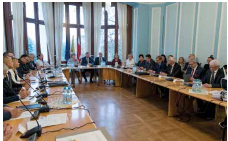
I sesja VIII kadencji rozpoczęta