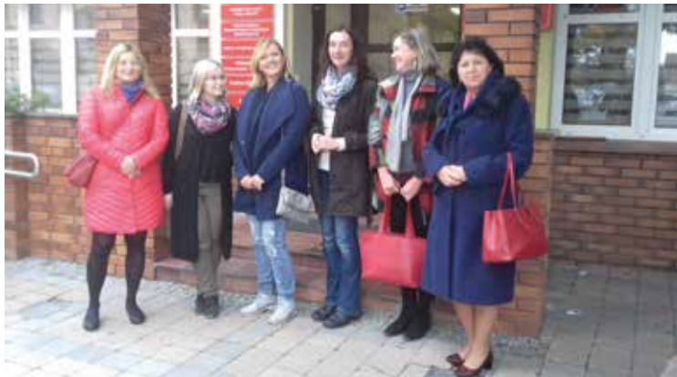
Panie przed budynkiem GOPS w Kobierzycach