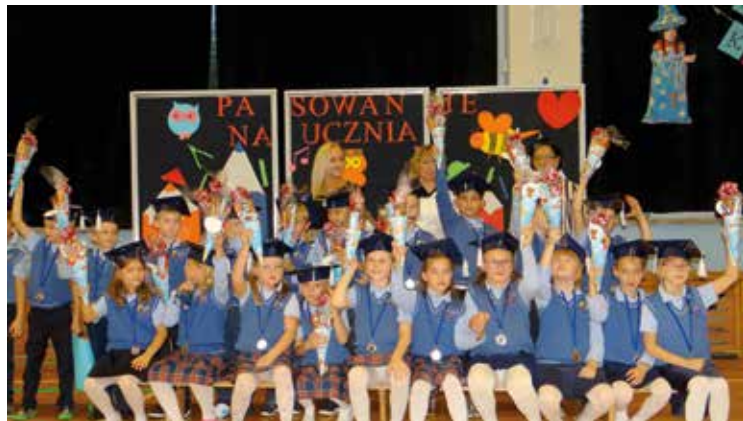
Już pełnoprawni uczniowie bielańskiej szkoły

modzielnie korzystać z szatni i toalety, znają zasady bezpiecznego poruszania się po drogach oraz wykazują się pomysłowością i inwencją twórczą podczas wykonywania prac plastyczno-technicznych. W trakcie uroczystości uczniowie