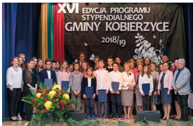
Uzdolnionej młodzieży w Gminie Kobierzyce nie brakuje