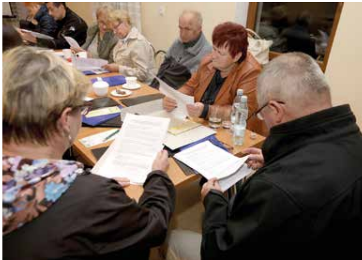
W warsztatach uczestniczyło ok. 20 mieszkańców Gminy Kobierzycy