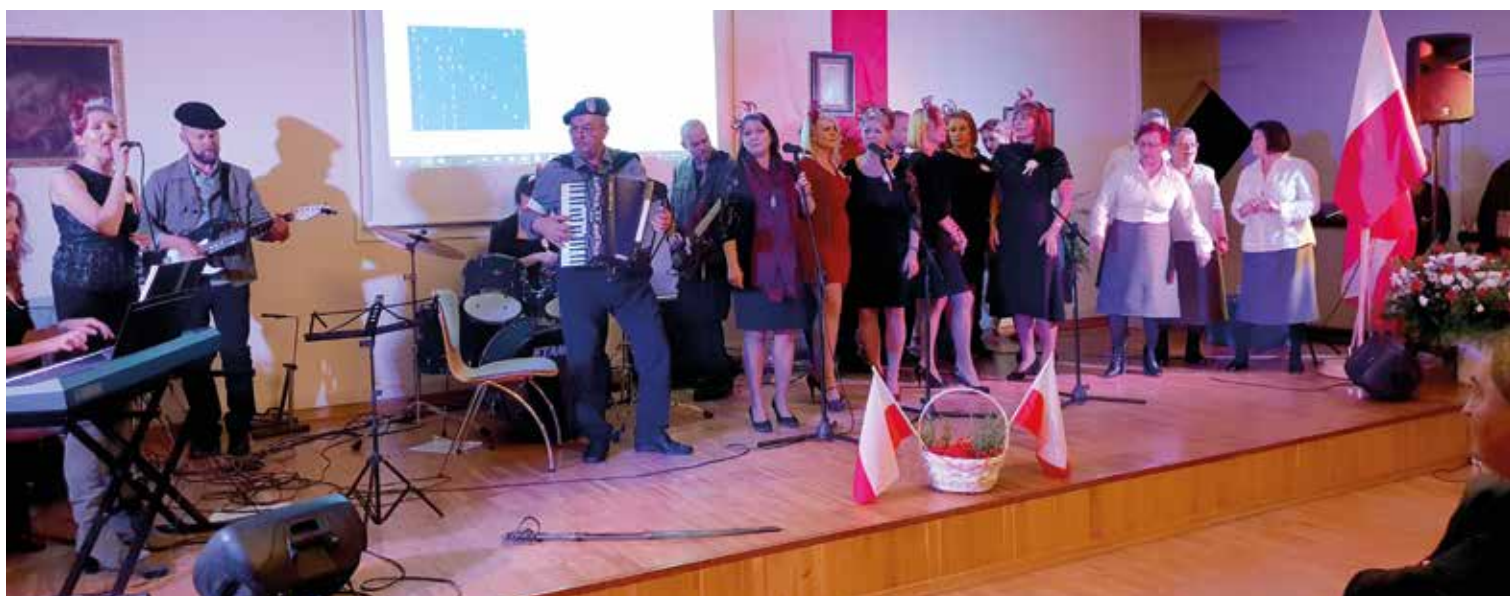
Występ finałowy zespołu ze szkoły z Wysokiej i grupy sołtysów