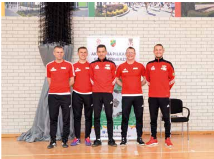
Trenerzy Akademii Piłkarskiej Gminy Kobierzyce

dych Orłów, programu realizowanego przez PZPN). Adeptci Akademii zostali wyposażeni w nowe stroje piłkarskie, tak aby mogli trenować w różnych warunkach atmosferycznych.