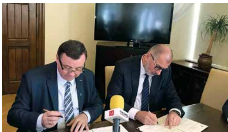
Uroczysty moment złożenia podpisów