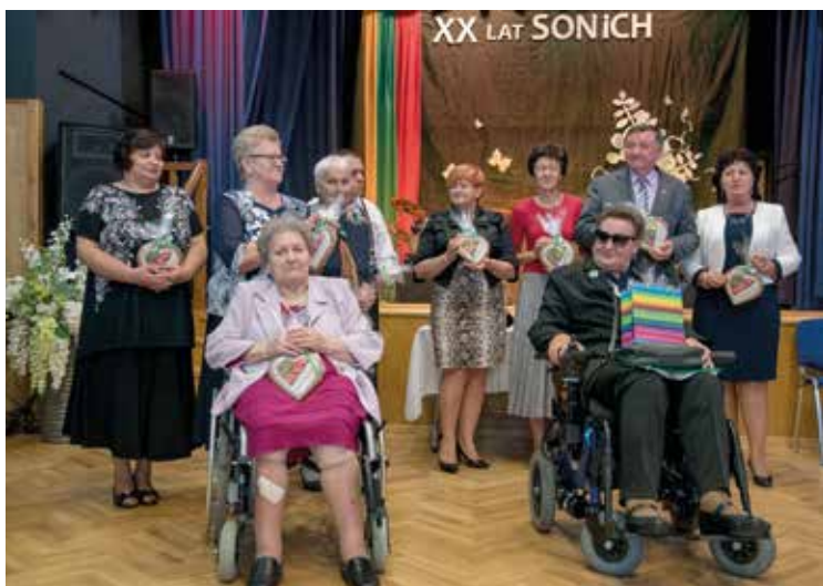
SONiCH ma 20 lat!