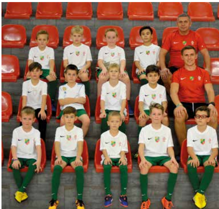
Czy pójdą w ślady Roberta Lewandowskiego?

sportowych KOSIR został zapewniony nieodpłatny transport na zajęcia. Program szkoleniowy Akademii Piłkarskiej Gminy Kobierzyce realizowany jest na bazie AMO (Akademii Piłkarskiej Mł-