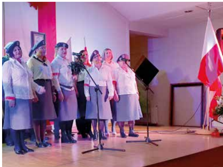
Występ zespołu sołtysów