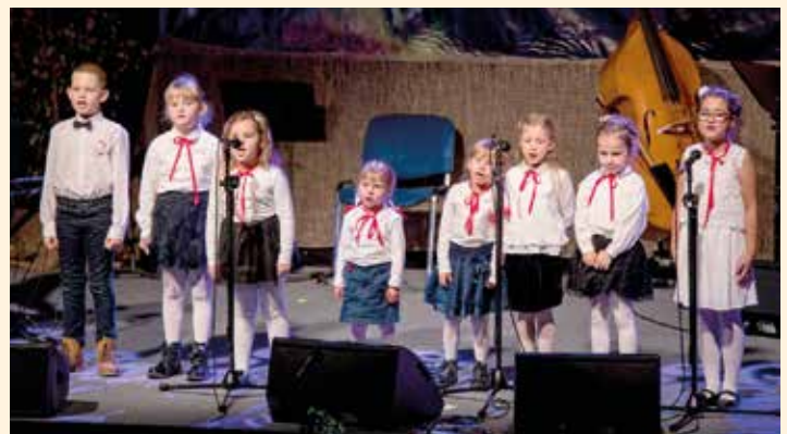
Zespół dziecięcy Jagódki