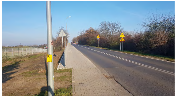
Remont wiaduktu nad autostradą w Ślezie

Projektowany jest odcinek chodnika pomiędzy Żernikami Małymi a Raclawicami Wielkimi; wykonano szczegółową koncepcję, w ramach zadania przewiduje się wykonanie odwodnienia drogi; planowane jest pozyskanie pozwolenia wodnoprawnego, którego czas uzyskania wynosi