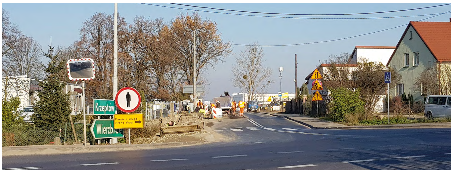
Odtwarzanie nawierzchni drogowej w Małuszowie