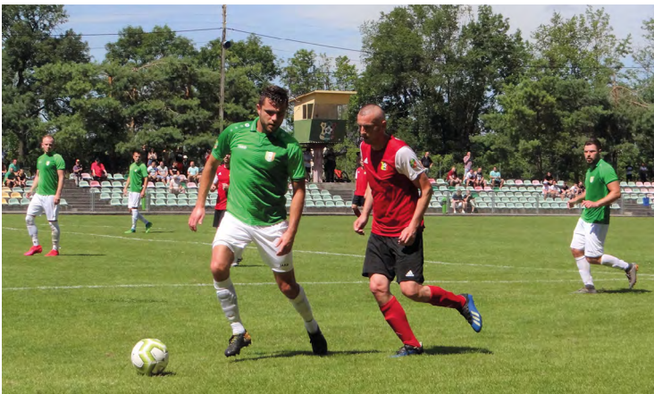
Fragmenty meczu GKS Kobierzycy – WKS Wierzbice