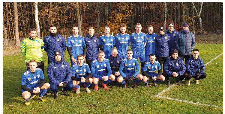
Benjaminek ligi okręgowej Galakticos Solna

Niemal połowa grupy (5 z 11) to zespoły z naszej gminy. Liczymy, że któryś z nich włączy się do walki o awans.