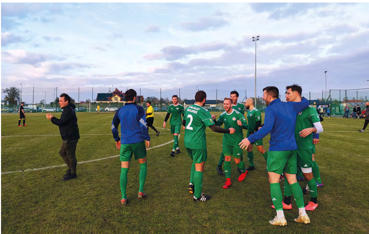
Polonia Bielany Wrocławskie liderem gry w klasie A

Nie kryjący IV ligowych aspiracji WKS Wierzbice walczy o dłuższe zadomowienie się w czołówce rywalizujących o IV ligę zespołów. Drużyny Galakticos i GKS umocniły się w środkowo-górnej części ligowej tabeli.