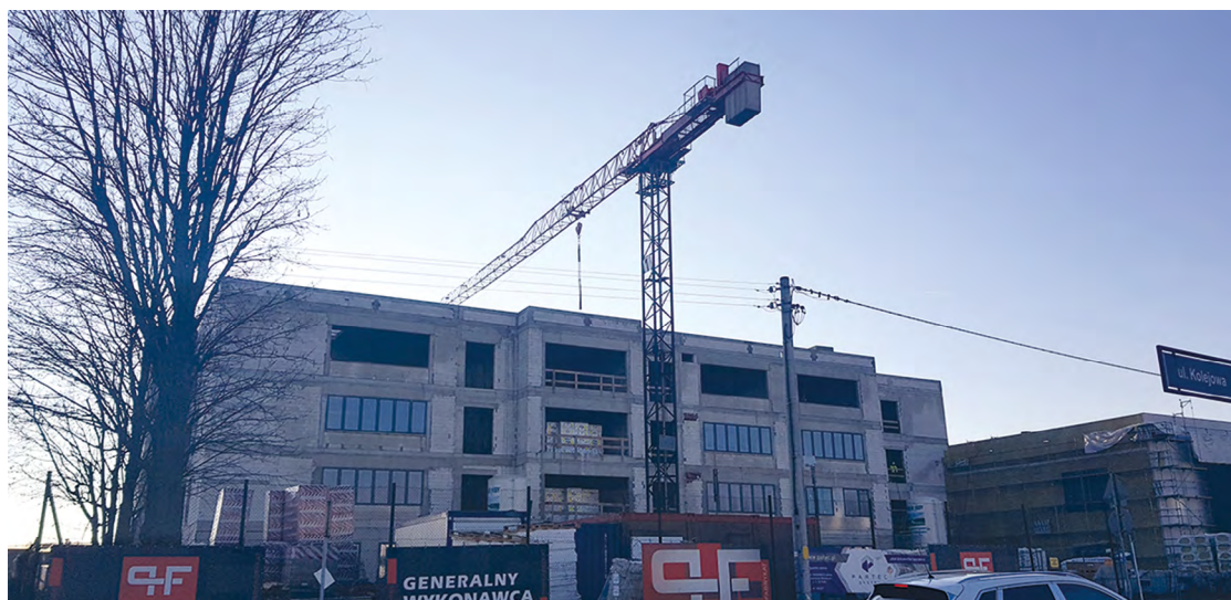
Budowa nowego budynku szkolnego w Bielanych Wrocławskich

BIELANY WROCŁAWSKIE – prowadzona jest budowa nowego budynku szkoły, zrealizowano roboty murowe ostatniej, czyli IV kondygnacji, trwa montaż stropodachu; wykonywany jest montaż stolarki, wykonywane są tynki i posadzki;