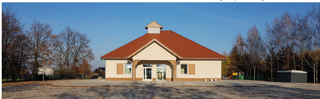
Świetlica w Księginicach