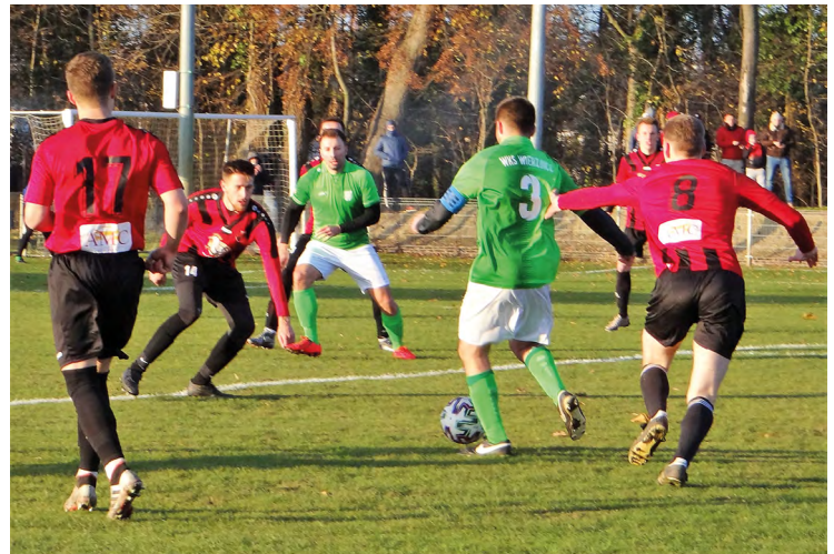
Fragment meczu WKS Wierzbice