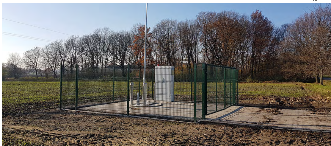
Pompownia w Raclawicach Wielkich