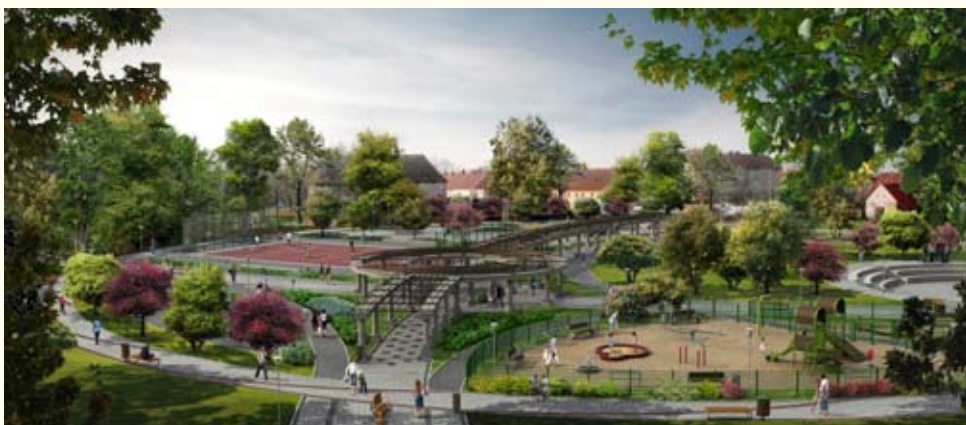
Arkalandia - fragment wizualizacji obiektu sportowo-rekreacyjnego przy osiedlu Arkadia w Bielanych Wrocławskich