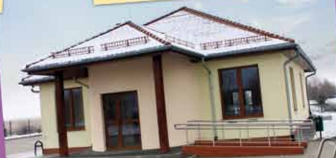
Świetlica wiejska w Owsiance