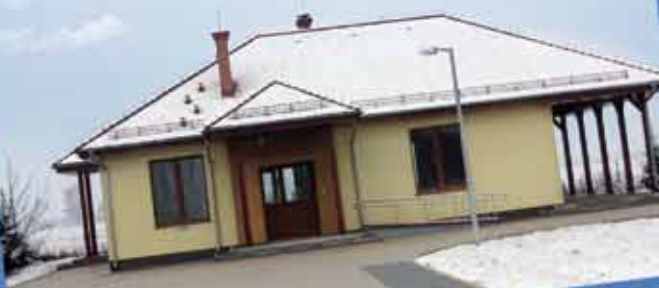
Świetlica wiejska w Szczepankowicach