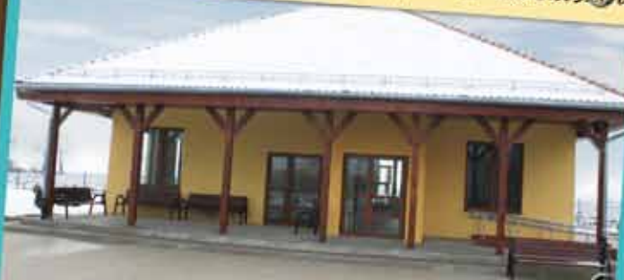
Świetlica wiejska w Magnicach