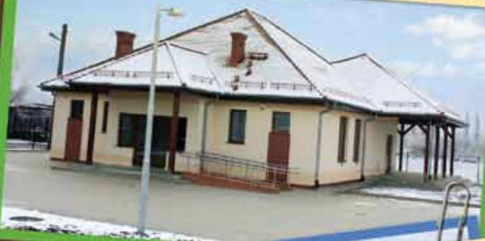
Świetlica wiejska w Damianowicach