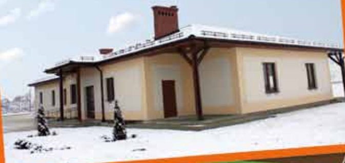
Świetlica wiejska w Budziszowie