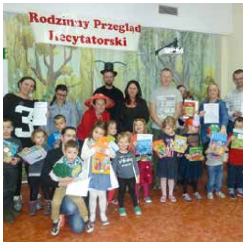
Występy artystyczne bardzo się podobały