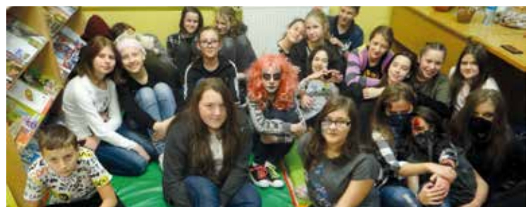
Gimnazjaliści z Bielanych Wrocławskich po nocy pełnej wrażeń