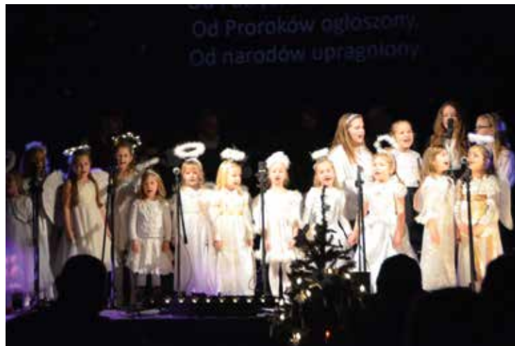
„Różyczki” i „Jagódki” śpiewają kolędy