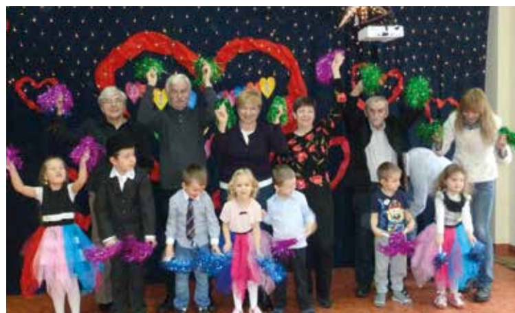
Ach co to były za występy!

„Dwudziestolatki”, „Umówiłem się z nią na 9”, „Wesołe jest życie staruszka”. Na zakoń-