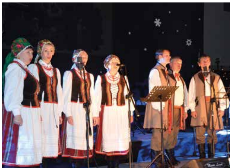
Kolęduje chór „Kresowiaczy” z Lidy na Białorusi