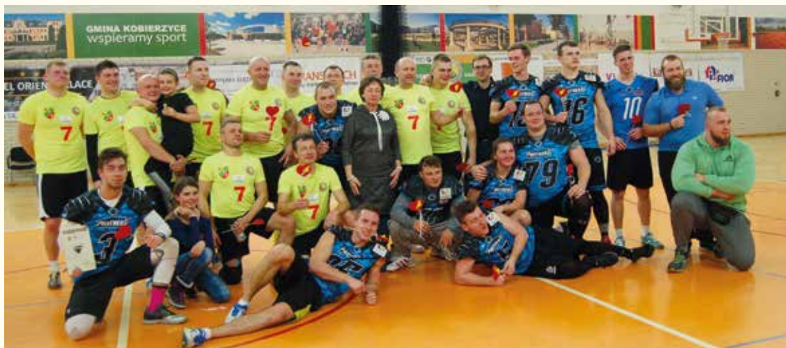
Przyjaciele KPR Kobierzyce z Panthers Wrocław