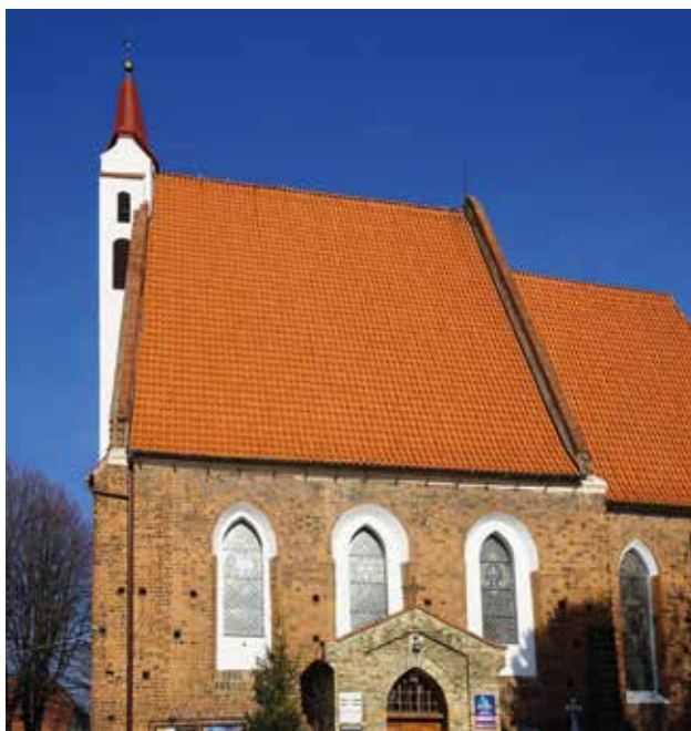
Odrestaurowana i pomalowana wieża kościoła parafialnego w Wierzbicach