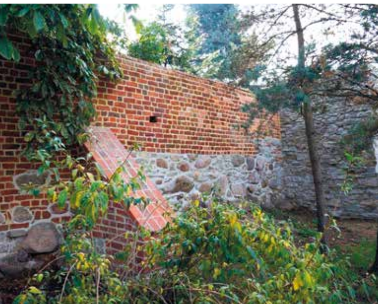
Domasław – mur wokół kościoła (po pracach remontowo-konserwatorskich)

• Rzymskokatolicka Parafia pw. Bożego Ciała i Matki Boskiej Częstochowskiej w Wierzbicach (na podstawie Uchwały Nr XVII/283/16 Rady Gminy Kobierzyce z dnia 23 czerwca 2016 r.) prace remontowo-konserwatorskie wieży kościoła pw. Bożego Ciała i Matki Boskiej Czę-