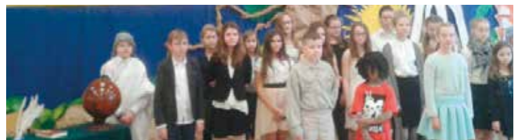
Młodzi artyści po przedstawieniu