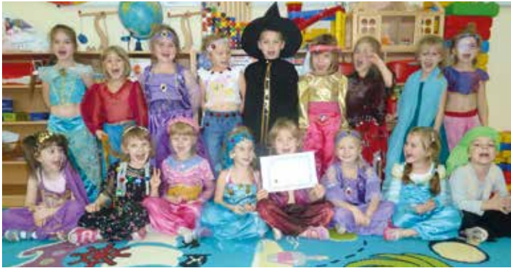
Przedszkolaki z Kobierzyc z dumą prezentują certyfikat

W ubiegłym roku szkolnym Przedszkole w Kobierzycach przystąpiło do realizacji Ogólnopolskiego Programu „Dziecięca Kraina Kreatywności”. Celem programu jest rozwijanie kreatywności u dzieci, jak i dorosłych, poszukiwanie nowych pomysłów i rozwiązań, a przede wszystkim kreatywna zabawa i działania.