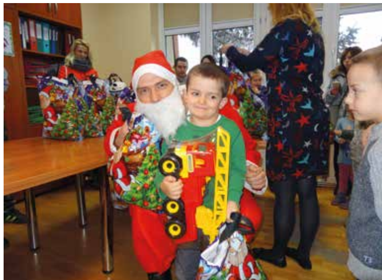
Św. Mikołaj spełnia dziecięce marzenia