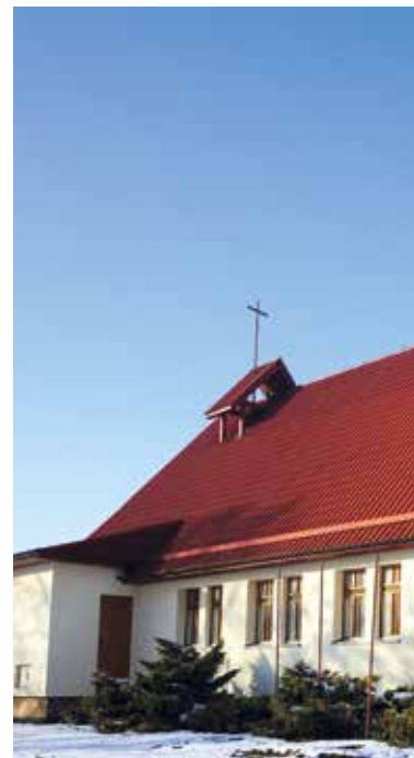
Nowy dzwon kościelny w Pustkowie Żurawskim

z dnia 30 września 2016 r.) wykonanie renowacji wieży Kościoła pw. Św. Wojciecha, Biskupa i Męczennika w Domasławiu – kwota dotacji: 20 000,00 zł.