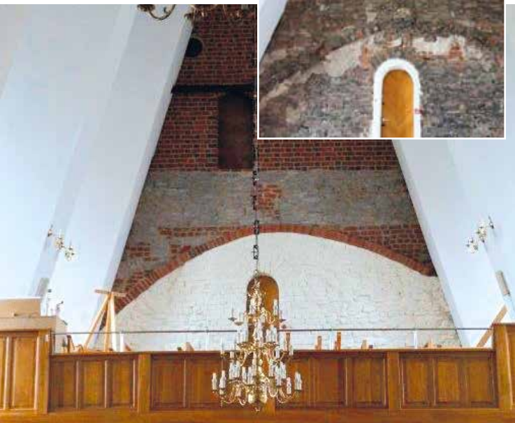
Wnętrze wieży kościoła w Domasławiu (przed i po renowacji)

• Rzymskokatolicka Parafia pw. Św. Wojciecha, Biskupa i Męczennika w Domasławiu (na podstawie Uchwały Nr XVII/282/16 Rady Gminy Kobierzyce z dnia 23 czerwca 2016 r.) prace remontowo-konserwatorskie muru wokół kościoła – etap kolejny, dla zachowania i utrwalenia substancji zabytku – kwota dotacji: 20 000,00 zł