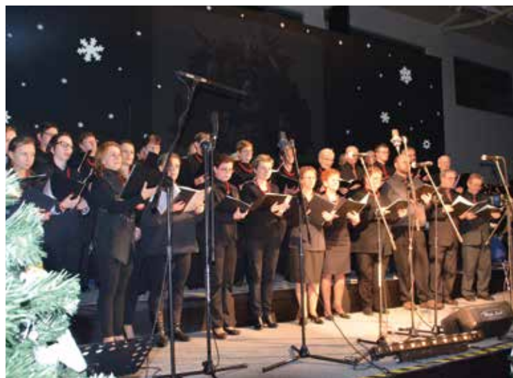
Występ chóru z czeskich Koberic