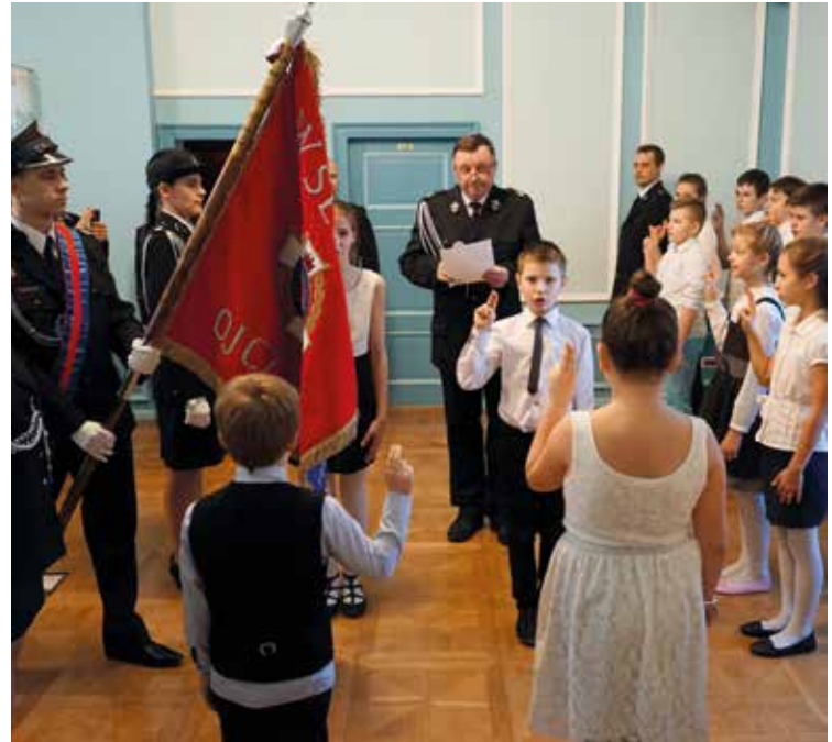
Uroczysty moment ślubowania