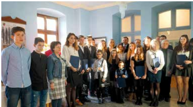
Utalentowani młodzi sportowcy Gminy Kobierzycy