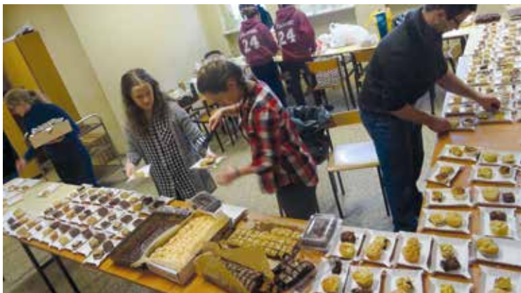
Wolontariusze z Bielanych Wrocławskich przygotowują posiłki

aby w ten sposób budować autentyczną więź z najbardziej potrzebującymi. Oprócz wspólnej modlitwy, kolędowania i rozmów przy stole, uczestnicy spotkania mogli wysłuchać katechezy ks. Wło-