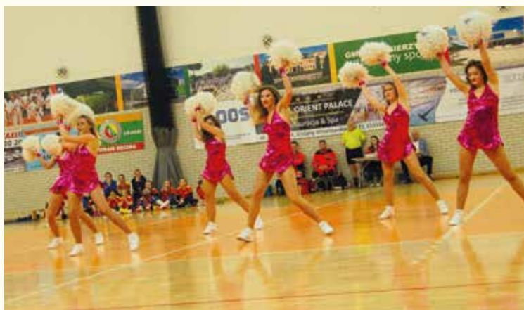
Cheerleaders Wrocław zatańczą też przed meczem NBA!