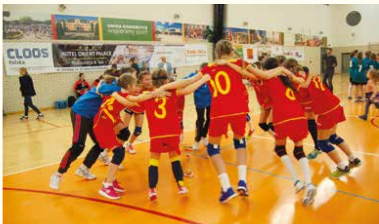
Radość po zwycięstwie