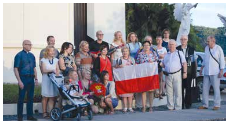
Uczestnicy pielgrzymki nie narzekali na pogodę

żeglarzy” w Regla, gdzie uczestniczyliśmy we Mszy Św. sprawowanej przez naszych kapłanów. Jednym z piękniejszych miast na Kubie, które mieliśmy okazję zobaczyć był Trinidad – perełka kolonialnej Kuby – miasto niezwykle kolorowe, gwarne, niepowtarzalne, chętnie odwiedzane przez turystów, gdzie również z wielu miejsc dobiegała muzyka wykonywana przez miejscowych artystów. My również – pielgrzymi z Polski zaznaczyliśmy swoją obecność poprzez śpiew w kościołach, na placach i ulicach, co zawsze spotykało się z dużą sympatią mieszkańców. Będąc na Kubie mieliśmy możliwość poznać proces powstawania narodowych produktów tego kraju, a więc cygar (byliśmy w fabryce cygar w Dolinie Tytoniowej Vinales), a także odwiedziliśmy wytwórnię rumu w Santiago de Cuba. Byliśmy też w miejscowości Biran- rodzinnym mieście zmarłego niedawno Fidela Castro. Mieliśmy także okazję być w domu kolejnej znanej postaci związanej ściśle z tym krajem, odwiedziliśmy dom i posiadłość Ernesta Hemingway’a, gdzie spędził wiele lat swego życia i gdzie napisał większość swoich