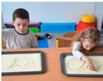
Zajęcia dla dzieci zwiększające ich kreatywność