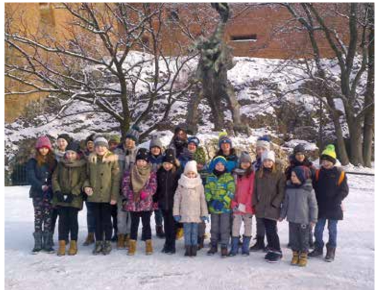
Pogoda dopisała – zimowisko było udane