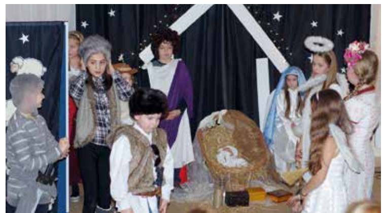
Jasełka bardzo się podobały

6 stycznia do Szczepankowicz zawitali Trzej Królowie. Przyniesli ze sobą dary dla Dzieciątka, by uczcić jego narodziny. Po drodze musieli jednak wygrać wyścig z pasterkami, ponieważ każdy chciał być pierwszy. Niezawisły sędzia (zdaje się anioł) odmówił podania werdyktu próbując zweryfikować trzeźwość powyższych (cyt. „czyście się szaleju tu opili?”). Sprawy nie udało się rozwikłać. Niemniej zagrożenie czyhało w okolicy wiejcej – oto specjalnie wyszkoleni pasterze – nie mylić z pastuchami – zaareztowali terrorystę nasłanego przez Heroda do zglądzenia nowonarodzonego Jezusa. Na