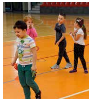
Rywalizacja sportowa na wesolo

Kobierzycki Ośrodek Sportu i Rekreacji organizował w tym roku zajęcia sportowe na czas ferii zimowych. Przygotowaliśmy dla dzieci różne zajęcia sportowe, gry i zabawy zespołowe m.in. piłka nożna, koszykówka, piłka ręczna, wyścigi rzędów, dwa ognie, gra w kółko i krzyżyk, zamek dmuchany. Tak bogata oferta zajęć powstała, aby zapewnić najmłodszym jak najwięcej ruchu, uśmiechu i zabawy. Dzieci poznawały różne konkurencje i techniki sportowe. Zaczynaliśmy o godzinie 9:30 do 11:30 zajęciami dla wszystkich przedszkoli z terenu Gminy Kobierzyce, a w godzinach od 12 do 14 odbywały się zajęcia otwarte dla dzieci z gminnych miejscowości. Nasza zimowa propozycja miała otwartą formułę, a zajęcia były nieodpłatne, więc Halę Sportowo-Widowiskową w Kobierzycach odwiedzało codziennie około 100 dzieci.