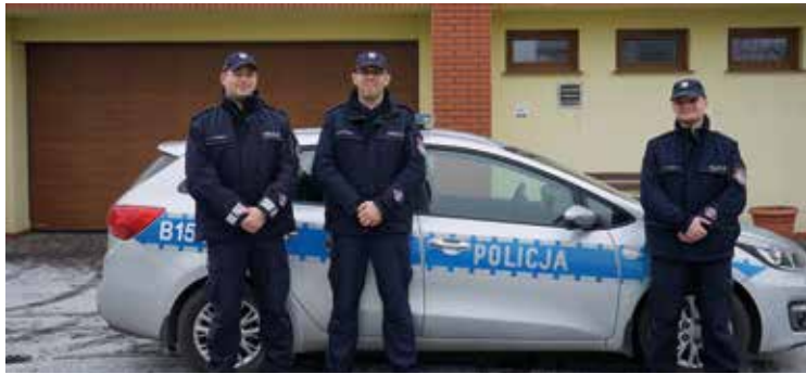
Policjanci przed posterunkiem w Kobierzycach