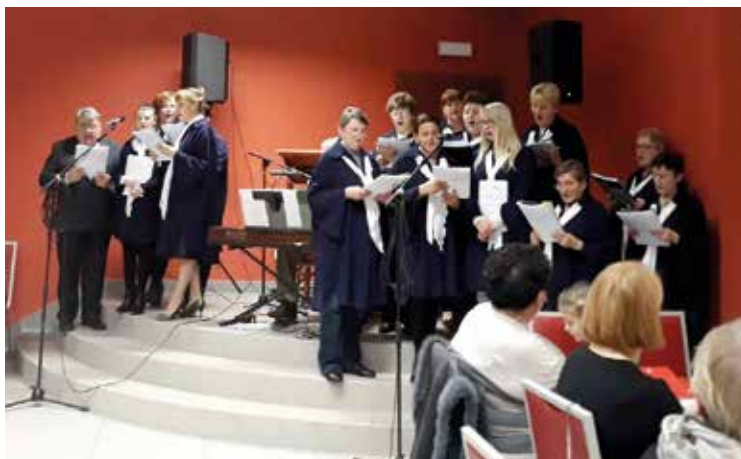
Kolędy śpiewał chór kościelny z Tyńca nad Ślężą