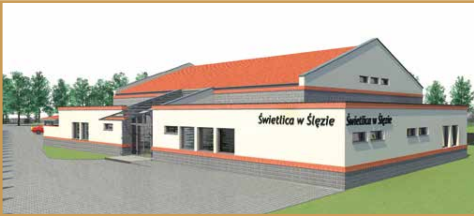
Wizualizacja świetlicy w Ślęzie

Wszystko wskazuje na to, że już w przyszłym roku trzeba będzie szukać bardzo poważnych powodów, żeby usprawiedliwić się przed samym sobą, że nie korzystamy z możliwości aktywnego spędzania wolnego czasu, jakie mamy wokół siebie. Na szczęście grupa osób, która potrafi zorganizować sobie ciekawie wypoczynek wciąż rośnie i istnieje duża szansa, że będzie zarażać swoimi pasjami kolejnych sąsiadów. Oby jak najszybciej.