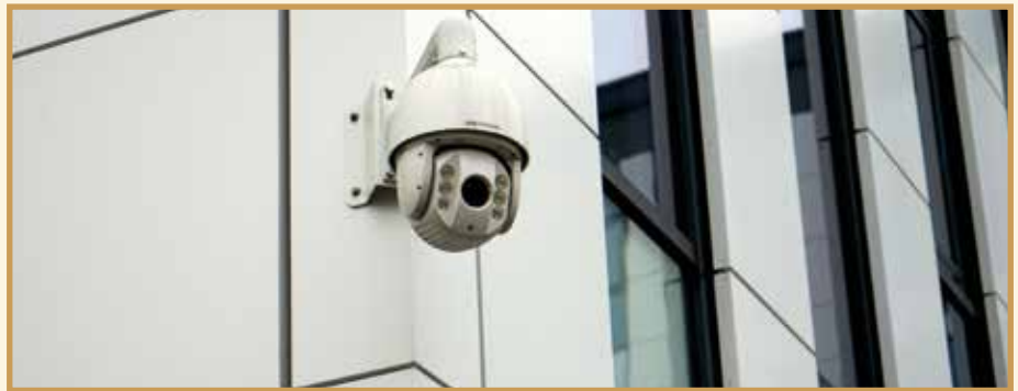
Monitoring wpływa na poprawę poczucia bezpieczeństwa mieszkańców

Na koniec chcielibyśmy przypomnieć mieszkańcom o funkcjonującym już na terenie naszej Gminy numerze alarmowym 607 727 748.