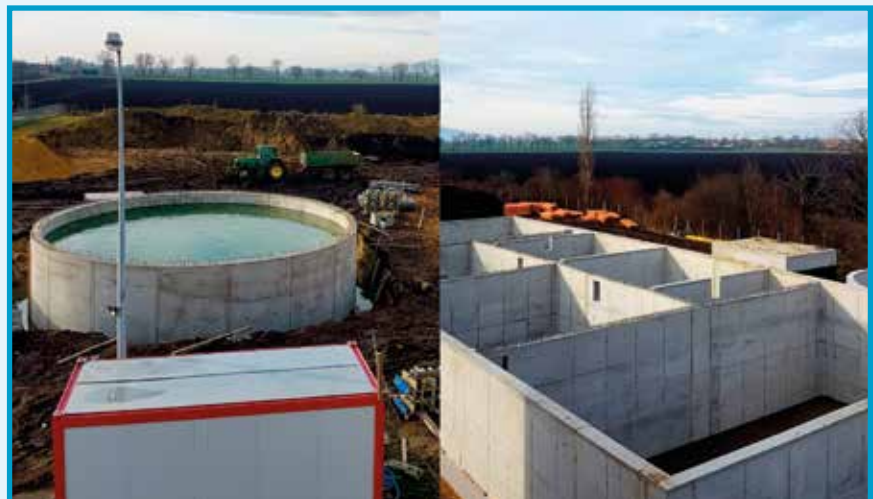
Oczyszczalnia ścieków w Kobierzycach to integralna część projektu budowy kanalizacji

Miejmy nadzieję, że inwestycja będzie przebiegać sprawnie i bez większych zawirowań, o co przy jej rozmiarze nietrudno. Przez najbliższe miesiące będziemy się starali wyczerpująco informować Państwa o przebiegu prac.