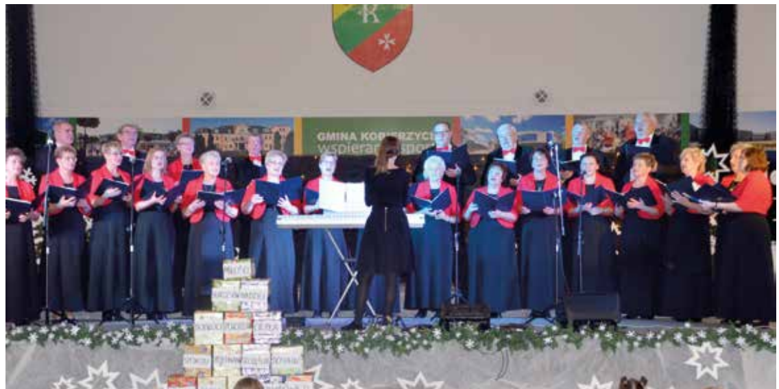
Występ chóru „Diament”