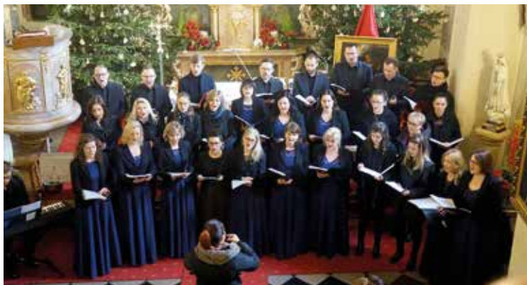
Występ chóru Sanctus Andreus w bielańskim kościele