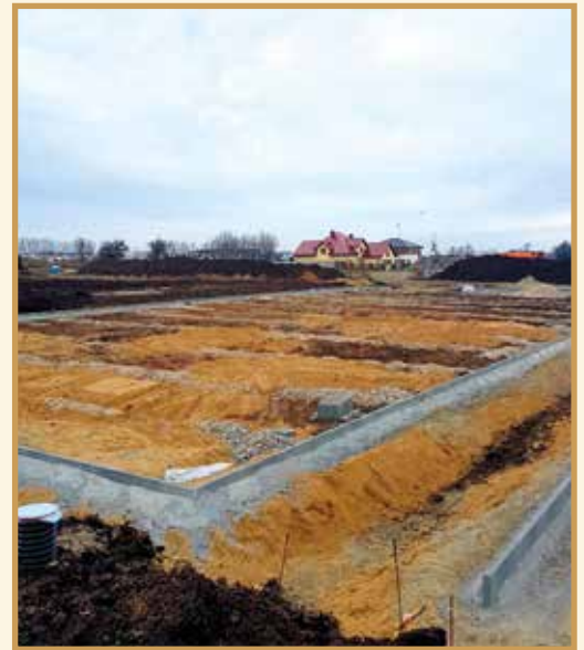
Budowa obiektów sportowych w Ślęzie nabiera tempa

Rozpoczęła się też budowa nowego ośrodka sportowego na granicy Ślęzy i Bielani Wrocławskich. Ponieważ ma służyć mieszkańcom obu tych miejscowości, roboczo nazywany jest Ślęzańsko-Bielañskim Ośrodkiem Sportowym. Nie wiemy