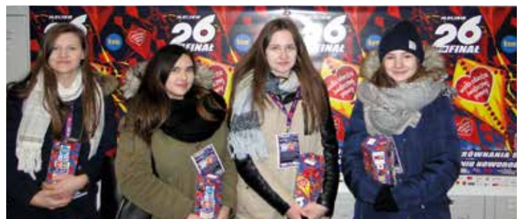
Wolontariuszki WOŚP z Pustkowa Żurawskiego