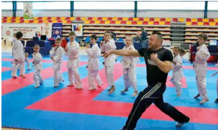
Młodzi karatecy z Wysokiej w trakcie treningu