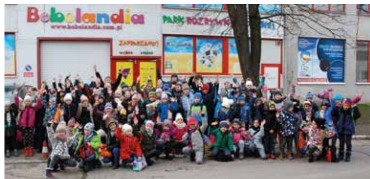
Uczestnicy ferii bawili się w Bobolandii