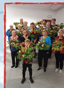
Tyniec nad Ślązą