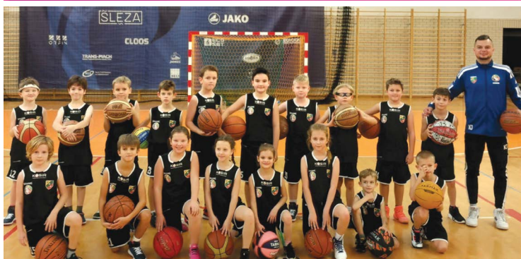
BASKET KOSiR KOBIERZYCE