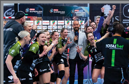
Piłkarki KPR Gminy Kobierzyce na 2. miejscu w Orlen Superlidze / str. 12