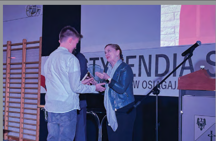
Gala Sportu / str. 3