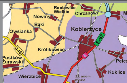
Wykaz okręgów wyborczych / str. 6-7