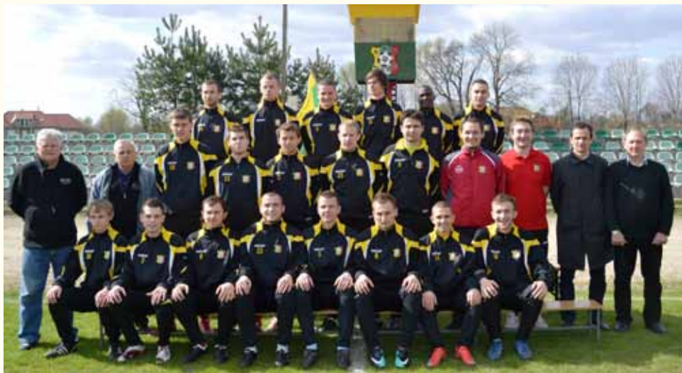
GKS Kobierzyce