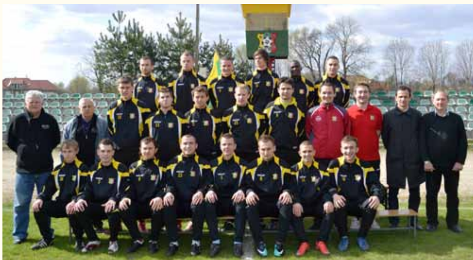
GKS Kobierzyce