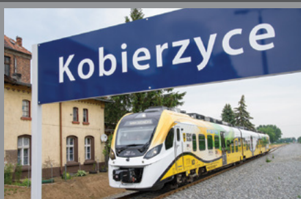
Pociąg do Kobierzyc / str. 3