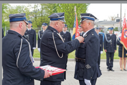
Uroczystości OSP w Pustkowie Żurawskim / str. 5