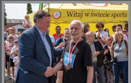
VI Kobierzycy Bieg z Konstytucją / str. 11