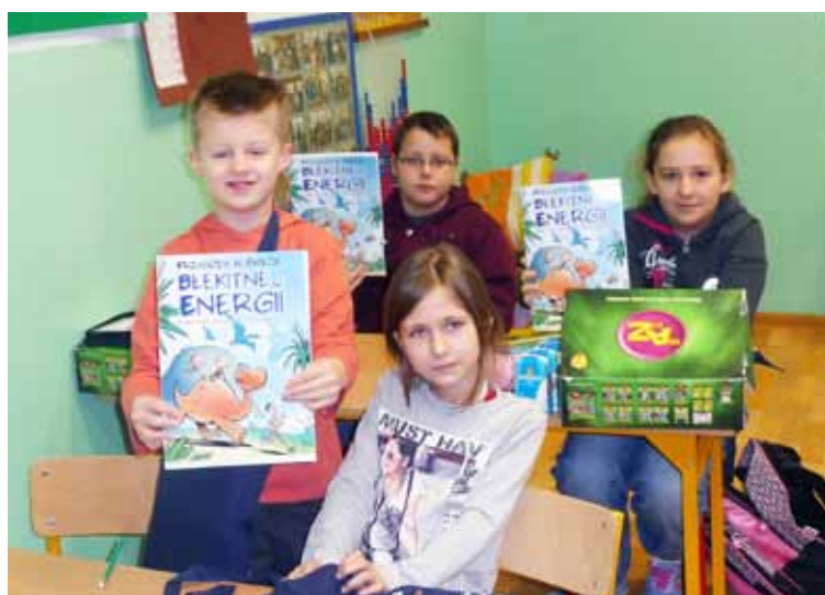
Uczniowie Szkoły Podstawowej w Tyńcu Małym