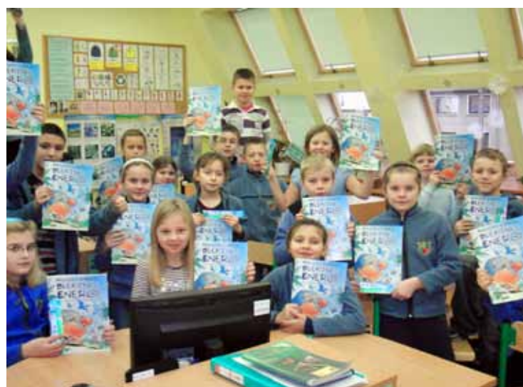
Uczniowie Szkoły Podstawowej w Kobierzycach