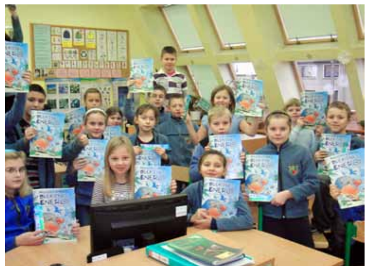
Uczniowie Szkoły Podstawowej w Kobierzycach