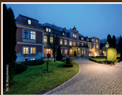
Trzy pytania do... Wójta Gminy Kobierzyce