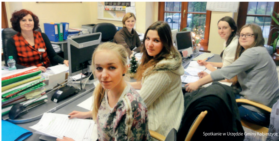
Spotkanie w Urzędzie Gminy Kobierzyce

Celem tego konkursu jest rozpowszechnienie wiedzy na temat zmian klimatycznych i metod przeciwdziałania tym zmianom oraz poszerzenie świadomości społecznej w dziedzinie ekologii. W ramach zadań, które podejmują uczniowie jest doskonalenie współpracy ze społecznością szkolną i lokalną, zgłębianie wiedzy na temat klimatu, poznawanie form jego ochrony oraz poznanie zasad przeprowadzania akcji społeczno-promocyjnej zbiórki elektroodpadów w swoim regionie. Dzięki udziałowi w takim konkursie uczniowie zdobywają wiedzę i nowe doświadczenia oraz kształcą swoje umiejętności społeczne. Dzięki