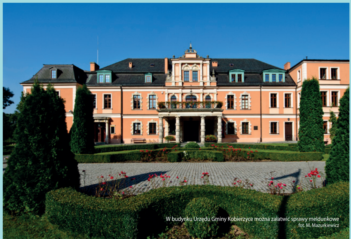
W budynku Urzędu Gminy Kobierzyce można załatwić sprawy meldunkowe