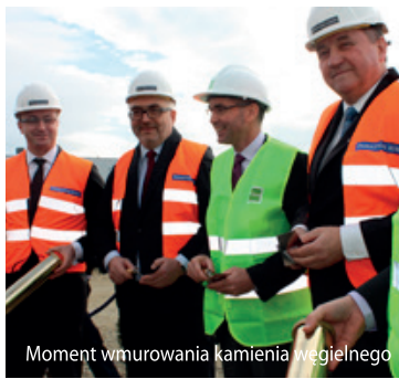
Moment wmurowania kamienia węgielnego

„Z ogromną radością rozpoczynamy inwestycję w Polsce. Ten dzień wyznacza początek długotrwałych relacji pomiędzy