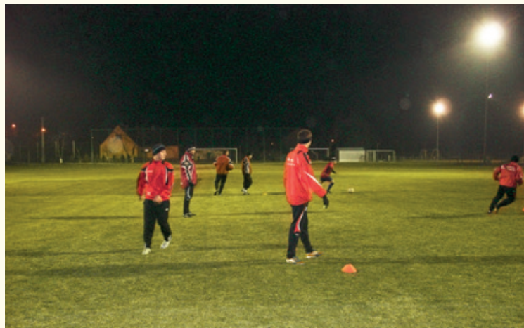
Trening piłkarzy Polonii Jaszowice