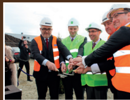
Amazon - wmurowanie kamienia węgielnego