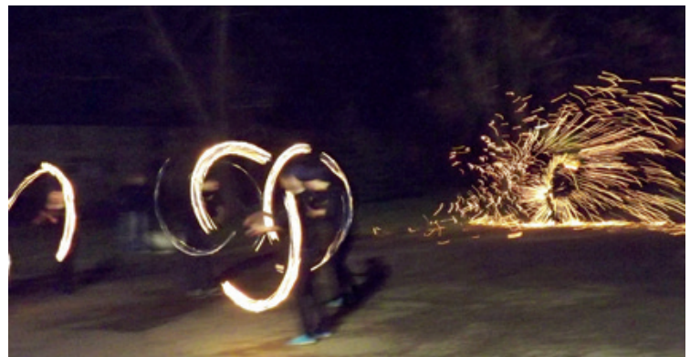
Fragment pokazu w Krzyżowicach

Już drugi raz sympatyczna grupa Bombastic z Bukowca gościła w Krzyżowicach w ramach wdrażania Projektu Modelowego Teatr Ognia, który powstał w PZS Nr 1 w Krzyżowicach w Ogólnopolskim Programie „Równać Szanse”. Nasi goście zaprezentowali swoje umiejętności baletowe i udowodnili, że od ostatniej wizyty poczynili znaczne postępy. Pokaz bardzo