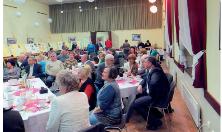
Spotkanie na wystawie