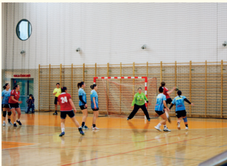
Fragment meczu KPR Kobierzyce - Polonia Kępno