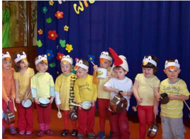
„Grające żabki” w wykonaniu przedszkolaków z Przedszkola Samorządowego w Bielanych Wrocławskich