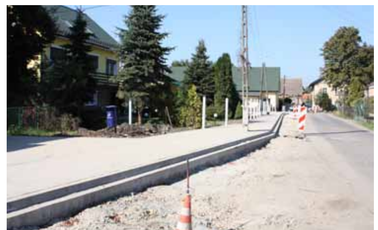
chodniki w Kuklicach