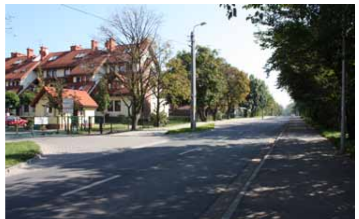
ul. Chabrowa w Wysokiej