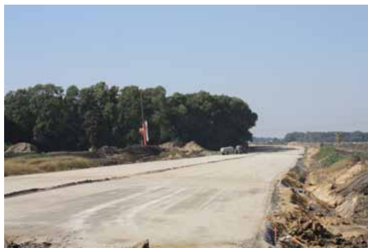
obwodnica Tyńca Małego