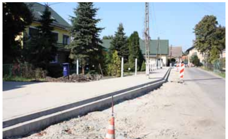
chodniki w Kuklicach