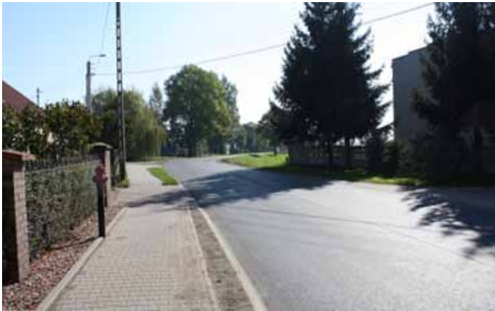
droga powiatowa w miejscowości Księginice