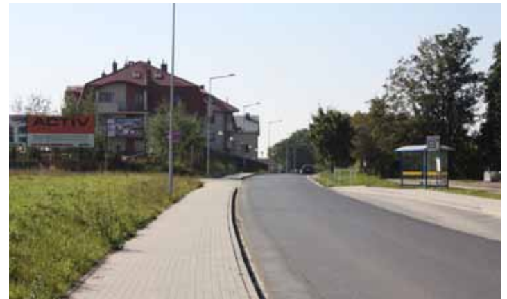
ul. Radosna w Wysokiej