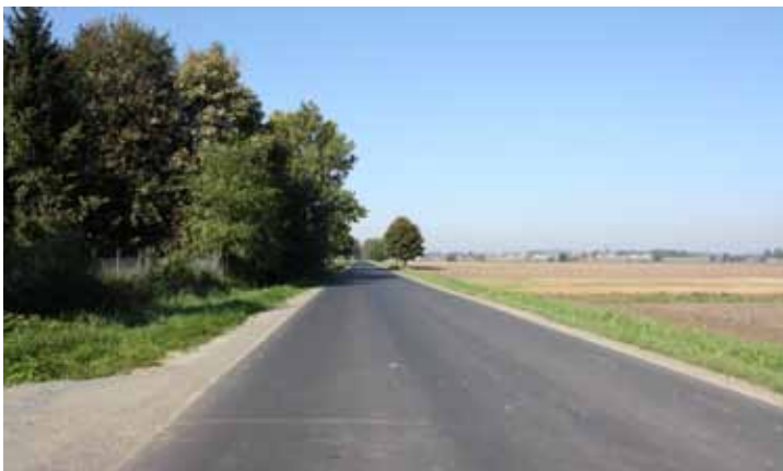
droga powiatowa w Księginicach