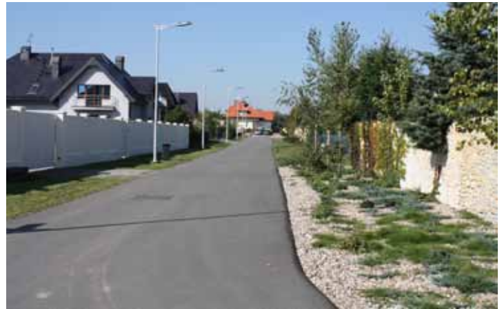
nakładki bitumiczne w Bielanych Wrocławskich