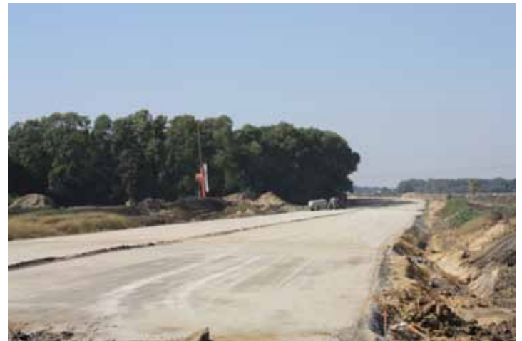
obwodnica Tyńca Małego