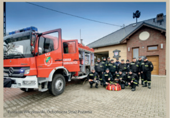
Pustków Wilczkowski, Ochotnicza Straż Pożarna