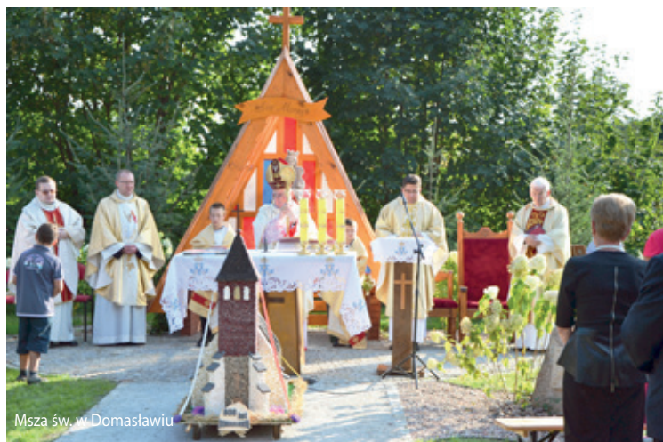
Msza św. w Domasławiu

Ten rok jest szczególnie dla mieszkańców Domasławia bowiem 6 września bardzo uroczysto obchodziliśmy 800-lecie naszej miejscowości połączone z dożynkami. Z tej okazji została wybudowana kapliczka Matki Boskiej z Dzieciątkiem Jezus, przy której odbyła się Msza św. Przewodniczył jej ks. Kardynał Henryk Gulbinowicz. Dalej część obchodów miała miejsce w parku, gdzie odbył się koncert orkiestry dętej Kobierzyce Band i występ zespołu „Aster” z Domaławia. Przybyli goście mogli spróbować pysznej grochówki, smalczyku oraz wspaniałych ciast upieczonych przez panie z Chrzanowa, Księginic i Domaławia. Nie brakowało atrakcji dla najmłodszych, były między innymi: dmuchańce,