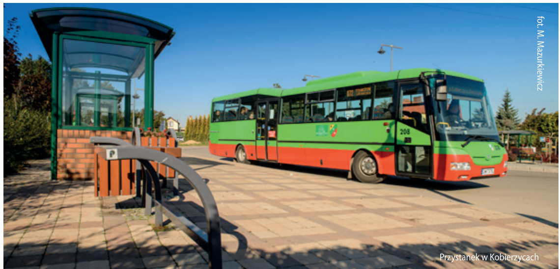
Przystanek w Kobierzycach