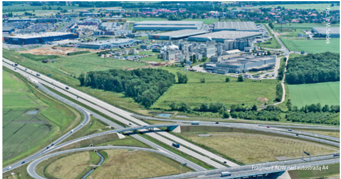
Fragment AOW nad autostradą A4