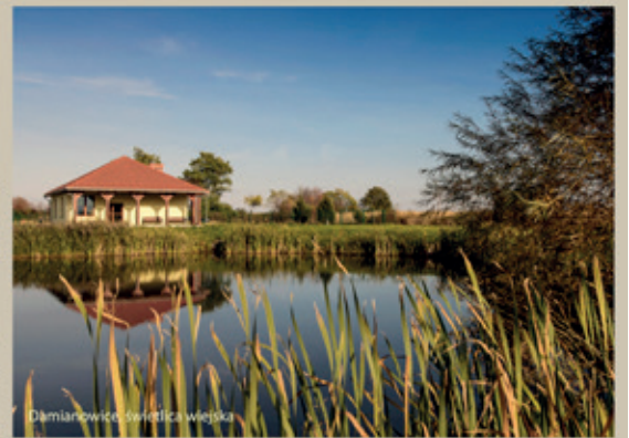
Damianowice, świetlica wiejska