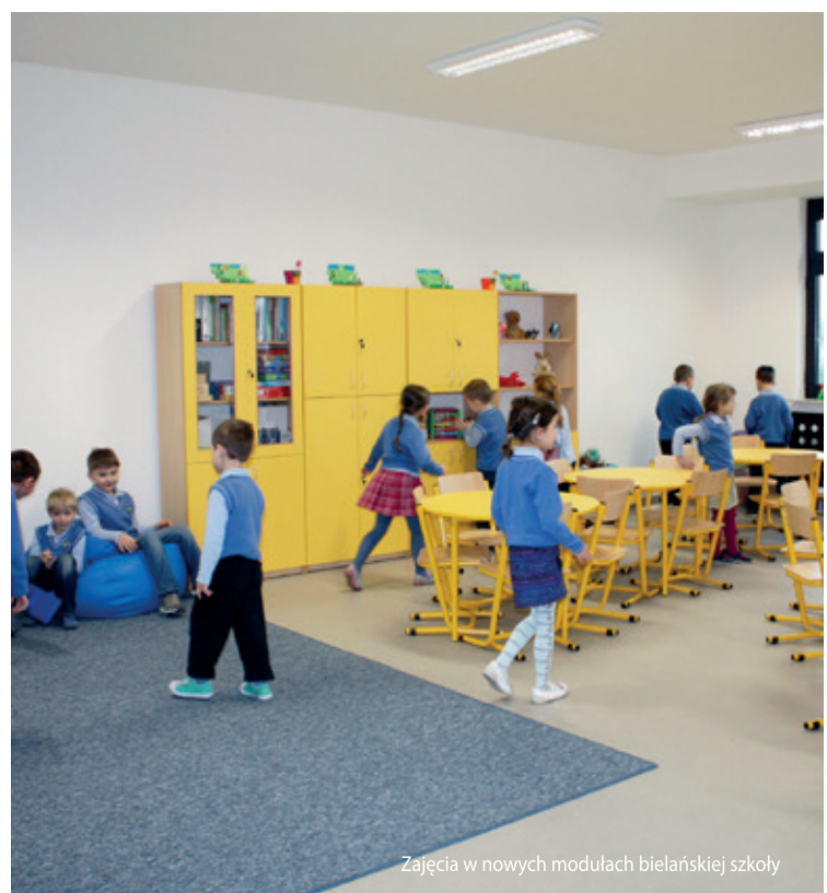
Zajęcia w nowych modułach bielańskiej szkoły