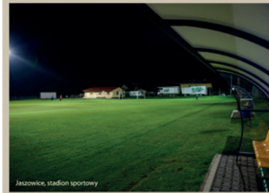
Jaszowice, stadion sportowy