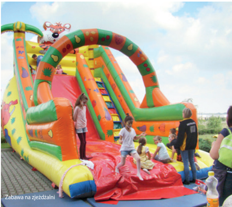
Zabawa na zjeźdźalni