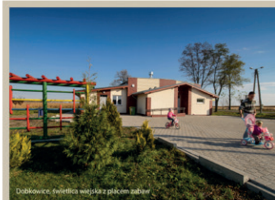
Dobkowice, świetlica wiejska z placem zabaw