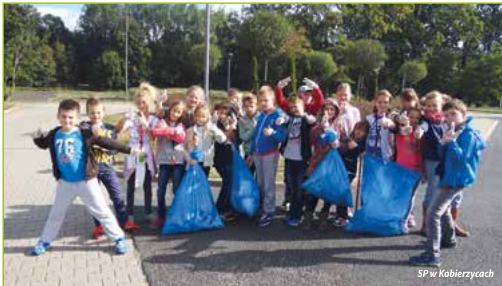
SP w Kobierzycach