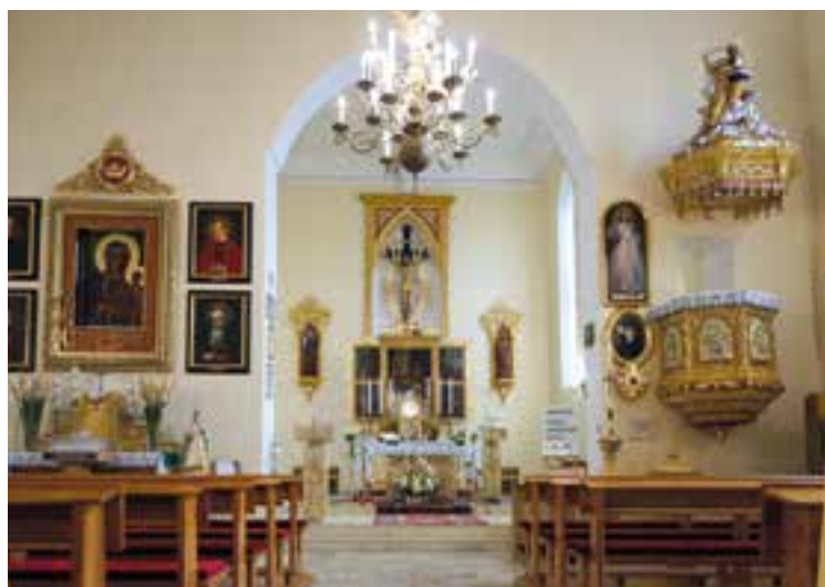
Wierzbice, kościół (wnętrze). Parafia p.w. Bożego Ciała i Najświętszej Maryi Panny Częstochowskiej

i obecność pozostawiłeś niezatarty ślad w naszym życiu. Przed dwoma tygodniami do niektórych z nas wysłałeś smsa, w którym był bardzo wymowny cytat: „Przez 25 lat ofiarowałem wam, drodzy, siebie i swe różne zdolności i dokonania. Dziś dedykuję chorobę, ołtarz cierpienia – też obraz miłości z atencją miłosiernego Chrystusa Zbawiciela ślę – pasterz waszych dusz nieśmiertelnych”. Drogi Druhu