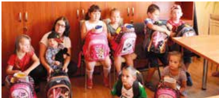
Tornistry bardzo się podobały!