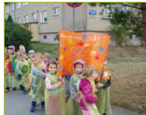
ZSP w Pustkowie Żurawskim