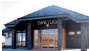
Świetlica w Cieszycach

Informujemy, że Gmina Kobierzyce zakończyła realizację projektu pn. „Budowa świetlicy wiejskiej w miejscowości Cieszycy”. Inwestycja została dofinansowana w ramach Programu Rozwoju Obszarów Wiejskich na lata 2007-2013 – Działanie 4.1/413 „Wdrażanie lokalnych strategii rozwoju” dla operacji, które odpowiadają warunkom przyznania pomocy w ramach działania „Odnowa i rozwój wsi”. Wartość operacji wyniosła 879 250,00 zł brutto, z czego kwota