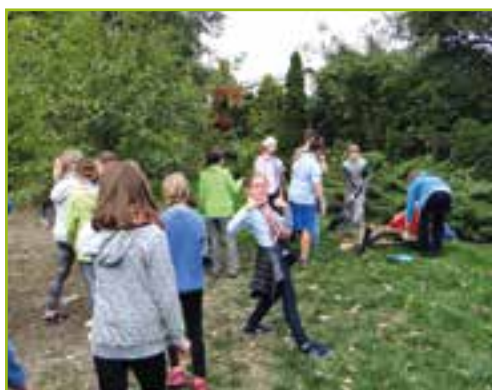
SP w Bielanych Wrocławskich