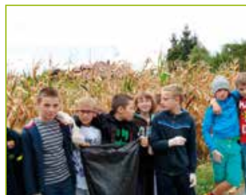
SP w Tyńcu Małym