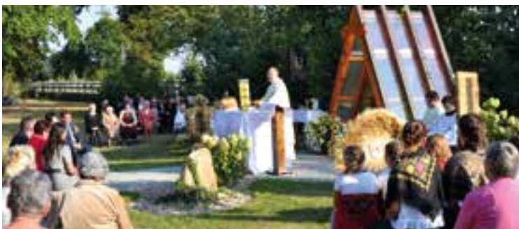
Fragment mszy św. plenerowej w Domasławiu

upieczonych przez nasze parafianki. Dla najmłodszych były dmuchańce - skakańce, malowanie buziek oraz liczne konkursy. Przy pięknej pogodzie, cateringu przygotowanym przez bar „Zyzio”, niemal do białego rana bawiliśmy się z zespołem „Krab”.