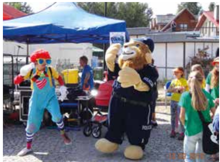
Wesoły clown i Komisarz Lew w akcji