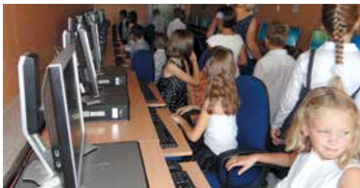
Przyszli informatycy przy komputerach