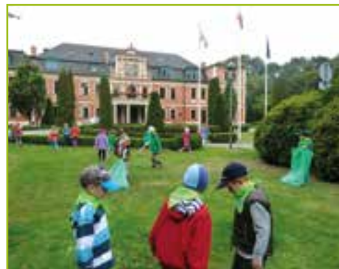
Przedszkole w Kobierzycach