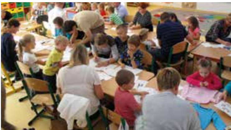
Zajęcia integracyjne z rodzicami