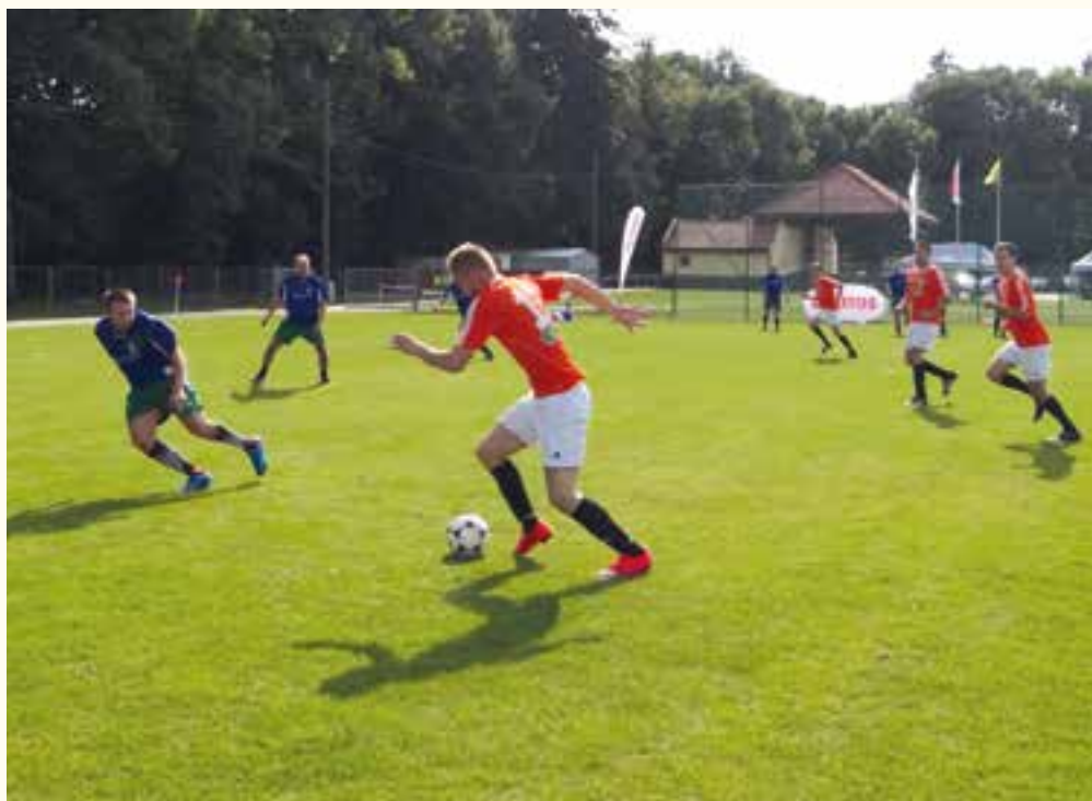
Emocji na boisku nie brakowało