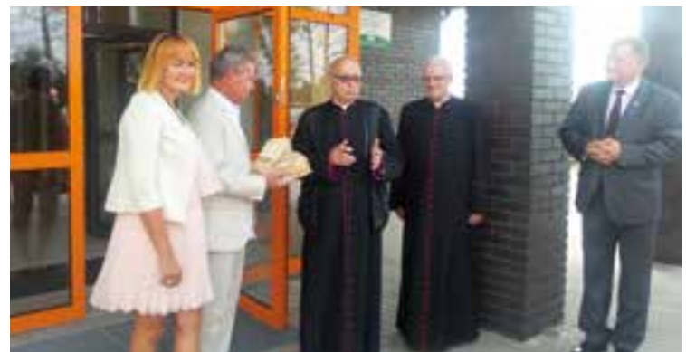
Powitanie przed świetlicą w Cieszcach