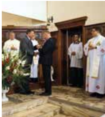
Fragment mszy św. w kobierzyckim kościele