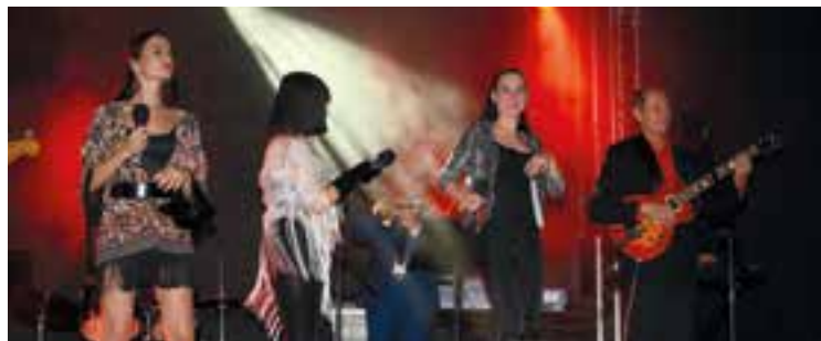
Tercet Egzotyczny na scenie