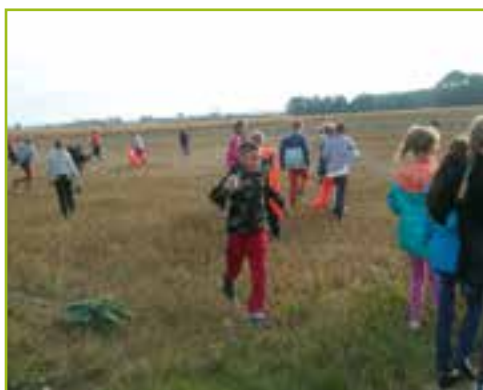
SP w Pustkowie Wilczkowskim