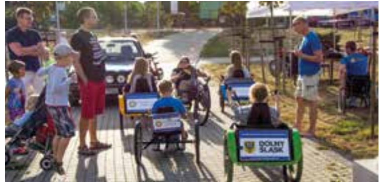
Chętnych do przejażdżki nie brakowało