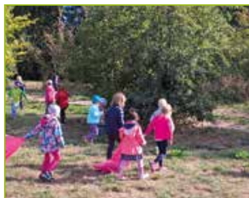
Przedszkole w Ślęzie