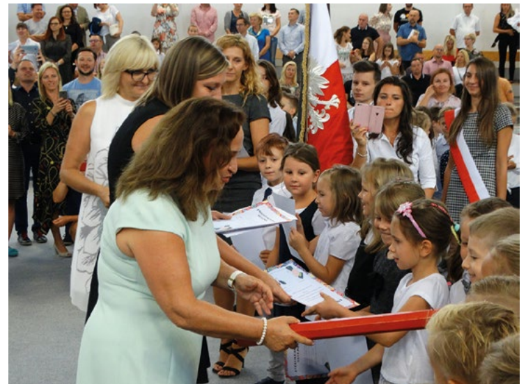
Pasowanie na ucznia w Tyńcu Małym