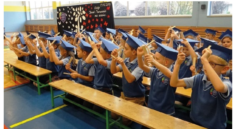
Pasowanie na ucznia w Bielanych Wrocławskich