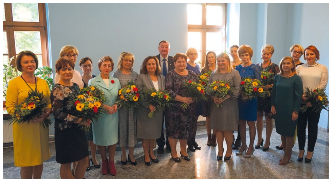
Nagrodzeni dyrektorzy i nauczyciele