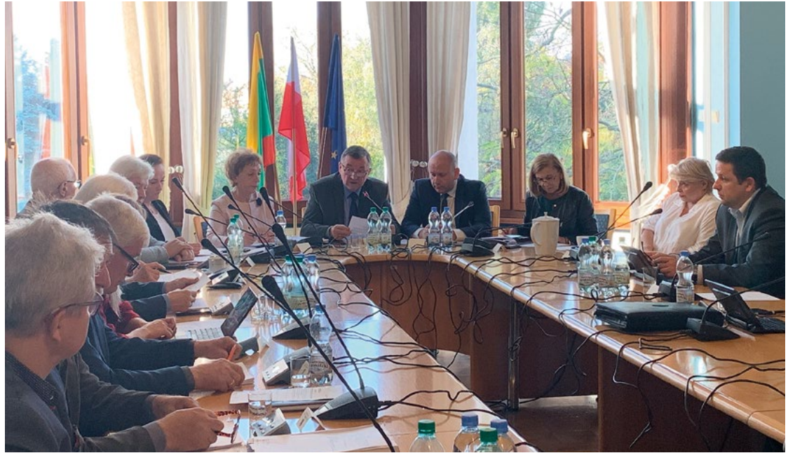
XII Sesja Rady Gminy Kobierzycy

Uczestnicy przemarszu idą prawą stroną jezdni. Za utrudnienia przepraszamy!