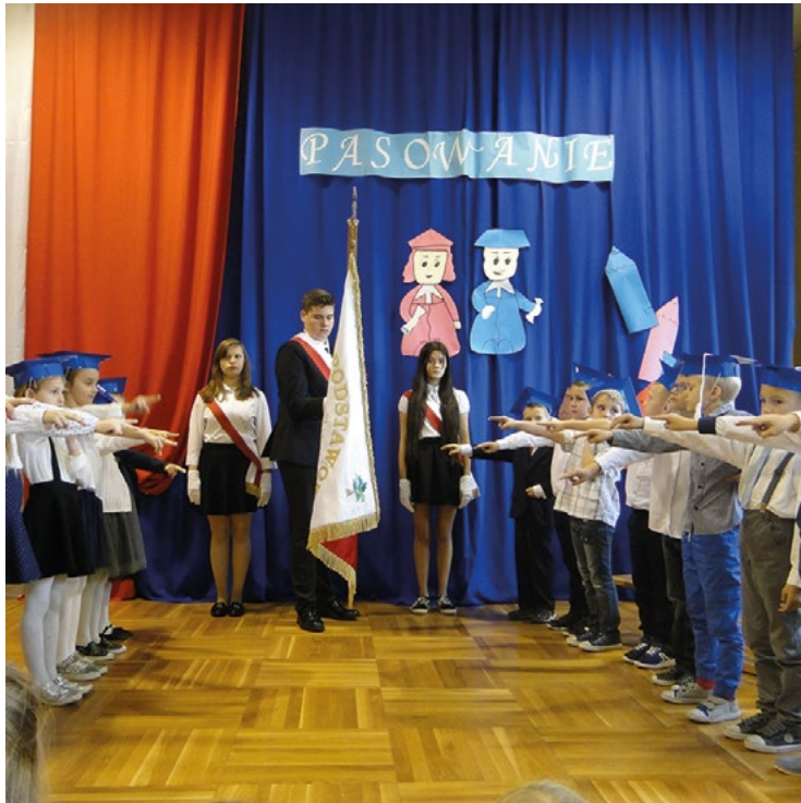
Pasowanie na ucznia w Pustkowie Żurawskim

Uczniowie klas pierwszych zostali oficjalnie przyjęci do grona społeczności uczniowskich we wszystkich szkołach podstawowych Gminy Kobierzyce. Uczniowie przygotowali się do tej uroczystości od początku roku szkolnego. Uczyli się wierszy, piosenek, tańca i wytrwale ćwiczyli podczas prób. Dzieci zaprezentowały programy artystyczne, które przygotowywały pod okiem swoich wychowawców. W odświętnych strojach pierwszoklasiści ślubowali być dobrymi uczniami,