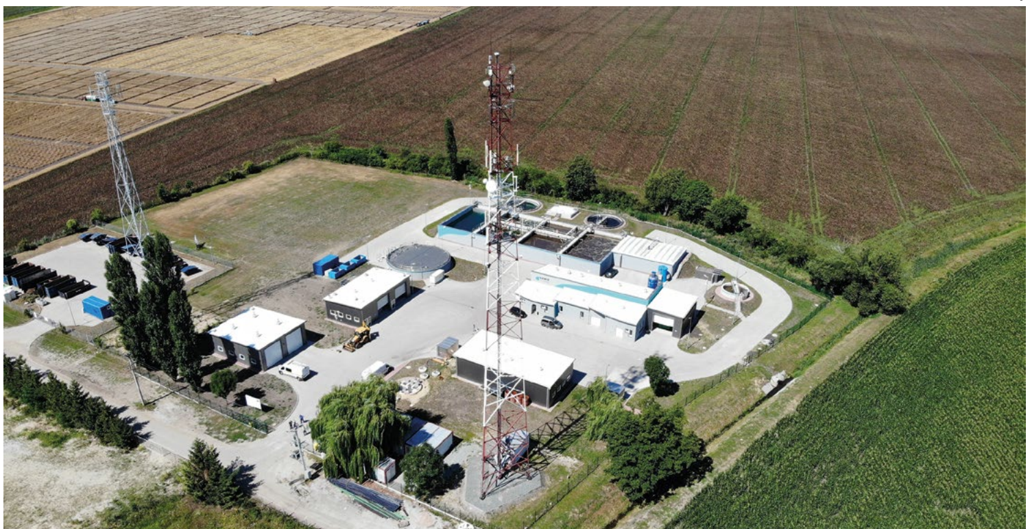
Oczyszczalnia ścieków w Kobierzycach