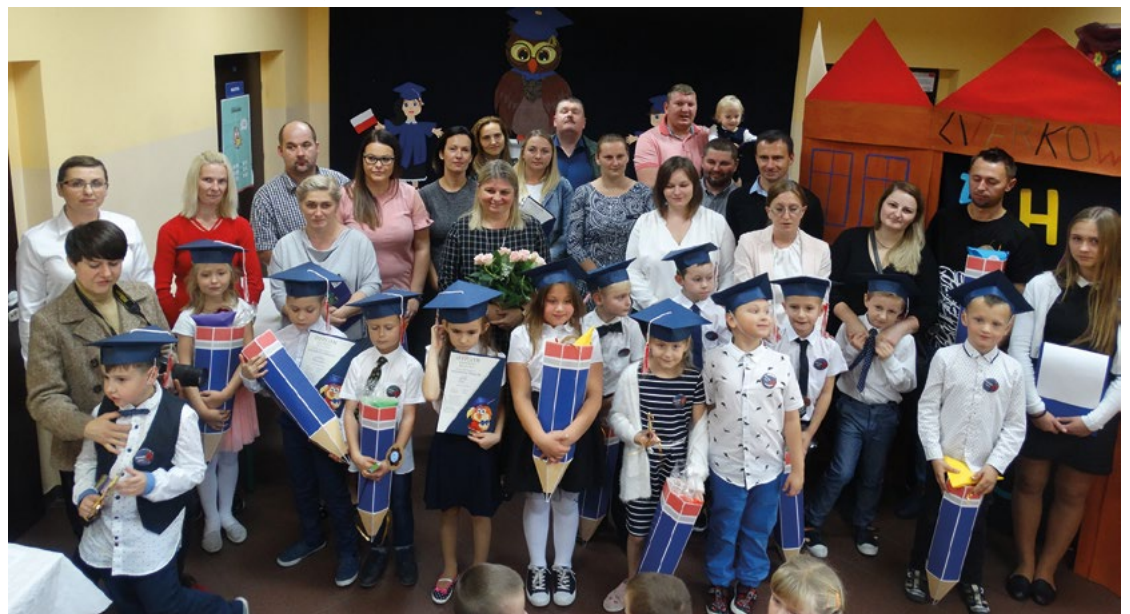
Pasowanie na ucznia w Pustkowie Wilczkowskim