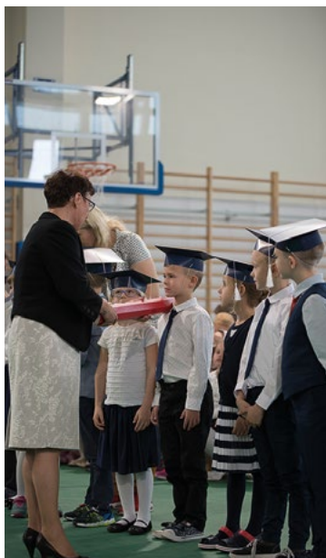
Pasowanie na ucznia w Wysokiej