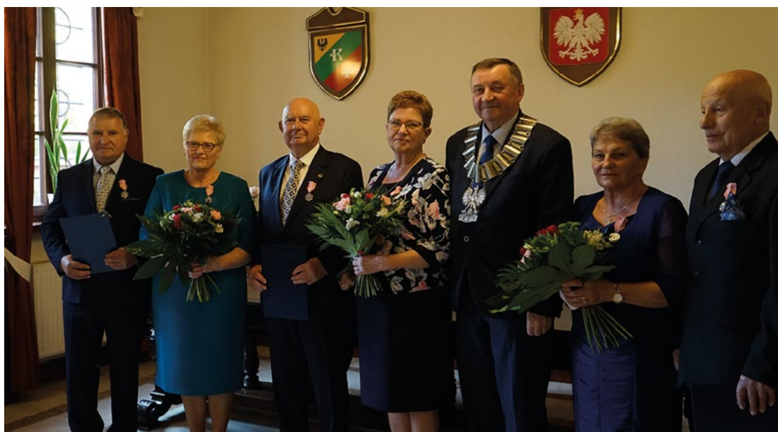
Uroczystość 50-lecia małżeństwa w Urzędzie Gminy Kobierzycze