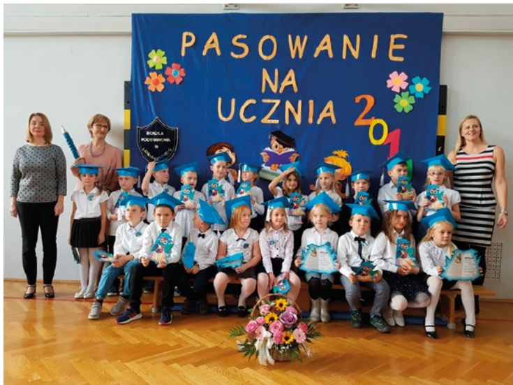
Pasowanie na ucznia w Kobierzycach