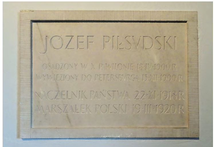
Tablica ku czci więźnia Józefa Piłsudskiego