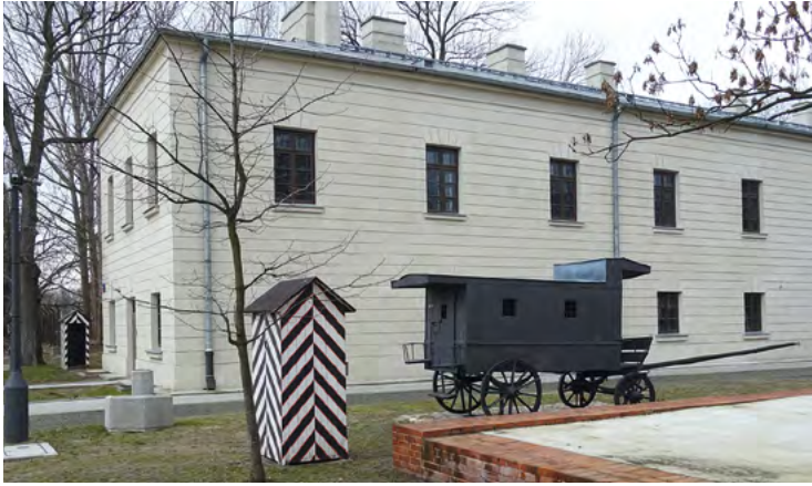
Pawilon X i kibitka

Miły bracie próżna praca, kto tu zaszedł nie powraca – napis wydrapany na ścianie celi przez anonimowego więźnia