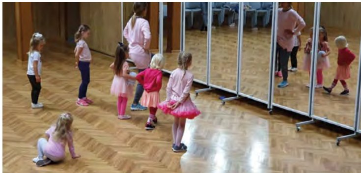
Zajęcia taneczne dla dzieci