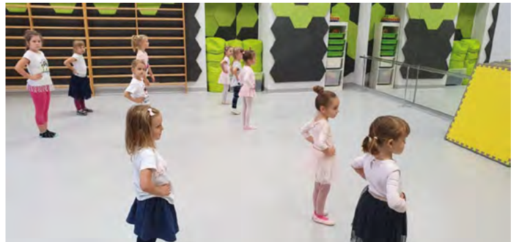
Zajęcia baletowe dla dzieci