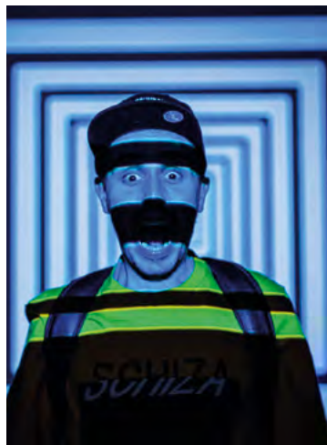
Zdjęcie ze spektaklu Xero 24 w reż. A. Skowrońskiej

Zachęcamy do uczestnictwa w zajęciach prowadzonych w ramach Świetlic Profilaktyki Środowiskowej w wielu miejscowościach Gminy Kobierzyce oraz zajęciach realizowanych w ramach programu Pora dla Seniora .