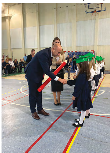
ZSP w Wysokiej