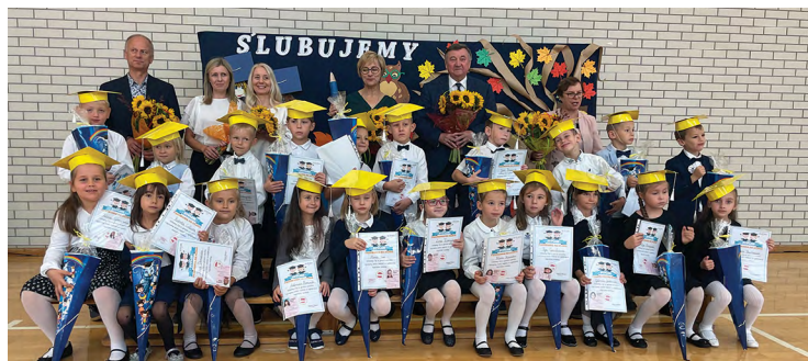
SP w Kobierzycach