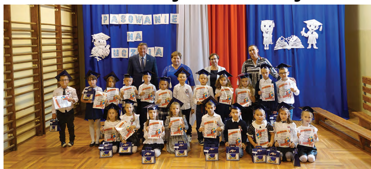
ZSP w Pustkowie Żurawskim