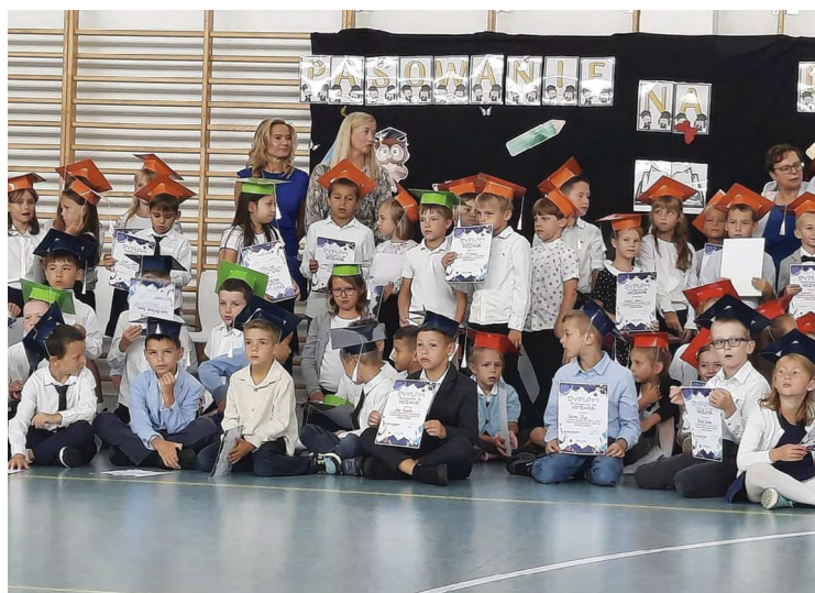
ZSP w Tyńcu Małym

Pasowanie na ucznia to ważna uroczystość dla każdego pierwszaka. To ważny moment, w którym pierwszoklasiści składają ślubowanie, są pasowani na uczniów i oficjalnie dołączają do społeczności szkolnej.