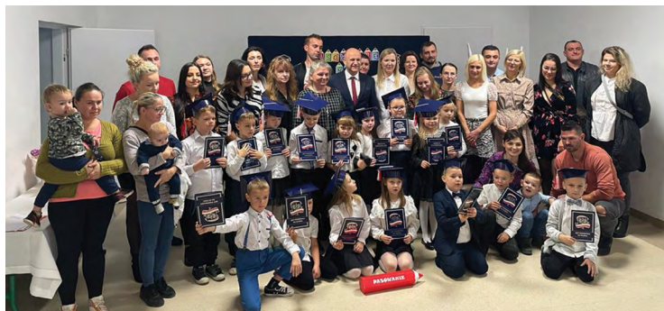
SP w Pustkowie Wilczkowskim