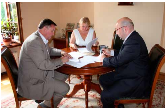
Podpisanie umowy na wykonanie projektu zespołu szkolno-przedszkolnego w Wysokiej

nymi (parkingami na 88 miejsc postojowych), zatokami autobusowymi, placami utwardzonymi, obiektami małej architektury oraz obiektami, urządzeniami i infrastrukturą techniczną. W Zespole w Tyńcu Małym będą się znajdowały też m.in.: place zabaw dla dzieci (przedszkole), plac do imprez plenerowych ze sceną, plac apelowy, urządzenia sportowe: bieżnie, trasa do biegów długodystansowych, pagórek saneczkowy.