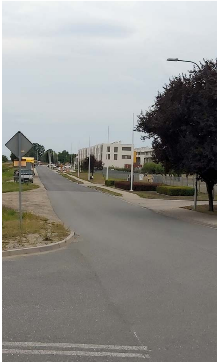
Bielany Wrocławskie, ul. Błękitna