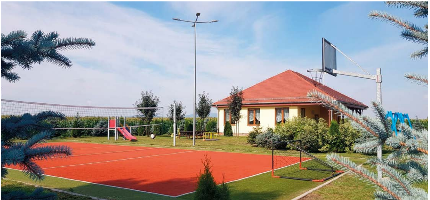
Boisko w Budziszowie