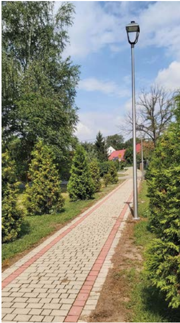
Księginice, ul. Podolska

W poprzednim wydaniu biuletynu informacyjnego Kobierzyce Moja Gmina - Moja Wieś dokonaliśmy pierwszej części przeglądu najważniejszych inwestycji realizowanych w 2019 roku w Gminie Kobierzyce. Teraz przybliżymy inwestycje związane z budową dróg, chodników i oświetleniem.