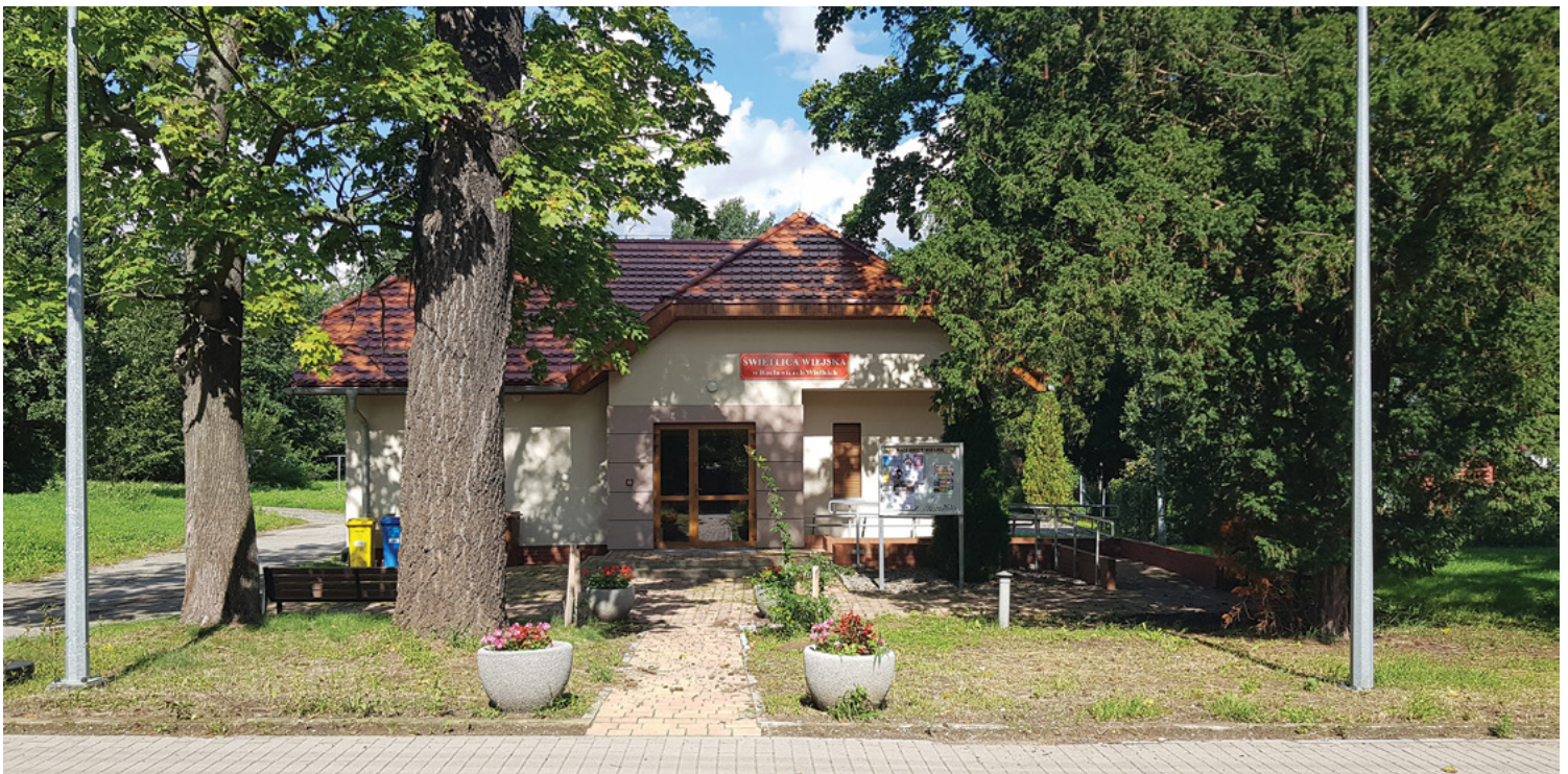
Świetlica w Raclawicach Wielkich