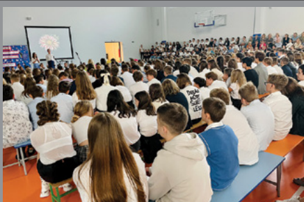
Rozpoczęcie roku szkolnego 2022/2023 / str. 5