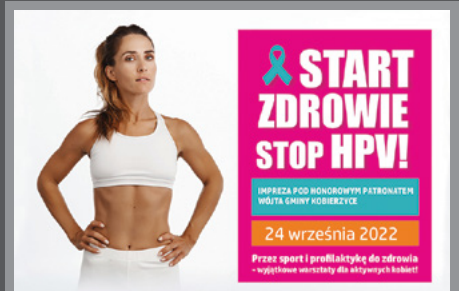
Start zdrowie, stop HPV / str. 12

START ZDROWIE STOP HPV! IMPREZA POD HONOROWYM PATRONATEM WÓJTA GMINY KOBIERZYCE 24 września 2022 Przez sport i profilaktykę do zdrowia - wyjątkowa uniwersyta dla aktywnych kobiet!