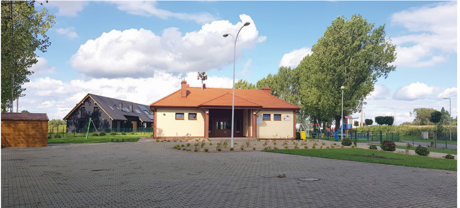
Świetlica w Chrzanowie

– Jaki wpływ na realizację programu budowy świetlic ma obecna sytuacja polityczno-gospodarcza?