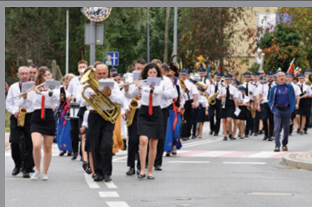
Dożynki Gminne / str. 6