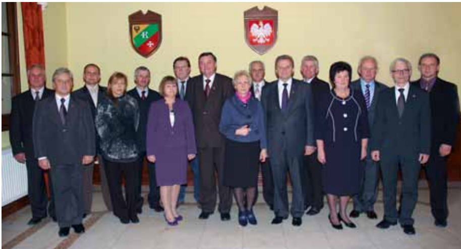
Radni nowej kadencji