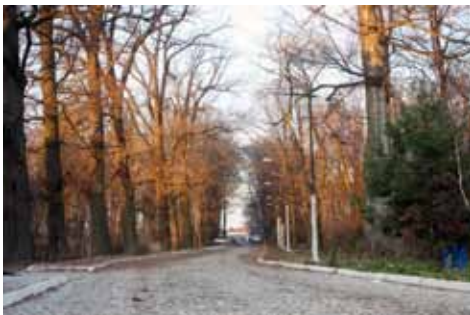
Tyniec Mały, ul. Parkowa