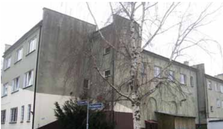
Gminne Centrum Kultury i Sportu w Kobierzycach przed rozbudową