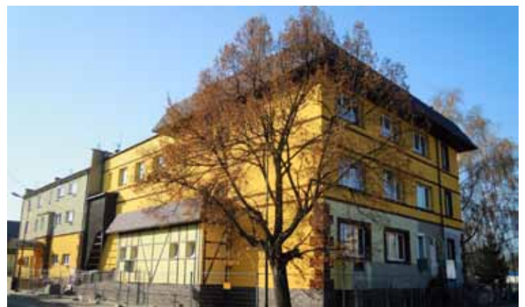
Gminne Centrum Kultury i Sportu w Kobierzycach po rozbudowie