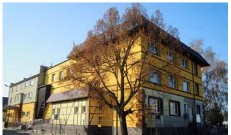
Gminne Centrum Kultury i Sportu w Kobierzycach po rozbudowie