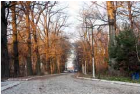
Tyńiec Mały, ul. Parkowa