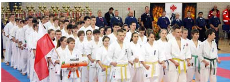
Mistrzostwa Europy w karate shin-kyokushin, w Kobierzycach