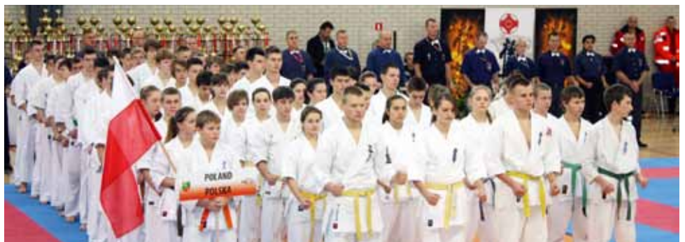
Mistrzostwa Europy w karate shin-kyokushin, w Kobierzycach