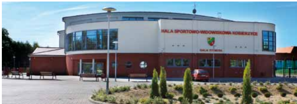
Hala sportowo-widowiskowa w Kobierzycach

Ryszard Pacholik - Taką inwestycją było niewątpliwie zakończenie i oddanie do użytku nowoczesnej hali sportowo-widowiskowej w Kobierzycach. Już pierwsze miesiące po jej otwarciu potwierdziły, że decyzja o jej budowie ze środków gminnych, była ze wszech miar słuszna. Rozegrane w Kobierzycach Mistrzostwa Europy w karate shin-kyokushin zakończyły się sukcesem sportowym, obiekt świetnie zdał egzamin. W przyszłości planujemy organizację podobnych imprez. Najważniejsze jest jednak to, że na co dzień hala służy dzieciom i młodzieży szkolnej, sportowcom i arty-