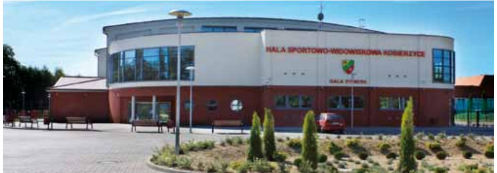
Hala sportowo-widowiskowa w Kobierzycach