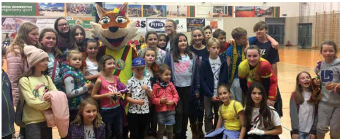
„Kulturalni kibice” ze szkoły w Wysokiej