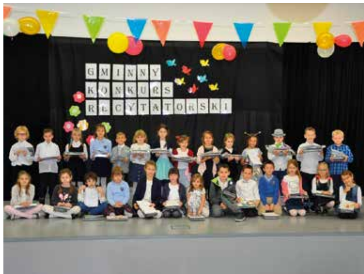
Laureaci konkursu recytatorskiego w Tyńcu Małym