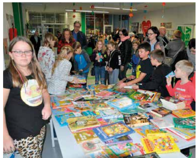
Kiermasz książek cieszył się powodzeniem