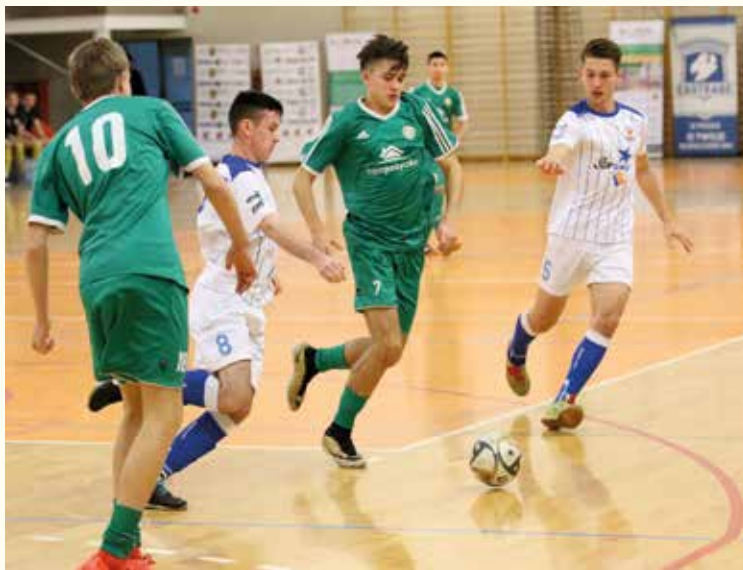
Rywalizacja stała na wysokim poziomie

drużyn podzielonych na dwie grupy rywalizowało systemem „każdy z każdym” o awans do kolejnej rundy. Rywalizacja