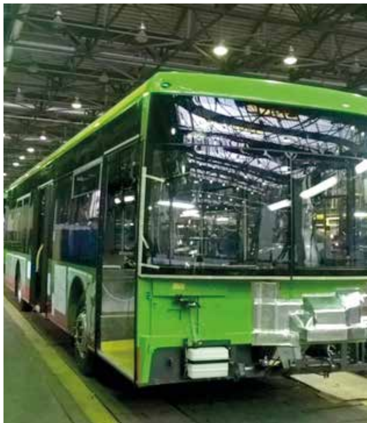
Nowe autobusy dla Gminy Kobierzyce