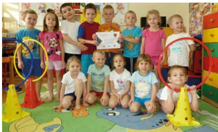
W zdrowym ciele – zdrowy duch!