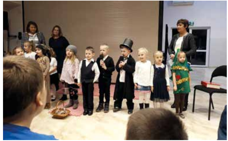
Mali aktorzy zagrali wspaniale