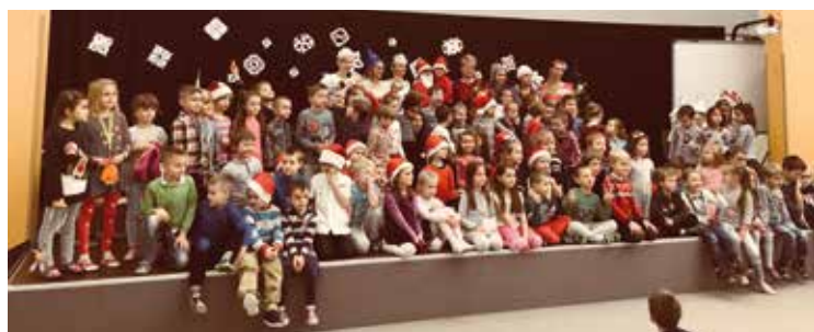
Pamiątkowe zdjęcie widzów z aktorami