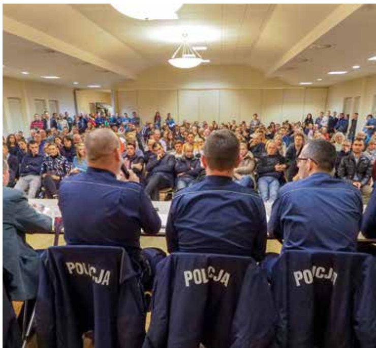
Na zebranie przyszło wielu mieszkańców

cyjnych prowadzonych przez policję oraz zapewnił zwiększenie ilości patroli policyjnych. Zaapelował o wzmożoną czujność mieszkańców.