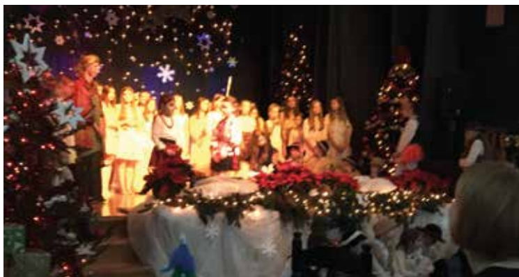
Spotkanie upłynęło w miłej, świątecznej atmosferze