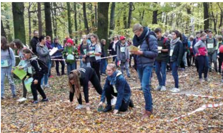
Matematyczny marsz na orientację

Marsze organizowane są od 2003 roku. Ich celem jest połączenie sportu i rekreacji z matematyką oraz promocją terenów zielonych Wrocławia i okolic. Jest to obecnie największa popularna impreza na orientację w Polsce. W zawodach uczestniczą 3-osobowe patrole uczniów lub nauczycieli i rodziców. Posługując się mapą i kompasem, muszą odszukać w terenie punkty kontrolne zaznaczone na mapie oraz wyznaczyć na mapie i odnaleźć w terenie tajemnicze punkty kontrolne, będące rozwiązaniami geometrycznych zadań konstrukcyjnych i rebusów. W tym roku Matematyczny Marsz na Orientację odbył się w Parku Zachodnim na wrocławskich Popowicach, a baza zawodów była zlokalizowana w bardzo gościnnej Szkole Podstawowej nr 3. W tegorocznych zawo-