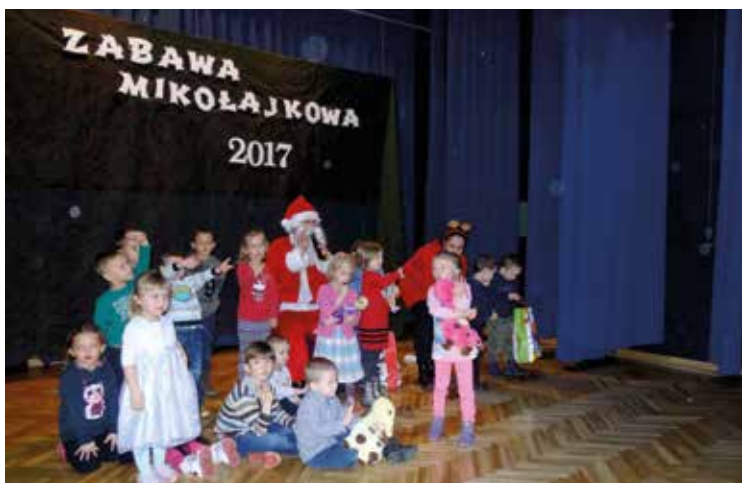
Mikołaj przybył z workiem prezentów

5 grudnia 2017 na zaproszenie Gminnego Ośrodka Pomocy Społecznej w Kobierzycach do naszej gminy przybył Św. Mikołaj z workami prezentów dla 30 dzieci w wieku przedszkolnym. W trakcie zabawy dzieci tańczyły, bawiły się, malowały papierowe bombki, którymi pięknie udekorowały choinkę. Dzieciom bardzo podobają się paczki, wszystkie chciały zrobić sobie zdjęcie z Mikołajem. Aby mógł on do nas w tym roku przybyć pomogli nam nasi przyjaciele: STENA Recycling Sp. z o.o z siedzibą w Pustkowie Żu-