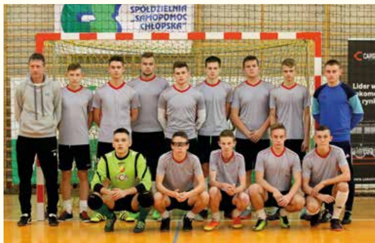
Drużyna juniorów Gminy Kobierzyce

była bardzo zacięta, a poszczególne spotkania stały na wysokim poziomie. W finale GKS Katowice 5:2 pokonał Górnika Polkowice. Dalsza kolejność była następująca: 3m. Błękitni Stargard Szczeciński, 4m. Śląsk Wrocław, 5m. FK Nachod, 6m.