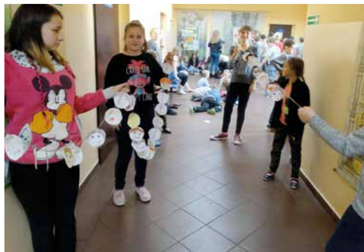
Symboliczna nić porozumienia była bardzo długa