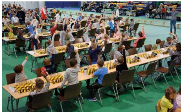
Uczniowie polubili „królewską grę”