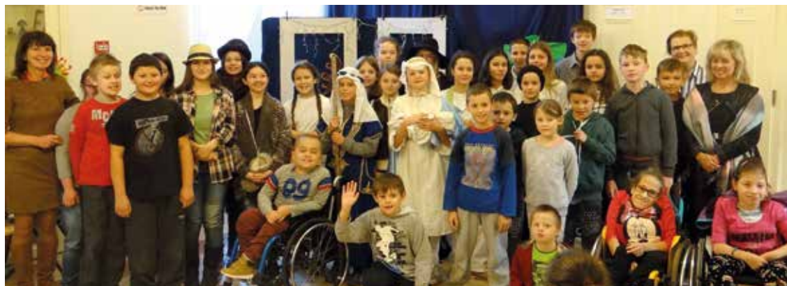
Uczniowie z Bielaw Wrocławskich odwiedzili dzieci z ośrodka w Wierzbicach

nia. Na wstępie mieliśmy okazję zobaczyć „Taniec Śnieżynek” w wykonaniu uczennic z klasy 3 c, a później przedstawienie „Awantura w Przechwałkowie”. Szczególne podziękowania należą się rodzicom, którzy wykonali piękne stroje oraz zaangażowali się w przygotowanie całego przedsięwzięcia. Ogromne podziękowania za zorganizowanie kiermaszu świątecznego kierujemy też do rady rodziców. Zbiórka realizująca idee naszego patrona została przeprowadzona na rzecz Zakładu Opiekuńczo-Leczniczego w Wierzbicach i dzieci z Syrii, aby mogły przetrwać zimę.