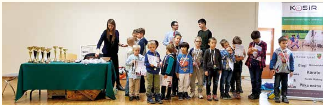
Kategoria dzieci była najliczniej obsadzona