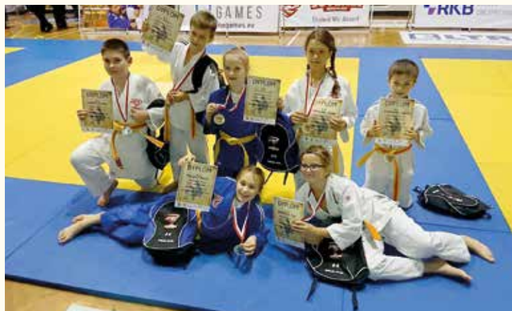
Rok 2017 obfitował w sukcesy judoków z Tyńca Małego